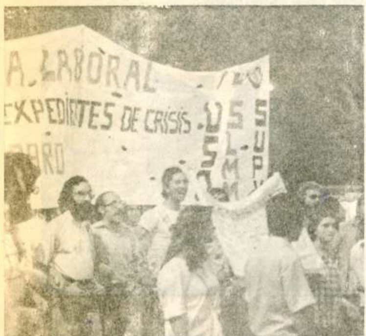
SU. La participación unitaria de los tres Sindicatos dió mucho mayor