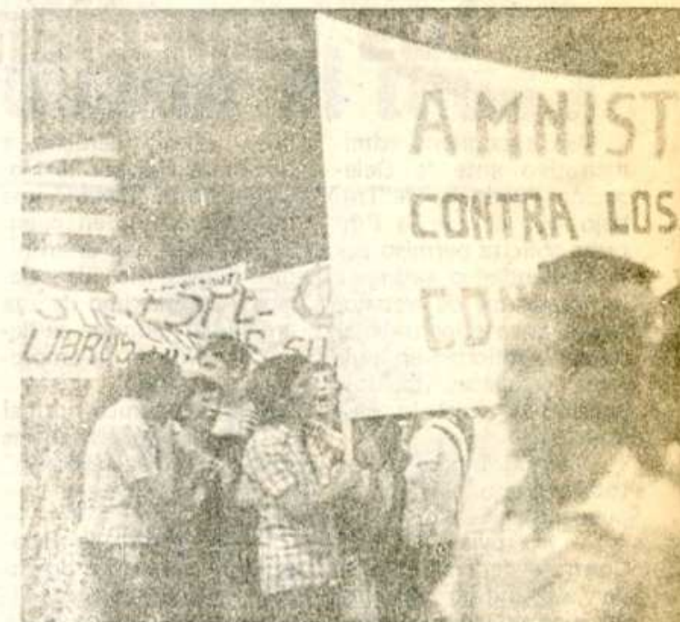
En Valencia los manifestantes portando pancartas unitarias de USO,SLM reivindicando el respeto, fuerza y representatividad a la manifestación.

"El Sindicato Unitario de Euskadi —dice la nota hecha pública por nuestro Sindicato— llama la atención de las centrales sindicales CC.OO., UGT y STV, en el sentido de que estando de acuerdo con las justas peticiones de garantizar el subsidio de desempleo, este no es el camino que garantiza el puesto de trabajo, como tampoco