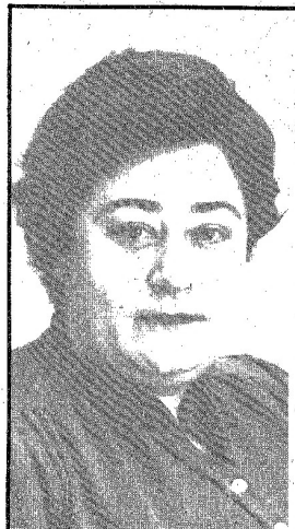
candidata a l'alcaldia de BARCELONA