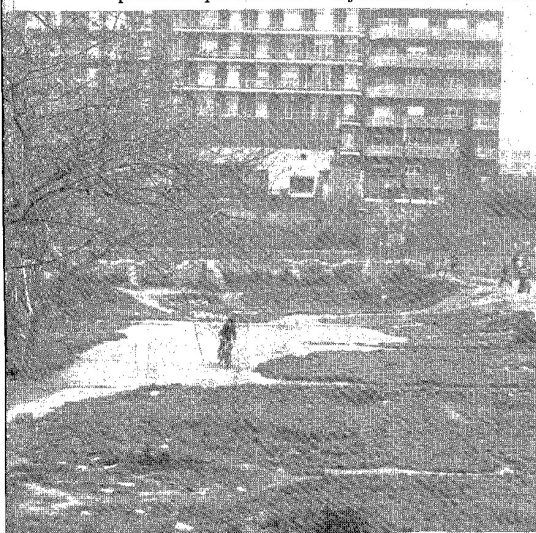
Dalten zones verdes.

Barcelona necessita la veu clara i l'acció ferma del PTC.