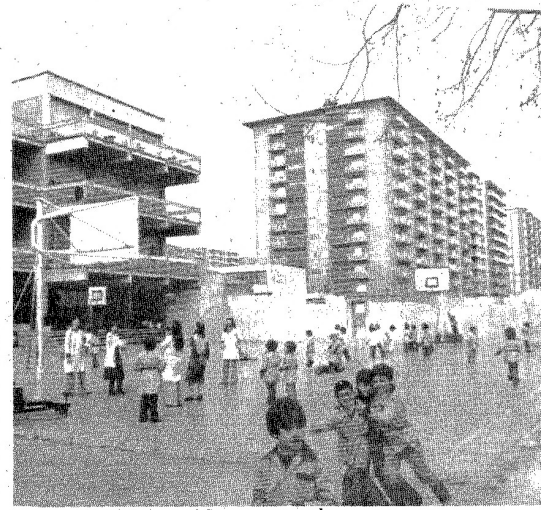
Cap nen, sense escola.