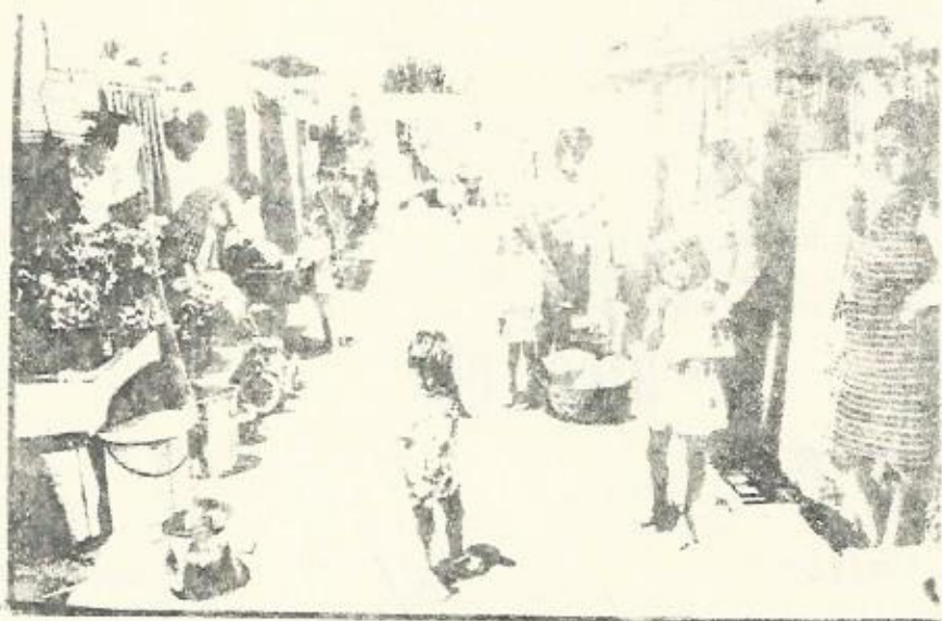
Chabolas de San Blas. Quienes con su trabajo levantan casas y apartamentos de lujo, viven, "gracias" al gran capital, en estas miserables condiciones.

Hasta hace poco, entre los habitantes de los barrios de chabolas de San Blas, había un nivel de conciencia muy bajo y ninguna tradición de lucha. Los vecinos no estaban organizados. La directiva que había entonces en la Asociación no hacía nada para favorecer la lucha por la vivienda.