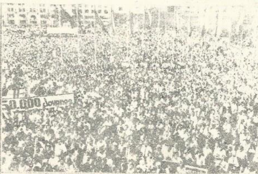
Decenas de miles de jóvenes se manifiestan en Santiago de Chile en apoyo del gobierno de Unidad Popular.

Para llevar a cabo su programa, Unidad Popular se ha comprometido a respetar estrictamente la legalidad, el espíritu y la letra de la Constitución, y a no tocar en nada el aparato del Estado, Ejército, cuerpo de carabineros (policía), etc. Progresivamente, decían, Unidad Popular iría consiguiendo la mayoría en el Parlamento y haciendo reformas democráticas en la Constitución por la vía parlamentaria ayudada por "la presión de las ma-