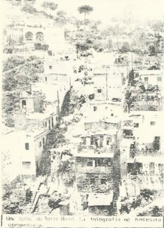
Una calle de Torre Baró. La fotografía no necesita comentario.

Hace años que los vecinos, por medio de sus Asociaciones, realizan innumerables gestiones para mejorar su situación. Algunas de estas gestiones han sido en realidad movilizaciones de gran parte de los vecinos; así por ejemplo la impugnación al Plan Parcial del Ayuntamiento que se realizó mediante la presentación de 3.000 instancias individuales y que fueron repartidas por el barrio y comentadas en bares, tiendas, etc. Recientemente se envió una carta con más de 2.000 firmas pidiendo la puesta del agua y dándole al Ayuntamiento un plazo de diez días para responder.