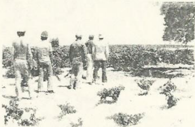
Obreros de la vid del Marco de Jerez durante la huelga

En el momento de lanzarse la huelga, se comenzaban las faenas de injerto, operación delicada y que requiere una gran cualificación profesional. Los salarios para estas faenas especializadas, poda, injerta, castra y recastra, son hasta este momento de 500 ptas. diarias. Los obreros