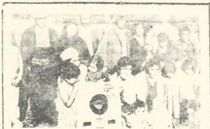
¿Podrán estos campesinos chilenos disfrutar mucho tiempo de sus tierras, conseguidas bajo el gobierno de U. Popular?

La Central Unica de Trabajadores, sindicato unitario, se ha ofrecido repetidas veces al gobierno para organizar patrullas de vigilancia, para requisar, conducir y proteger los camiones en paro, etc., pero el gobierno ha preferido hasta ahora apoyarse en el Ejército y la policía para mantener el orden, antes que en la iniciativa creadora y la movilización revolucionaria de las masas. Así se prolonga indefinidamente el paro de propietarios de camiones que, a medida que el gobierno va cediendo progresivamente a sus reivindicaciones, exigen otras nuevas; así siguen actuando en la impunidad los comandos terroristas.