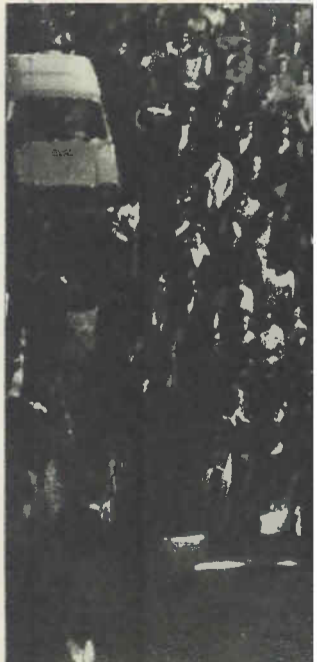
de "Punto y Hora"