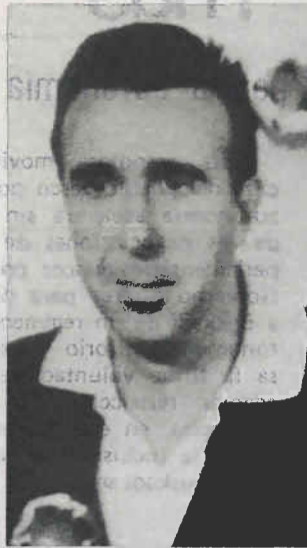
Asesinado por la “Triple A”

ción de indefensión en que nos encontramos todos, pero creo que es un parche político, aunque se haga con la buena voluntad del pueblo. Lo que de verdad hace falta es una policía foral o municipal democrática. De todos modos, es muy preocupante. La solución sería que dentro de la autonomía de Euskadi se pudiera crear nuestra propia policía.