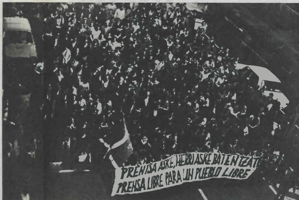
de “Punto y Hora” encabezaron la manifestación de protesta en las calles de Pamplona

y tensión entre la población, que dificulta gravemente la consolidación de la democracia”, y que “sus autores, cualquiera que sea el color de sus banderas, desprecian los supremos valores de la vida, la integridad física y la seguridad de las personas, consustanciales a un régimen democrático”. El comunicado termina exigiendo al Gobierno de la UCD “que ponga fin a esta serie de hechos que constituyen en su conjunto una operación de involución política tendente a impedir el establecimiento de un sistema democrático”. ★