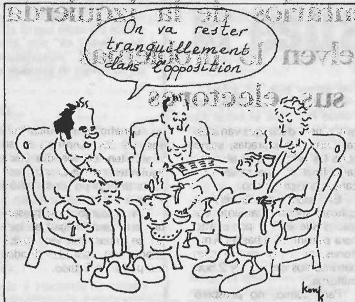
("Vamos a quedarnos tranquilamente en la oposición") Konk, en "Le Monde", 26-IX-77, ridiculiza la posición mantenida por los tres principales partidos de la izquierda francesa: PCF, PSF y MRG.

de los partidos, pero aún en esas circunstancias. ¿Por qué, cuando la izquierda tiene a su alcance la posibilidad del triunfo electoral y el poder llevar a término un programa de transformaciones profundas favorables al pueblo, estos partidos se lanzan penosamente a una disputa absurda en torno a cuestiones intrascendentes, jugando de forma irresponsable con el futuro inmediato del pueblo francés?