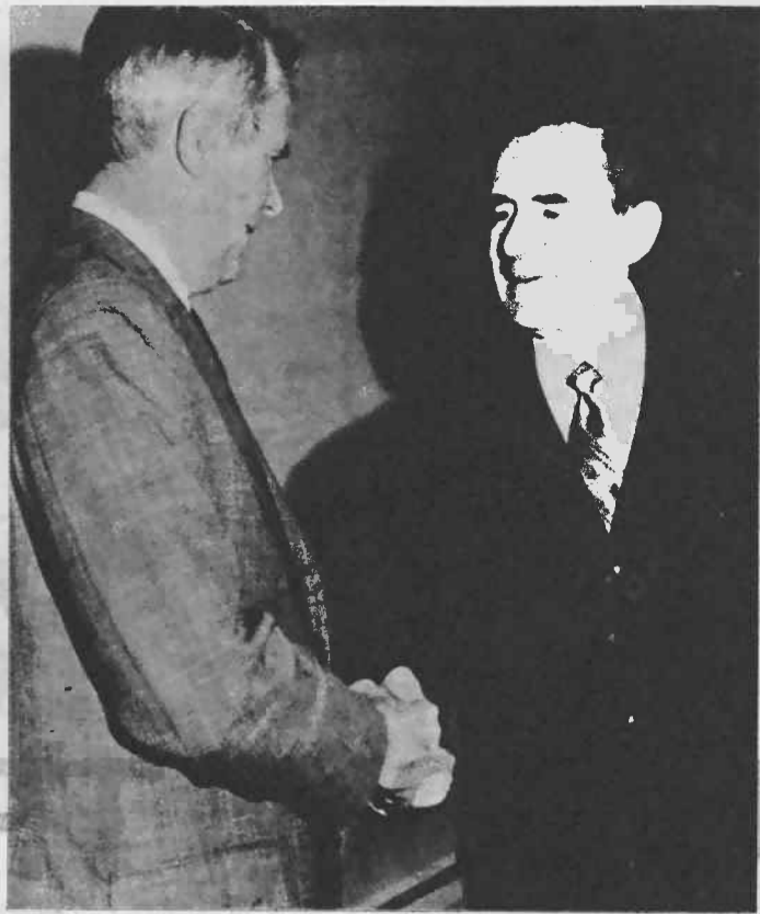
Vance y Gromyko en la firma de la declaración norteamericana-soviética

Norteamericanos y soviéticos pues consideran el conflicto de Oriente Medio como una parte de su disputa por la hegemonía mundial. Así refiriéndose al reinicio de las conversaciones de Ginebra el 30 de septiembre, Vance afirmaba y Gromyko ratificaba que "las numerosas cuestiones de procedimiento (sobre la negociación árabe-israelí) se deben resolver y que ello exige que soviéticos y norteamericanos nos consultemos estrechamente".