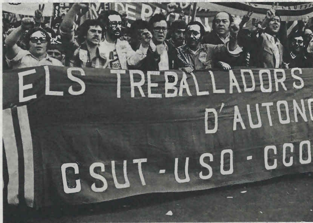
Los trabajadores valencianos han tomado en sus manos la bandera de la autonomía en la Diada Valencià.

Considero muy importante que después de esta manifestación parece que el Plenario de Parlamentarios se decide a actuar, iniciando ya esta semana la primera fase de negociación con el Gobierno. Lo importante para nosotros es crear condiciones preautonómicas, conscientes de que una autonomía plena no la vamos a conseguir antes de que esté elaborada la Constitución. Hoy es posible crear organismos de transición preautonómicos que garanticen el proceso y sean un puente hacia la futura Generalitat.