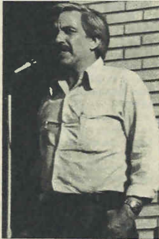
elecciones de 1970, y cómo se desarrollaron los acontecimientos después?

La Unión del Pueblo. — ¿Qué papel tuvo la CUT en la victoria de la Unidad Popular durante las