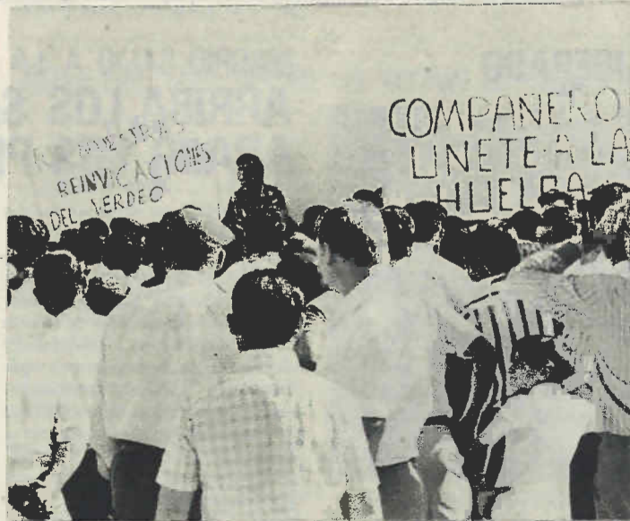
Concentración de jornaleros en Paradas (Sevilla)

El 11 de septiembre, domingo, se celebró en Sevilla una asamblea conjunta a nivel provincial de las centrales que llevan unitariamente la huelga, en la que se acordó convocar la huelga general en todos los pueblos afectados por el problema para el miércoles 14, si ese día los empresarios no han dado una respuesta satisfactoria a sus reivindicaciones. Se acordó asimismo hacer gestiones para la solución del problema ante el gobernador civil y los parlamentarios sevillanos, y crear, a propuesta del SOC, una Coordinadora Permanente de las centrales, hecho que ha fortalecido extraordinariamente la huelga y ha levantado una vez más la moral de victoria de los trabajadores. ★