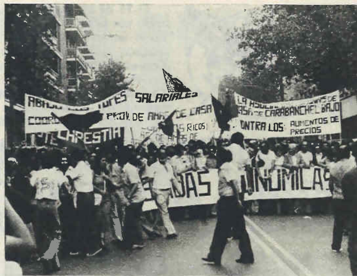
Cabeza de la manifestación de la calle de Alcalá.