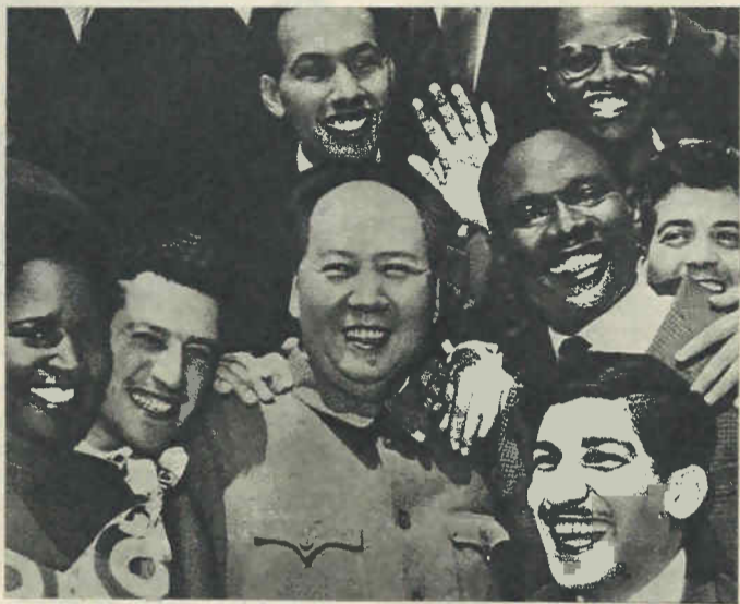
Mao Tse-tung, en 1959, junto a algunos miembros de delegaciones llegadas a Pekín procedentes de Asia, Africa y America Latina.

Esta labor del gran dirigente chino ha tenido una importancia gigantesca para todo el movimiento comunista internacional. También el propio Mao Tsé-tung, a la cabeza del PCCh, ha sido quien ha desentrañado la esencia agresiva