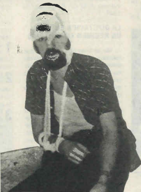
La tortura y la paliza siguen formando parte de la vida cotidiana en las cárceles españolas. En la foto inferior, una muestra del impresionante reportaje fotográfico publicado por la revista Interviu.

tros, lo que evidentemente se contradice con el prolongado retraso de su publicación en el Boletín Oficial del Estado. Al parecer, no hay mucha prisa por que entre en vigor.