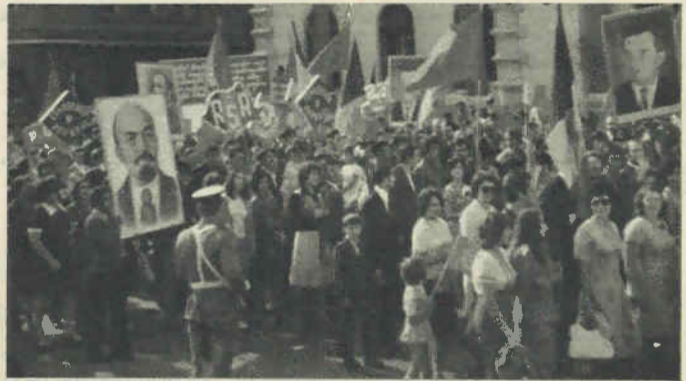
Brasov (Rumania). 23 de Agosto de 1977.

Agradecemos desde estas líneas al Comité Central del Partido Comunista de Rumania y a la redacción de Scinteia las invitaciones que permitieron presenciar los desfiles de Brasov y Bucarest a dos delegaciones de nuestro Partido. ★