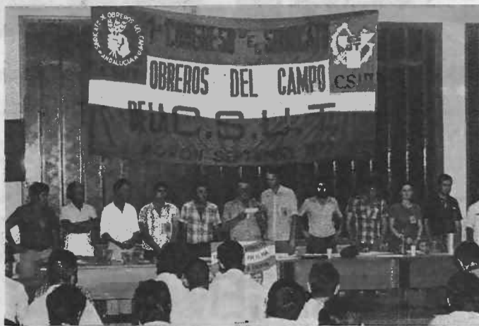
Lectura de las adhesiones al I Congreso

Los días 2, 3 y 4 de septiembre se celebró en Morón de la Frontera (Sevilla) el Primer Congreso del Sindicato de Obreros del Campo de la CSUT, con la asistencia de 250 delegados que representaban a los casi 40.000 afiliados con que cuenta el SOC. Las sesiones del Congreso se realizaron en el Colegio de EGB de Morón, cedido por el Ministerio de Educación con permiso del Gobernador de Sevilla. Como protesta por la autorización del Congreso, dimitió el Ayuntamiento del pueblo en pleno, que de forma caciquil se había opuesto reiteradamente a su celebración.