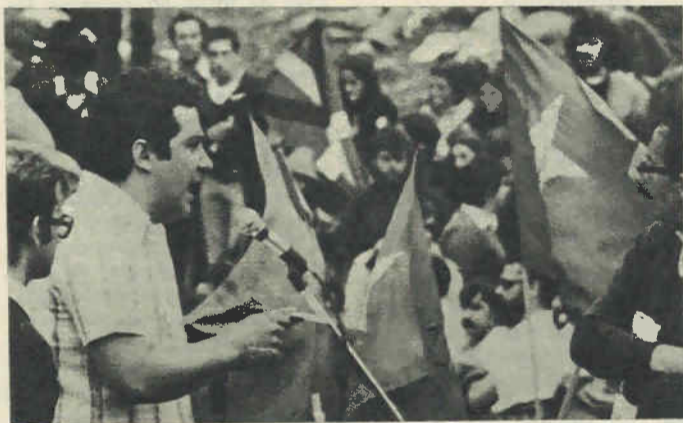
Compains, en el acto final de la Marcha por la Libertad de Euskadi.