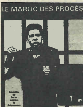
Se ha editado en París el libro "El Marruecos de los procesos".

munistas marroquí y la Unión Socialista han reafirmado una vez más su posición chovinista y expansionista ante la cuestión del Sahara. Allí Yata, presidente del Partido Comunista, ha llamado "traidores a la patria" a los acusados en el Proceso de Casablanca, por mostrarse solidarios con la lucha de liberación saharauí. Por su parte el líder socialista, Buabib, se negó a defenderlos por la misma razón. Quienes apoyamos la lucha del pueblo saharauí no podemos por menos que solidarizarnos con estos hombres y mujeres del pueblo marroquí perseguidos por manifestarse en favor de esa justa lucha. ★