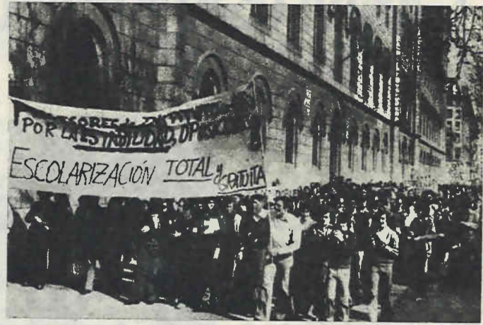
Profesores no numerarios de Instituto y alumnos se manifiestan en Barcelona

La Unión del Pueblo. — ¿Qué planes tiene vuestro sindicato pa-