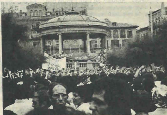
"Navarros, guipuzcoanos, vizcaínos y alaveses tenemos en común muchas más cosas de las que nos separan".

que, optando por esa salida unitaria, nos negaremos a que la misma constituya una mera suma de provincias y de poderes provincianos. Euskadi es algo más que la sola unión administrativa de las cuatro provincias. Es una realidad nacional porque su pueblo tiene conciencia y voluntad nacional. Voluntad que hoy se concreta en el afán conjunto de organizar un régimen autonómico y democrático con instituciones de poder elegidas por sufragio universal, directo y secreto, reguladas en las normas de un estatuto que tanto navarros, como guipuzcoanos, vizcaínos y alaveses habrán de aprobar.