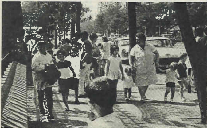
Ante el nuevo curso, continúan sin solución los viejos problemas

Si el Gobierno sigue empeñado en no querer solucionar un problema tan vital, éste volverá a estar presente en las reivindicaciones de la próxima huelga general campesina, único camino que se deja a los agricultores y ganaderos para lograr que se solucionen las cosas. De momento son ya bastante las resoluciones de asambleas y de organismos directivos de Uniones de Campesinos que llaman a una campaña general de no pagar la cuota empresarial, si el Gobierno no da una solución inmediata y satisfactoria. ★