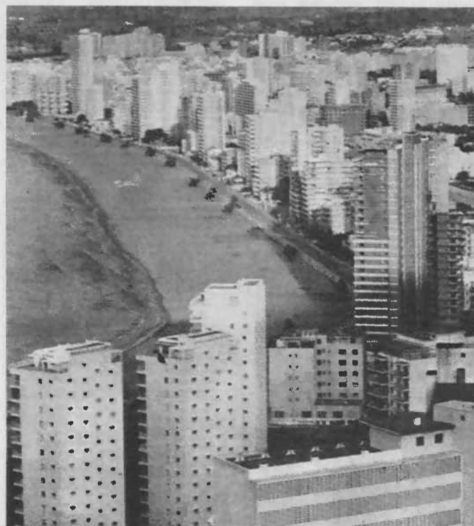
Las huelgas de los trabajadores de hostelería han puesto al descubierto la otra cara de la temporada turística.