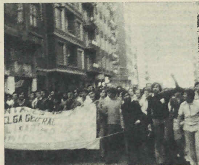
Manifestación en Portugalete, tras la bajada del puente de los 11 trabajadores.

Ochenta días dura ya la huelga de los 8.000 trabajadores de Montajes de Vizcaya. Hasta hace unos días la patronal se mantenía todavía intransigente sin querer negociar, hasta que por fin la unidad y combatividad de los trabajadores les ha hecho ceder y el jueves 11 se sentaba a negociar.