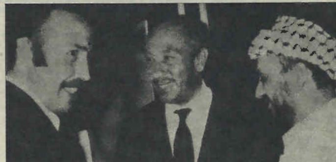
Bumedian y Arafat, líderes árabes que laboran por una paz libio-egipcia, con Sadat (en el centro).

rápida mediación pacificadora en el conflicto, llevada a cabo por diversos dirigentes y estadistas árabes: el Presidente de la O.L.P., Yasser Arafat, el Presidente de Argelia Huari Bumedian, y otros dirigentes árabes.