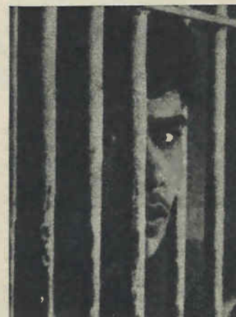
Israel, una gran cárcel para el pueblo palestino.

La campaña propagandística lanzada por esos abogados de Israel —entre los que ha destacado la presencia de algún partido de izquierda—, no debe llevar a error a nadie. Esta gente clama por el reconocimiento israelí, no por ningún afán "democrático" —como dicen— sino por su estrecha dependencia del imperialismo norteamericano, sostén de Israel o por los lazos internacionales de su partido. ★