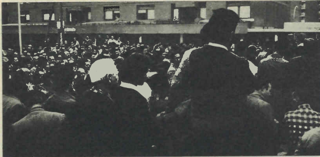
Hoy está plenamente vigente la práctica unitaria y asamblearia de todos estos años. Palencia fué un ejemplo de su sindicalismo de clase consecuente con la defensa de los intereses de los trabajadores.

Para que estos intentos se vuelvan en contra suya y los Comités realmente puedan ser un instru-