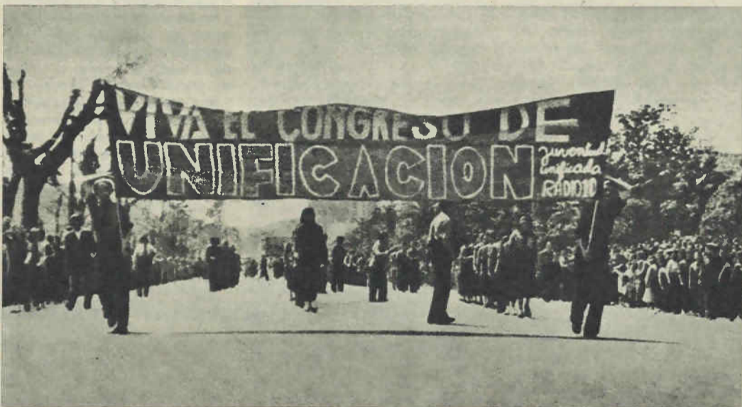
En la República, las Juventudes Comunistas y Socialistas se unificaron bajo la bandera del marxismo-leninismo; esta es un claro ejemplo a seguir para todos los marxistas-leninistas. En la foto, manifestación del Primero de Mayo de 1936 en Madrid.

Todo ello requiere que ORT rectifique su posición actual contraria a la unidad de los marxistas-leninistas, porque con ella está haciendo un grave daño a las masas trabajadoras y oprimidas de toda España, que hoy más que nunca necesitan de un Partido fuerte y sólido que las conduzca en las próximas y duras batallas. Invitamos a la ORT a considerar su actitud y reiteramos las propuestas contenidas en nuestra última carta, porque responden a hechos objetivos, son totalmente justas y permiten reiniciar las conversaciones cara a la unificación más rápida posible en un único Partido marxista-leninista; algo que la clase obrera está exigiendo de nosotros. ★