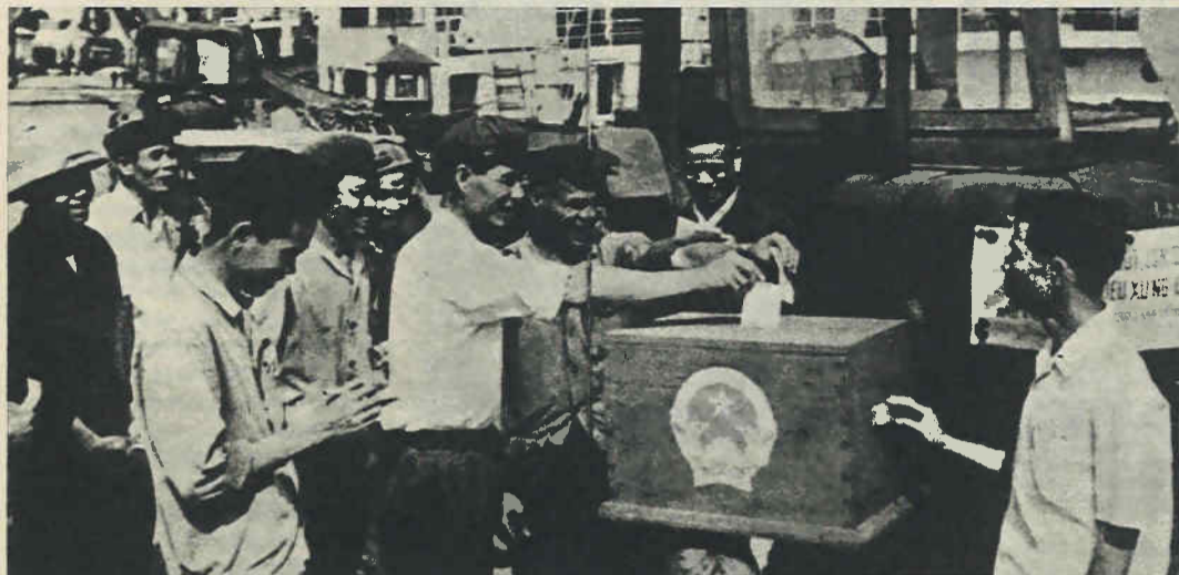
El pueblo vietnamita vota libremente en la patria socialista, liberada del imperialismo y reunificada.

La República Socialista de Vietnam ha conseguido por fin que el Consejo de Seguridad de la ONU, acepte por unanimidad (requisito obligatorio) su ingreso en las Naciones Unidas.