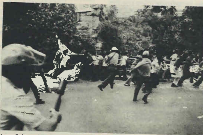
La policía reprime la manifestación, que partió de la Plaça de Cort.