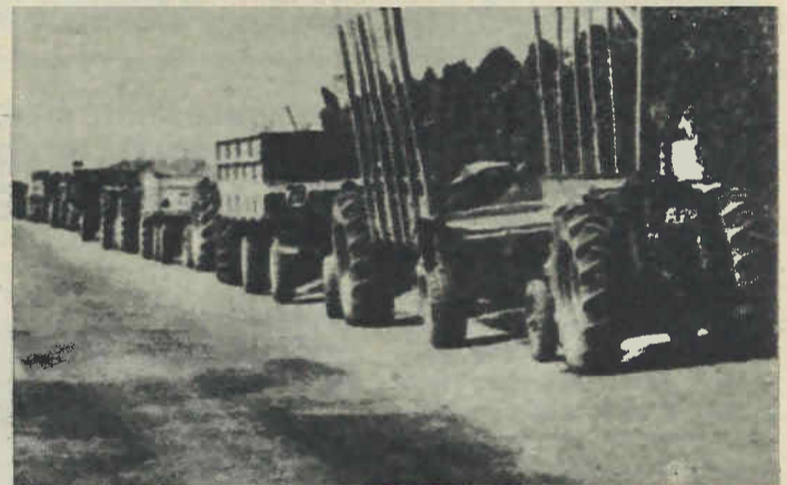
En Trigueros (Huelva) han sacado los tractores a las carreteras, en demanda de precios justos para el trigo.

Ante los problemas planteados lo más conveniente de cara a dar mayor efectividad a la lucha de la presente campaña, consistiría en la celebración de un encuentro de todas las zonas cerealistas del Estado, para que en base a los dos puntos centrales: precios fijados por la Coordinadora y venta en común de toda la producción, coordinar todas las acciones que sea necesario realizar para lograr los objetivos planteados. ★