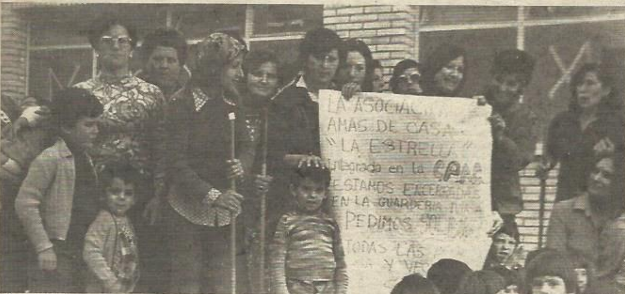
Móstoles (Madrid), hace año y medio, las amas de casa se encerraron en petición de guarderías, uno de los servicios que con urgencia necesitan todas las ciudades, satélites o no, de España

En cuanto al sector agrícola, es básico impulsar y favorecer la creación de cooperativas agrícolas y lecheras y potenciar los cultivos intensivos de hortalizas, patatas y frutales.