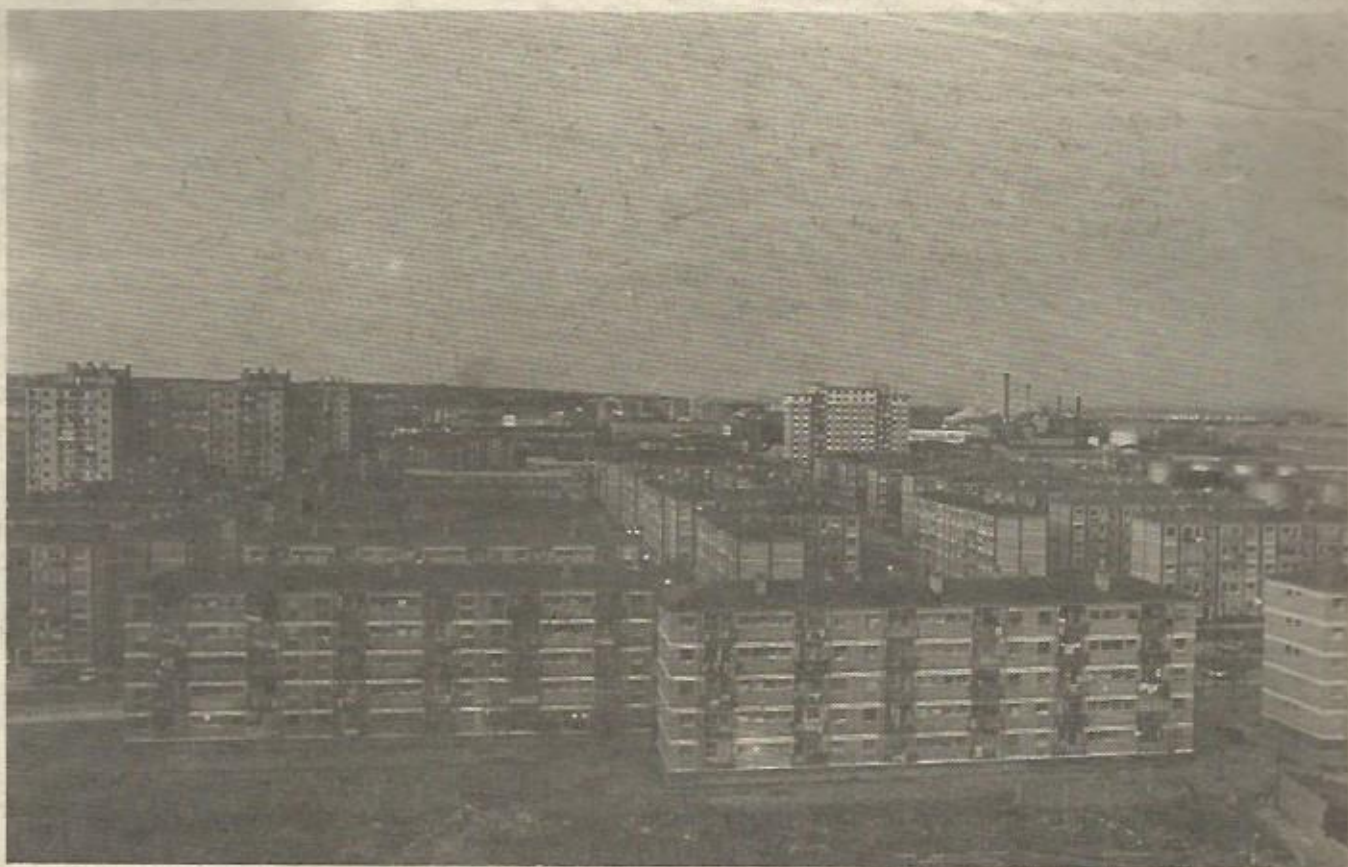
Villaverde. Cerca de aquí puede tener su paso la A-4, si no lo impedimos. A esta monstruosa concentración urbana puede añadirseles más problemas: ruido, contaminación...

Texto: Vicente ALMENARA