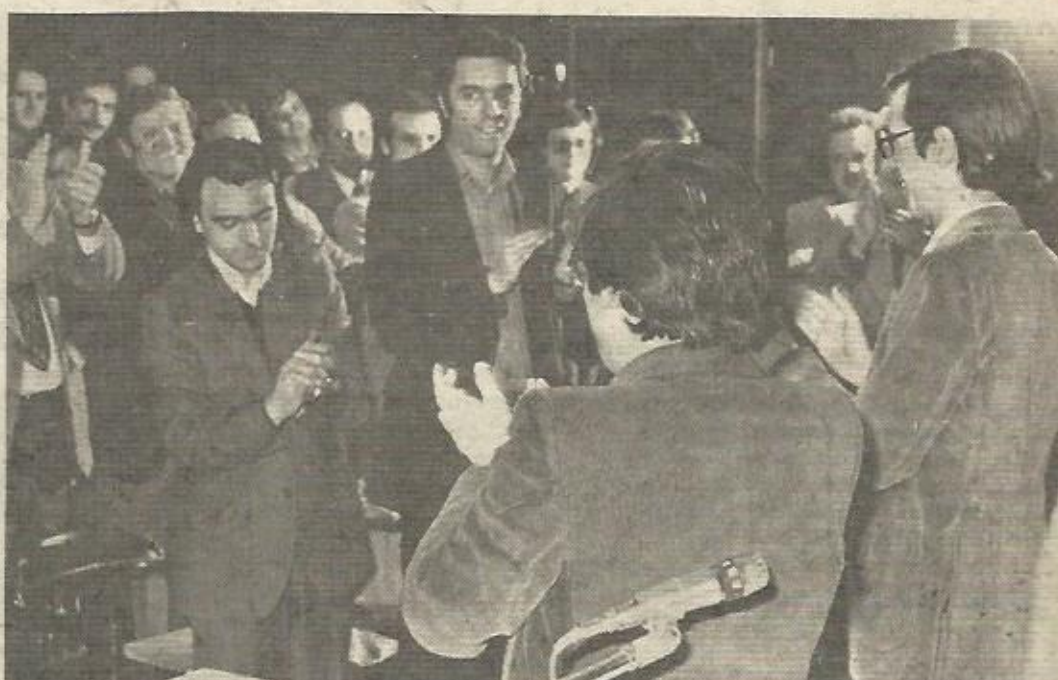
Escenas como éstas, fueron constantes a lo largo del acto.