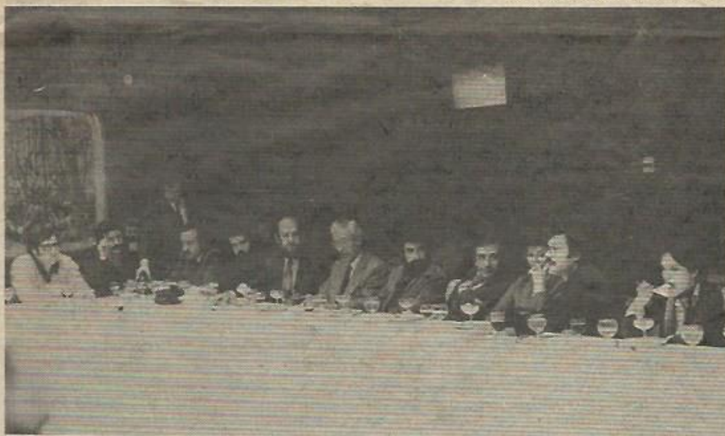
La cena posterior resultó tan interesante como la conferencia

"Todas estas borrascas que nos suceden son señales de que presto ha de serenar el tiempo, y han de sucedernos bien las cosas, ya que no es posible que el mal ni el bien sean durables, y de aquí se sigue que, habiendo durado mucho el mal, el bien ya está cerca".