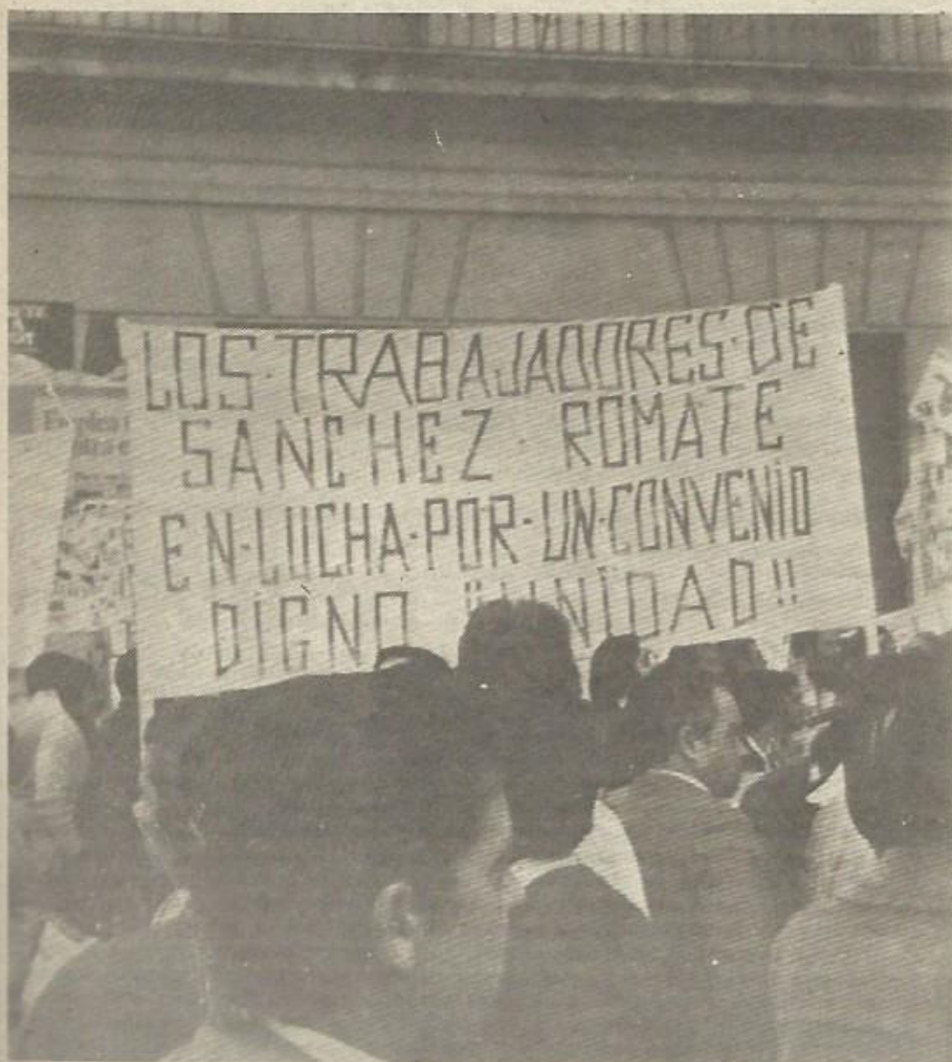
Los monopolios jerezanos explotan cada día más a los trabajadores de las bodegas. Las reuniones de éstos son firmes y unitarias.

Es claro que este tema no debe ser olvidado en ningún momento ni por la patronal ni por los trabajadores y sus representantes, especialmente las centrales sindicales, que deben llevar a cabo todo tipo de gestiones ante el gobierno para aclarar el asunto e impedir algo que tendría consecuencias tan graves para esta industria y sus trabajadores.