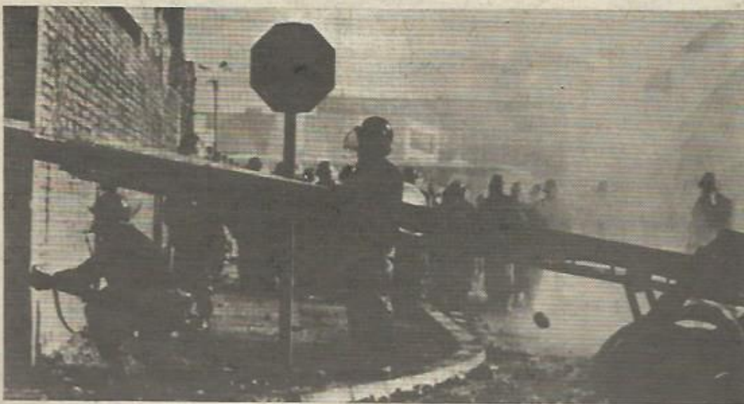
La lucha de los obreros de la siderurgia galvanizó la pasada semana a toda la opinión pública francesa. Los días 6, 7, y 8 de marzo, varias ciudades del norte de Francia, especialmente Denain (Lorena) han sido escenario de una gran ola de protestas de los metalúrgicos que se lanzaron a la calle para hacer oír sus voces de protesta contra el plan de reestructuración de la industria siderúrgica que lanzará al paro a unos 30.000 trabajadores. La violenta respuesta dada por el gobierno con el envío de fuertes contingentes de la CRS (similar a los "especiales") no amilanó en modo alguno a los obreros que les hicieron frente mediante barricadas, todo tipo de improvisadas armas arrojadizas, e incluso escopetas, teniendo lugar unos enfrentamientos sin precedentes desde hace varias decenas de años según las propias palabras del Primer Ministro, Barre.