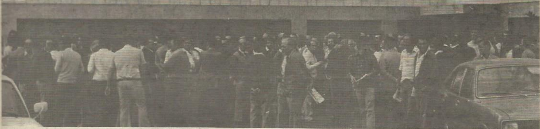
El Gobierno ha vuelto a las viejas prácticas franquistas con los decretos de militarización (F. J. García)