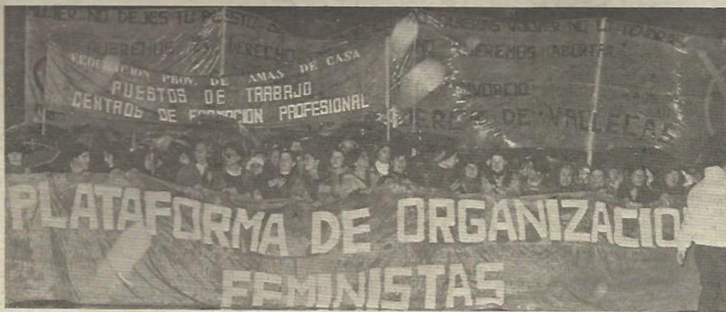
Cabeza de la manifestación de Madrid.

LA ADM DE MADRID INGRESA EN LA PLATAFORMA DE ORGANIZACIONES FEMINISTAS