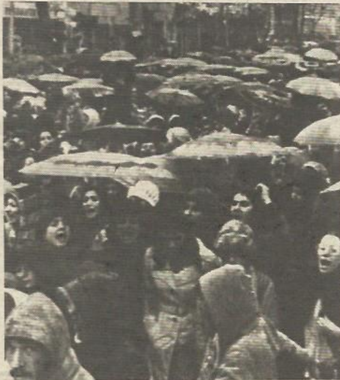
Las mujeres iraníes manifestándose en Teherán en pro de sus derechos ha dado la vuelta al mundo. Tras el triunfo de la rebelión iraní, las mujeres oprimidas y discriminadas secularmente en aquel país, pese a que el nuevo gobierno ha dictado disposiciones que mejoran su situación a como estaban con el Sha, no parecen conformarse y quieren y luchan por una plena igualdad con el hombre, por acabar definitivamente con todas y cada una de las injustas discriminaciones machistas.

—La propaganda falsa del Sha, y de los que son comprados con su dinero, crearon un mito tal sobre las mujeres que los pueblos occidentales piensan que el Islam quiere dejar a las mujeres en casa. ¿Por qué hemos de estar contra la educación de las mujeres?