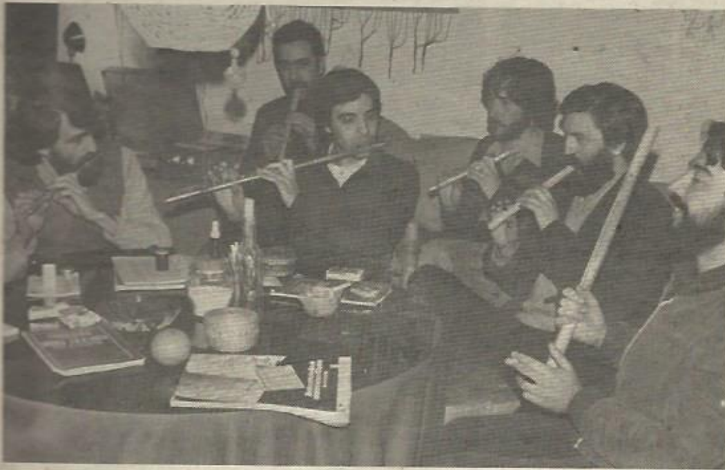
Grupo Al Tall