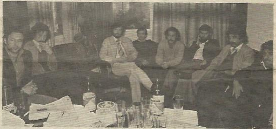
En reunión celebrada el 1 de marzo la Junta Directiva de la AFE decidió por unanimidad absoluta ir a la huelga

El deporte, como ya muchas veces se ha dejado ver en los medios de difusión, siempre ha sido utilizado por los elementos más reaccionarios, que han hecho de él más que una actividad de ocio, una actividad de negocio. Hoy todavía gran parte de éste está siendo manejado por los mismos señores que no han sido apeados del burro ni con la muerte de Franco. Un ejemplo de esto, es la Federación Española de Fútbol y a su cabeza, D. Pablo Porta.