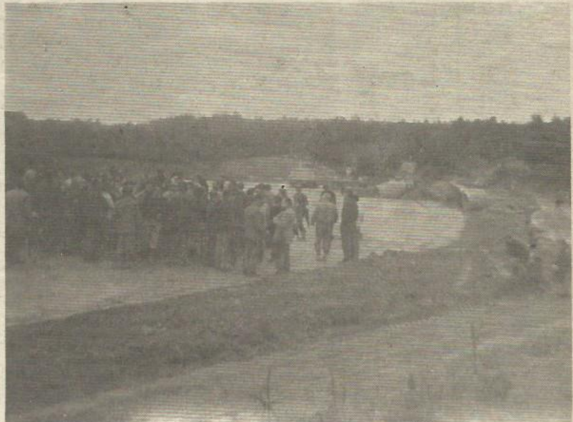
En Galicia los campesinos se oponen a la autopista del Atlántico a causa de las expropiaciones que esta implica

Irún con se caracteriza con un tráfico muy que es canalizada una variante de circunvalación a