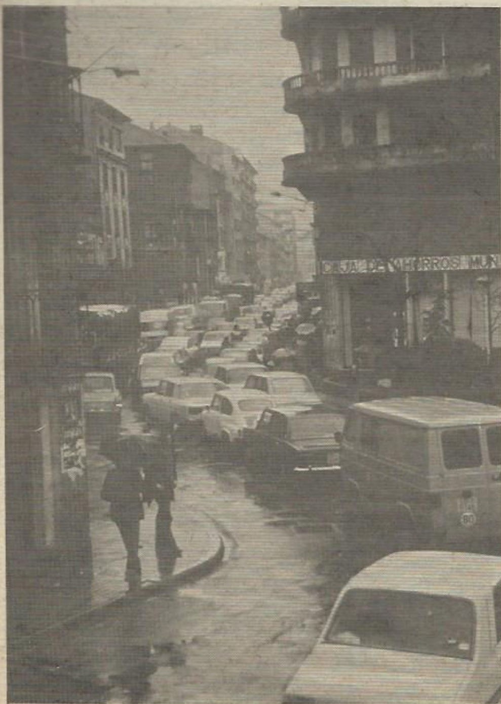
Centro de Rentería