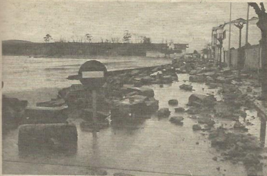
Destrozos causados por los pasados temporales en la Villa de Ares

"Galicia, realidad económica y conflicto social" es un informe realizado por un amplio grupo de profesionales gallegos y por encargo del Banco de Bilbao, que ha decidido recientemente secuestrar los 12.000 ejemplares que estaban preparados para su difusión.