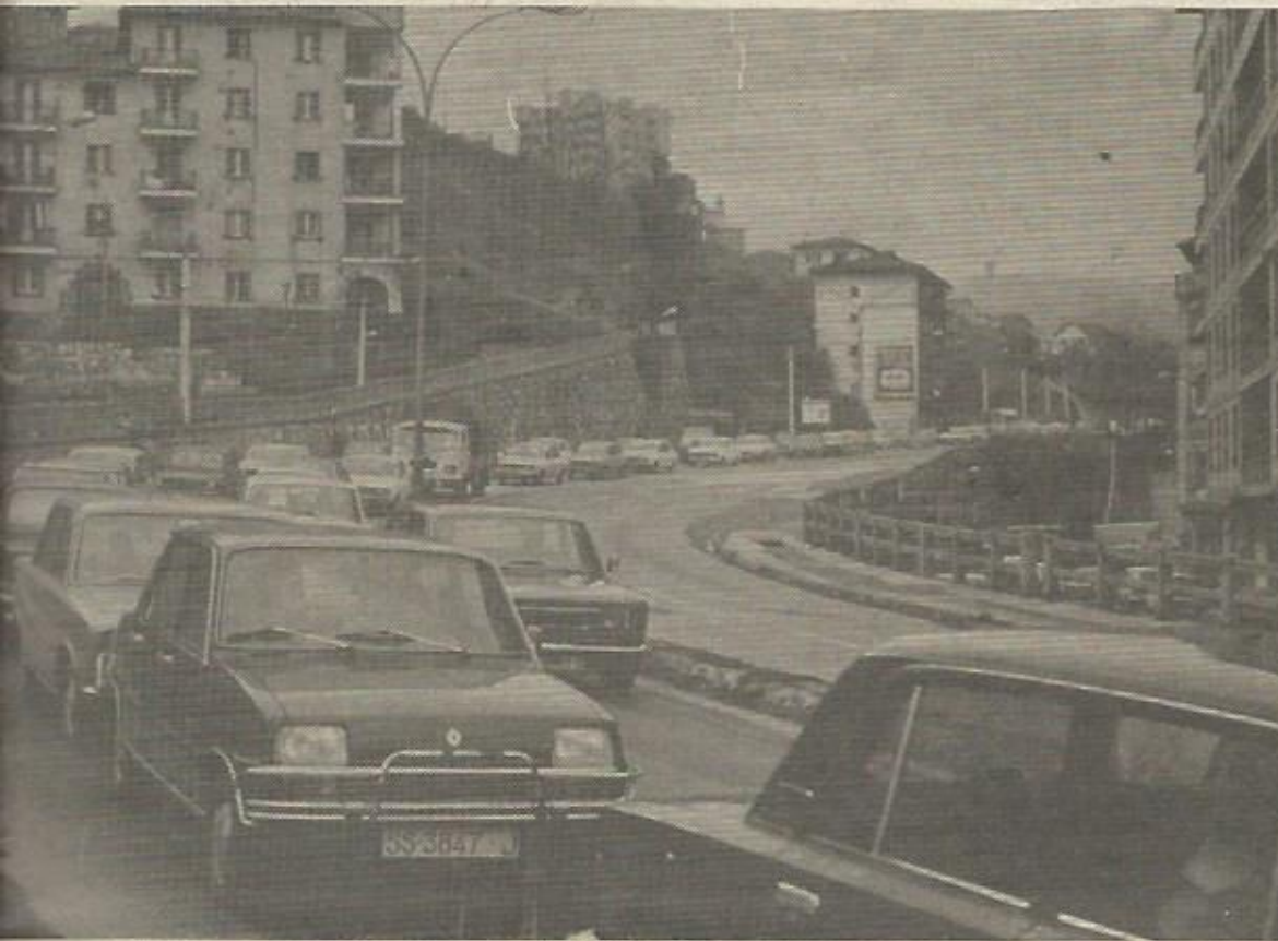
Un semáforo de la CN 1 a su paso por Rentería.

—Esto tiene bastante que ver con la A-2 y la A-4. Fue un ministro de Franco quien se lo inventó, el señor Morones Alfonso, y consiste en la urbanización de grandes parcelas mediante acuerdos con los promotores de las autopistas. Hasta el momento sólo hay dos casos de urbanismo concertado: Meco y Pinto, éste último denegado por COPLACO. Hay que tener en cuenta que con las autopistas se revalorizan los bordes y márgenes de la misma y todo escapa al control de la Administración.