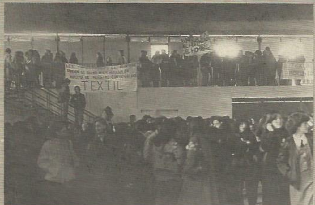
La participación de los trabajadores del textil, fundamentalmente mujeres, en las asambleas celebradas con motivo de la huelga ha sido masiva

Como a pesar de la huelga no se ha llegado a un acuerdo, en esta semana estaban previstos diversos encierros para seguir presionando por una solución justa en este sector que se caracteriza por la existencia de salarios bastante bajos.