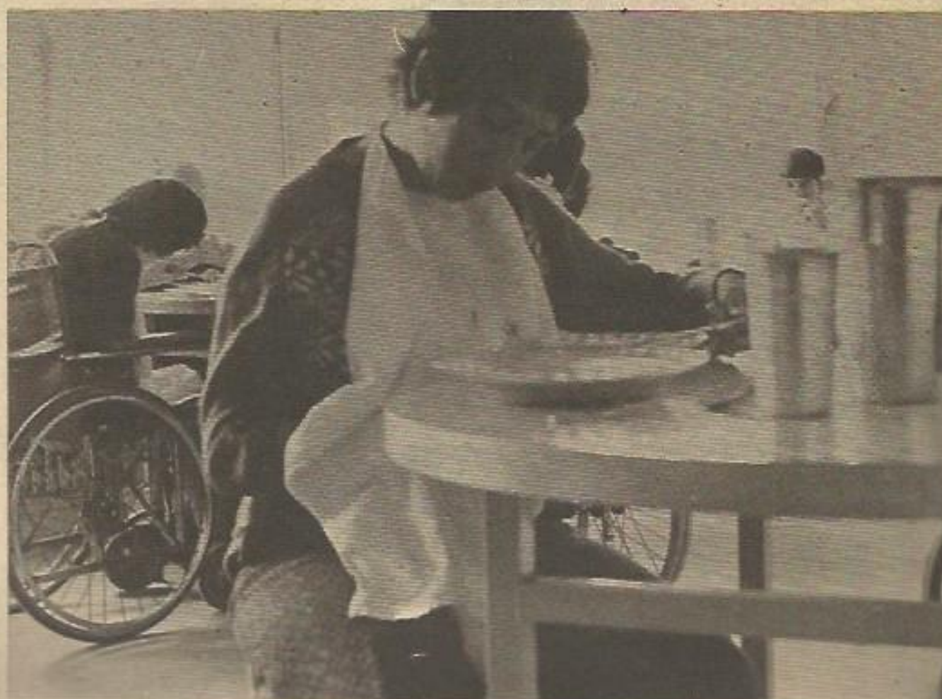
Entre las causas que producen la subnormalidad un 75 por ciento es debido a lo que de en llamarse "cultura de la pobreza" que sufrimos todos en mayor o menor medida.