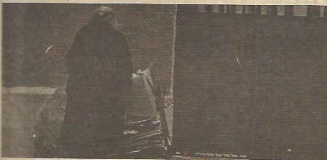
"El actual sistema de producción que describe a nivel de las personas la insolidaridad, la competitividad social... es la culpable de que nuestros ancianos estén marginados"

Entre los diferentes sectores sociales que requieren actualmente una especial atención, tanto en su tratamiento como en el estudio social de sus problemas, se encuentra el grupo de los ancianos, jubilados y pensionistas, es decir, el extenso y mal denominado grupo social de la "tercera edad".