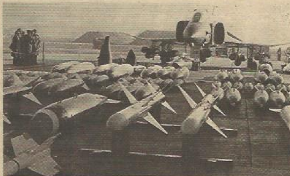
¿Qué pueden pretender las superpotencias con tanto hablar de desarme y paz mientras sitúan sus baterías nucleares por todo el orbe?

CARTER ACELERA LA COLOCACION DE LA BOMBA DE NEUTRONES EN EUROPA. Y LA URSS SITUA MISILES ATÓMICOS EN LA RDA