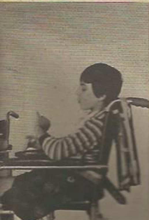
El total apoyo del Estado a la actual situación de marginación del subnormal.