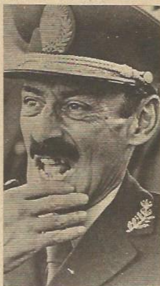
Del Presidente de la Junta Militar de Argentina, General Videla, no han faltado quienes han dicho que él no es el culpable del genocidio cometido contra el pueblo argentino, sino los militares de la corriente ultra. ¿Será esta "razón" la que ha movido a Fidel Castro a invitar personalmente a Videla a la cumbre de los No Alineados?, o ¿serán las buenas relaciones que el dictador argentino mantiene con la URSS?