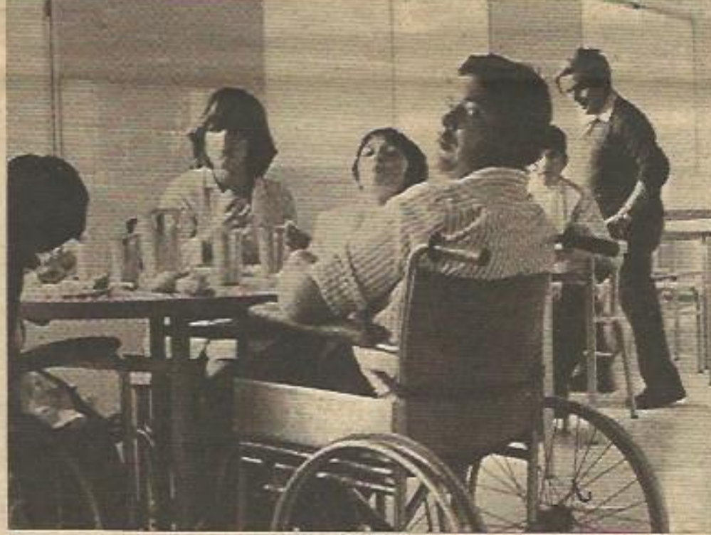
Sólo las soluciones verdaderas y no la caridad y el paternalismo pueden romper con la desconfianza que se advierte en el rostro de muchos subnormales.

noce el portavoz de la FEAPS, VOCES en su número 95 de Abril del 79). Esta afirmación no es gratuita, puesto que dirigentes de asociaciones "húmedas" de la propia FEAPS la han puesto de manifiesto. Un ejemplo es AFANIAS, que recaudó 18 millones en 1978 pero, sin embargo, sigue cobrando cifras altísimas no ya en sus centros de Educación Especial, sino también en sus centros de empleo, llamados "ocupacionales", donde los subnormales adultos "ocupan" su tiempo de recuperación trabajando e, indudablemente, produciendo beneficios.