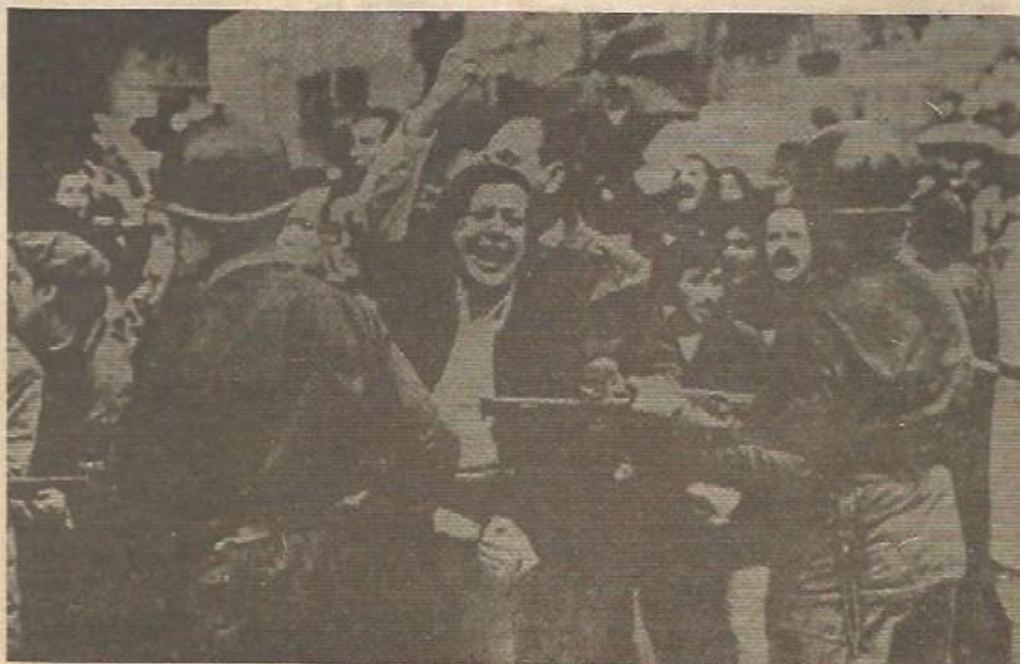
Una intervención armada de las fuerzas represivas de la Junta Militar contra una manifestación en Buenos Aires

"Soy un trabajador argentino; no importa mi nombre; me llamo de igual modo que todos aquellos que han sido, son y serán perseguidos por el fascismo dictatorial de los 'milicos' argentinos encabezados por Videla, representantes directos de los intereses imperialistas, de las multinacionales y la oligarquía". Así comienza el artículo que sobre la situación actual en Argentina, y más concretamente sobre el estado actual y perspectivas del movimiento sindical en aquel país, ha elaborado para La Unión del Pueblo un trabajador argentino, militante del Movimiento Peronista Montonero, con el cual tuvimos ocasión de contactar hace unos días, poco antes de que regresara a su país para reintegrarse a la lucha que su pueblo libra contra la dictadura de Videla. Este es el texto completo del artículo.