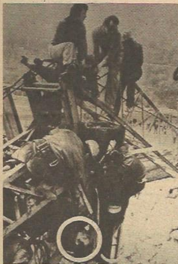
El momento trágico del accidente laboral: no es una casualidad, es una forma más de opresión

cidentes laborales que no son sólo los que normalmente se consideran como tales sino otros que se notan menos de momento, pero que de forma lenta y silenciosa van quebrando progresivamente la salud del trabajador.