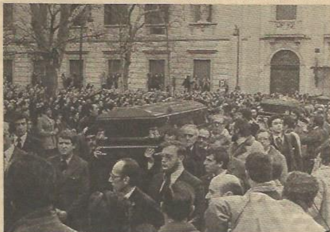
Entierro de los asesinados de Atocha.

—De existir esas posibles amenazas, carecerían de importancia.