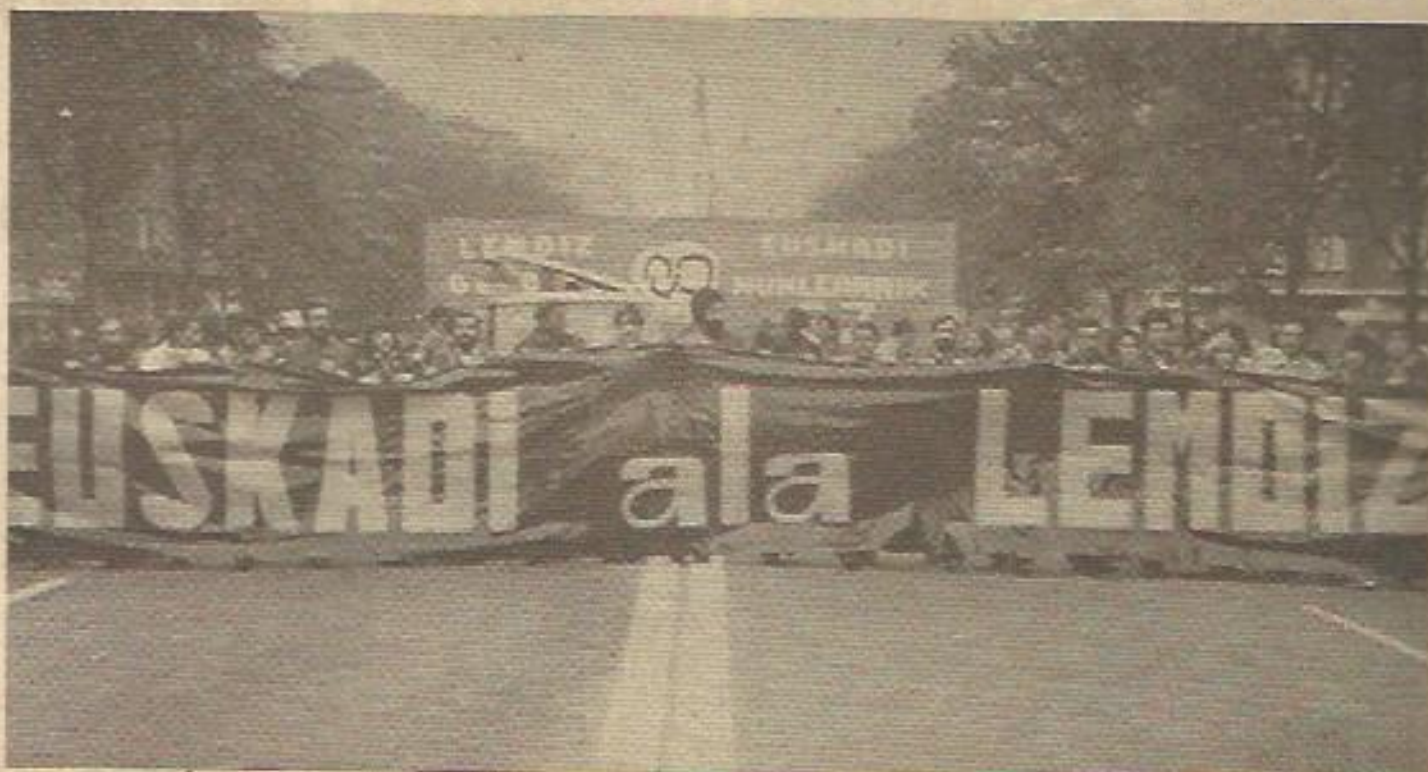
"Euskadi ala Lemoiz" (Euskadi o Lemóniz). Cabecera de la manifestación anti-nuclear de Bilbao

Ya nadie pone en duda que el problema vasco se ha enredado mucho más de lo admisible para la frágil democracia española.