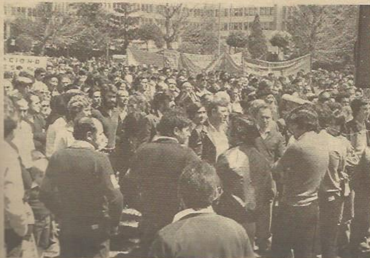
Un momento de la manifestación de León, poco antes de disolverse.

La huelga fue convocada por CC.OO., UGT, SU y CSUT (estas dos últimas centrales fueron excluidas de la comisión negociadora) y la extensión de la misma fue casi total especialmente en Barcelona capital, Baix Llobregat y Vallés occidental y oriental. Se han realizado numerosas asambleas y manifestaciones por todas las comarcas, destacando una asamblea de trabajadores de la construcción el día 25 en el Polideportivo Sant Andreu y una manifestación el día 26 en Barcelona de unos 30.000 trabajadores encabezados por una pancarta que decía: "Construcción contra los topes salariales, por nuestro convenio y por los derechos sindicales" con la presencia de representantes de CC.OO., CSUT, SU y UGT. Al final de la manifestación ante la Delegación de Trabajo un representante de los trabajadores señaló que éstos desean un convenio justo y que si hay laudo, cosa que quiere la patronal, éste no será aceptado.