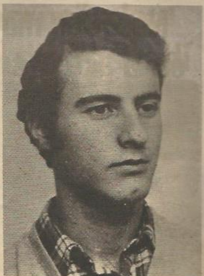
Lerdo de Tejada.

Quedan tantas cosas por aclarar, tantas personas oscuras, que lo primero que exigimos es eso, luz.