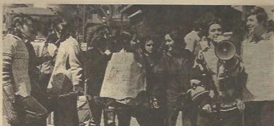
Encadenamiento en Madrid, ante la puerta del MEC, de estudiantes de BUP en contra de la selectividad

MANIFESTACION EN MADRID CONTRA LA SELECTIVIDAD