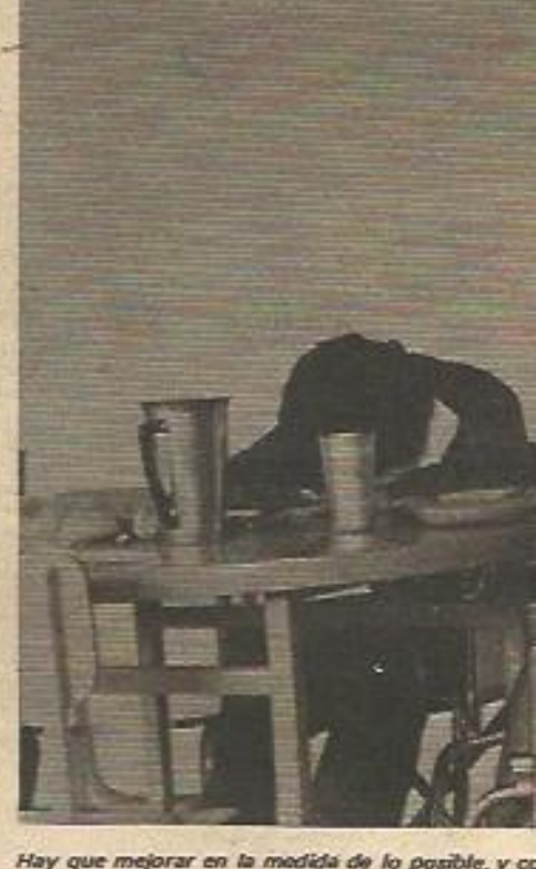
Hay que mejorar en la medida de lo posible, y co...

composición como, en otras palabras las asociaciones que funcionan de esas ya que muchas en barrios pueden de ciento fu "ooper" m torias y re dos. Esto ce falta y mesas insta de Madrid das señoras apoyo de l oos, emp estatales, locación o por otra p más sencill ugo imagi donde ino presentes normales ninguna o tocolo ni ca a las p tas asoci o pueblos, o depender serios prob