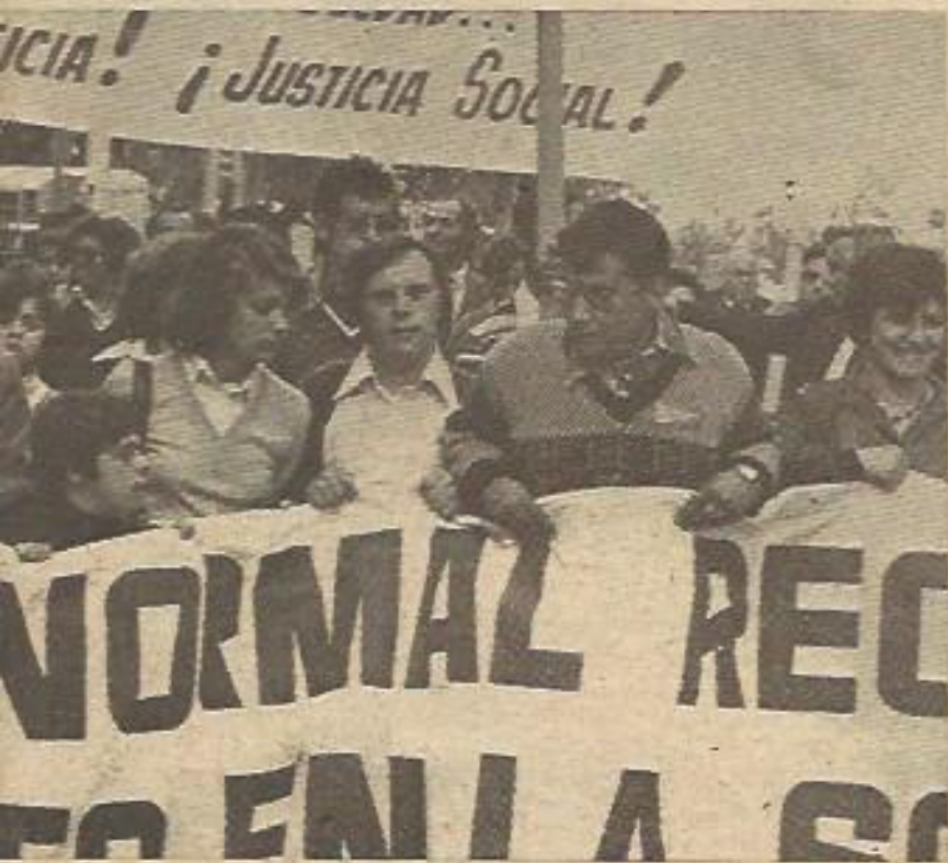
males en Valencia. La voz de los subnormales pocas veces se ha hecho patente en la calle.