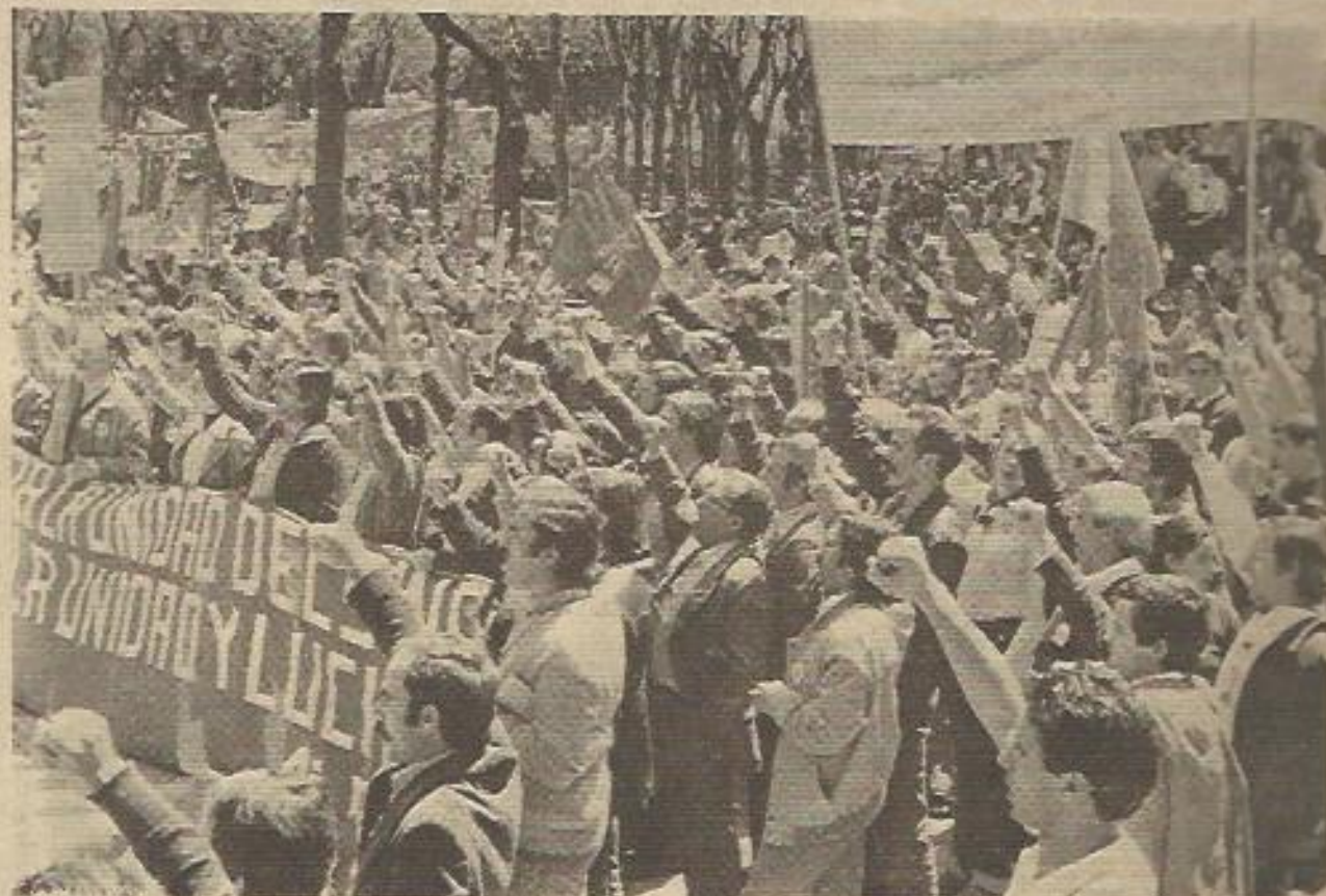
Al final de la manifestación formada por CSUT, SLMM, UCSTE y SU se canta la Internacional, mientras al fondo del Paseo del Prado sigue llegando la manifestación

En Valencia no se pudo llegar a ningún acuerdo unitario por lo que hubo una manifestación de CC.OO. y UGT y otra convocada por CSUT, SU, USO, CNT, SLMM, y MUP a la que asistieron unas 13.000 personas. En Castellón participaron unas 2.000 personas.