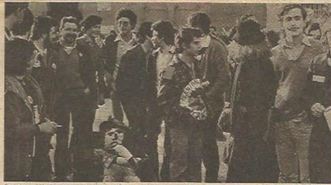
Se ha querido desprestigiar la creciente lucha antinuclear, pacífica y responsable, con la actuación de las FOP y los grupos fascistas.

Todas las fuerzas convocantes han protestado por estos hechos y en particular por el criterio discriminatorio de sancionar a dos de ellas que en ningún momento llevaron a cabo ni fueron responsables de las acciones violentas. Por su parte, el PTE ha manifestado su firme decisión de no responder económicamente a la multa y realizar las acciones judiciales pertinentes para poner en claro las responsabilidades a que haya lugar, tanto en la actuación de piquetes ajenos a la manifestación como en la intervención brutal e irresponsable de las FOP.