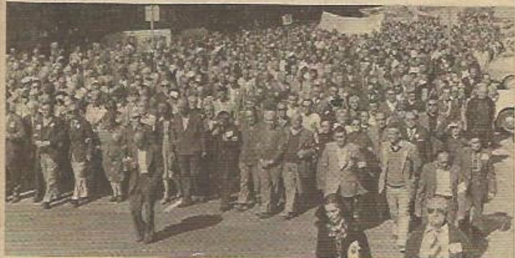
"...Y uniendo las luchas de todos, avanzamos a una sociedad más justa con todos para la que no haya individuos con "edades", sino sólo hombres con necesidades..."

Por otra parte, porque esta "imposibilidad de integrarse en la producción en iguales condiciones y con la misma energía de desarrollo de trabajo que cuando se es joven" es sólo válida para los trabajadores, para las clases populares; para que así se vaya generando la fuerza de trabajo de acuerdo con ese interés antes dicho de la ley del máximo beneficio. Para las clases burguesas esto no es así: el viejo profesor es más docto con los años, el presidente del consejo de administración de la empresa es un gran hombre de negocios a través de los años y los magnates de las finanzas son más magnates cada vez y menos viejos siempre. Estos tipos sociales no sufren ningún tipo de marginación, dirigen en todos los lados, porque en definitiva son ellos los que marginan a los otros ancianos (los trabajadores) desde sus ilustres sillones o sus majestuosos desechos, porque ellos son, la clase dominante, ellos son el