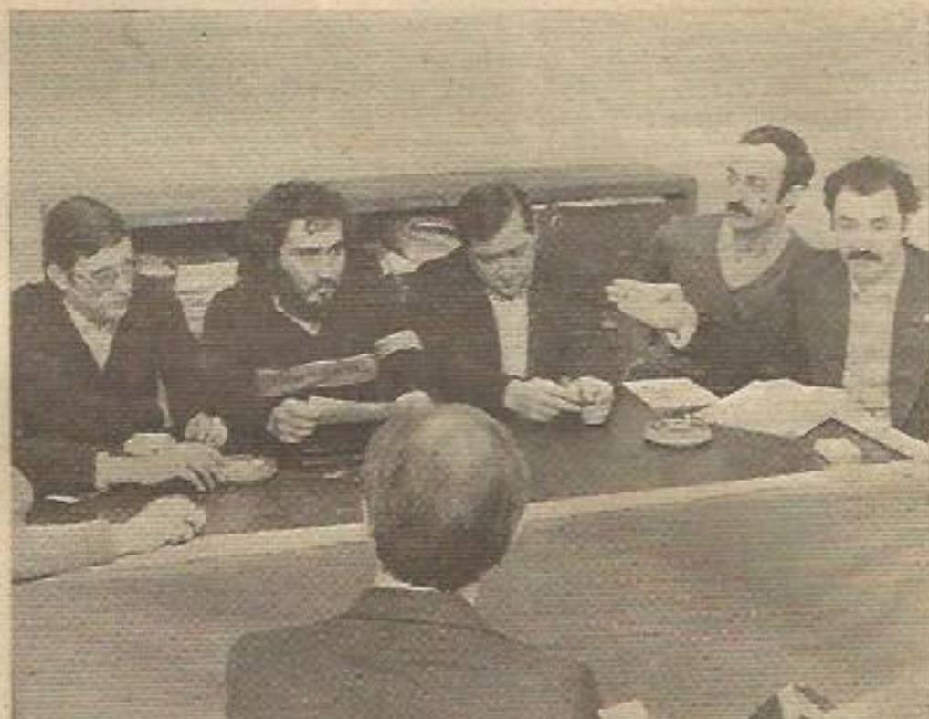
De izquierda a derecha, representantes del SLMM, ING, CSUT y SU que presentaron los acuerdos adoptados

ACUERDO DEL SU, SLMM, ING, LAB, SOC, UCSTE y CSUT