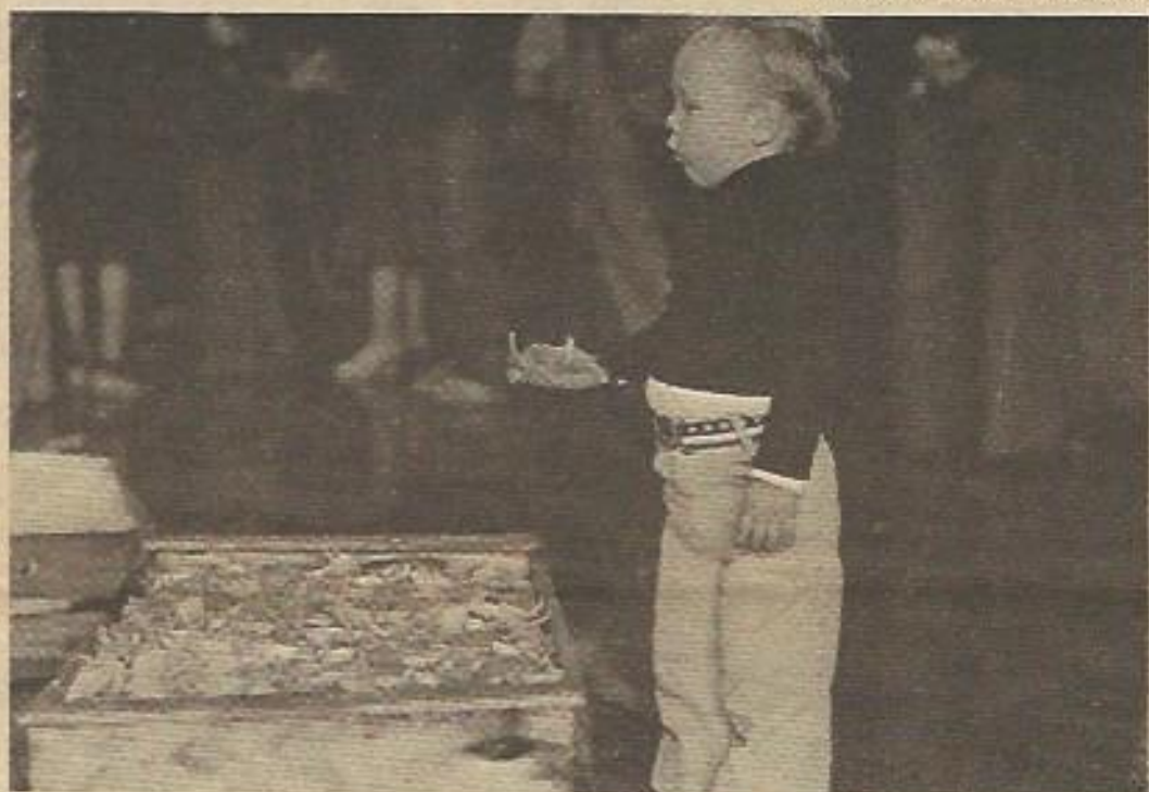
«Los cangrejos también costarán más...?»

Las próximas semanas prometen ser interesantes en materia económica, a la espera de que se empiecen a desvelar las claves del futuro que quieren el gran capital y el gobierno y que de momento tan celosamente guarda. Habrá que estar atentos a las andanzas que Abril Martorell se trae con la CEOE.