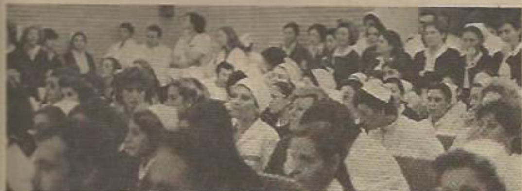
...los trabajadores han desconfiado de esta convocatoria de huelga, que en esta ocasión han apoyado estos sindicatos pero de forma oportunista y sin ningún espíritu de lucha..."