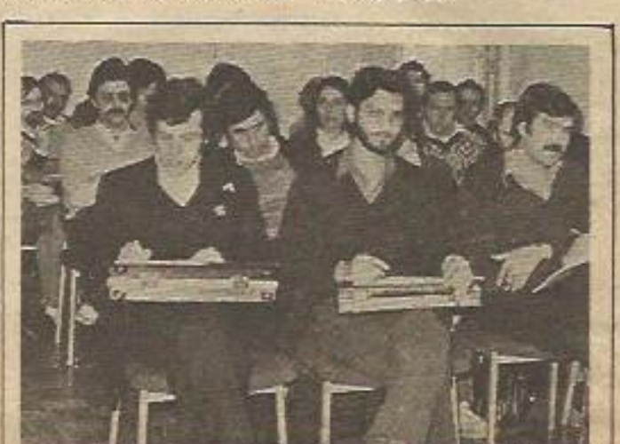
Reunión de concejales y responsables de la política municipal del PTE

—Italia: Manifestación nacional contra las nucleares y por una opción energética alternativa (mayo). Manifestación organizada por el Comité Antinuclear de Viadana (junio).