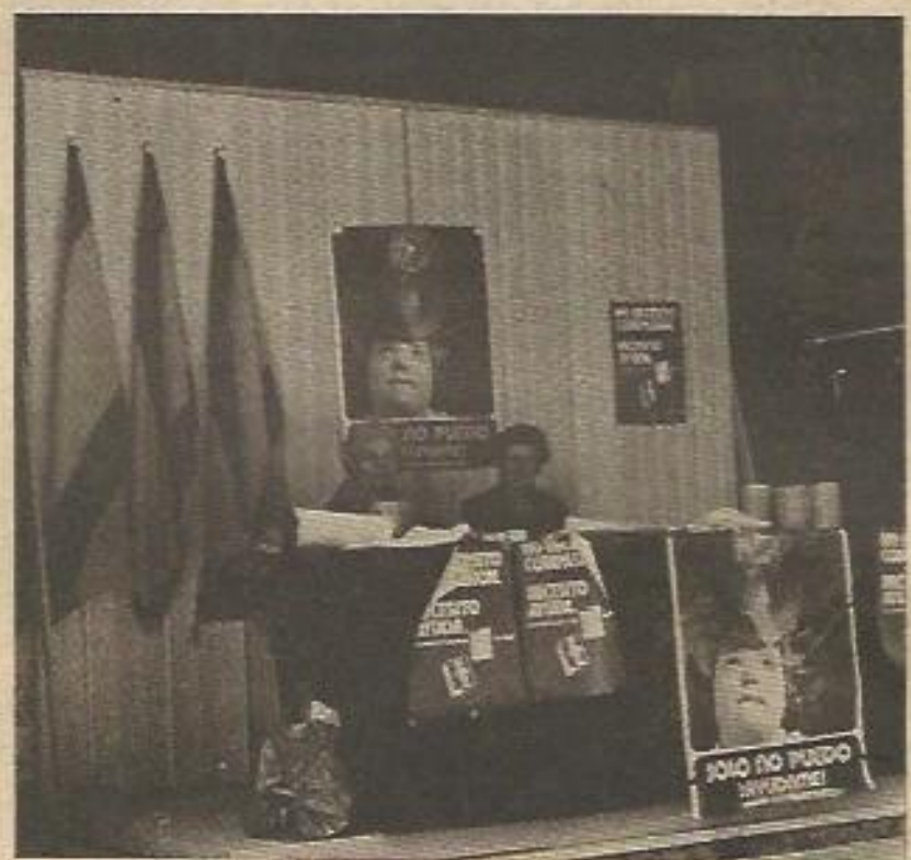
Aspecto de una mesa de cuestación instalada el pasado día 26 en el Día del Subnormal

En este contexto es en el que hay que entender el problema de la Semana de Información sobre la Subnormalidad, celebrada desde el 23 al 30 de abril.