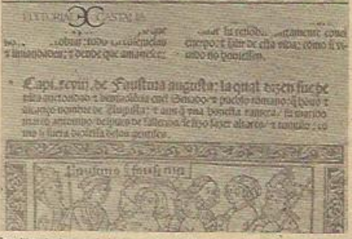
Este libro ha levantado las iras de los nuevos pontífices de la crítica literaria.

de América y su deuda permanente con los banqueros europeos ("nuestras Indias están en España", dirá un ministro francés), el abismo, en suma, entre el ser y el parecer así como la obsesión por el engaño y desengaño, son la clave de una lectura significativa del Barroco".