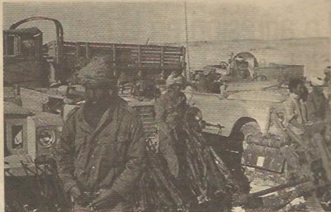
Recientemente, el Frente Polisario ha conseguido importantes éxitos contra las fuerzas invasoras marroquíes. En la foto, soldados del Ejército de Liberación con material arrebatao a Marruecos.

ENTREVISTA DE SUAREZ CON EL FRENTE POLISARIO