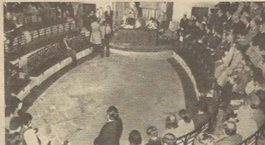
Momento de la constitución de las Juntas Generales de Vizcaya.

Ahora nos enteramos de que el 3 de abril votaron "los territorios" y no los ciudadanos.