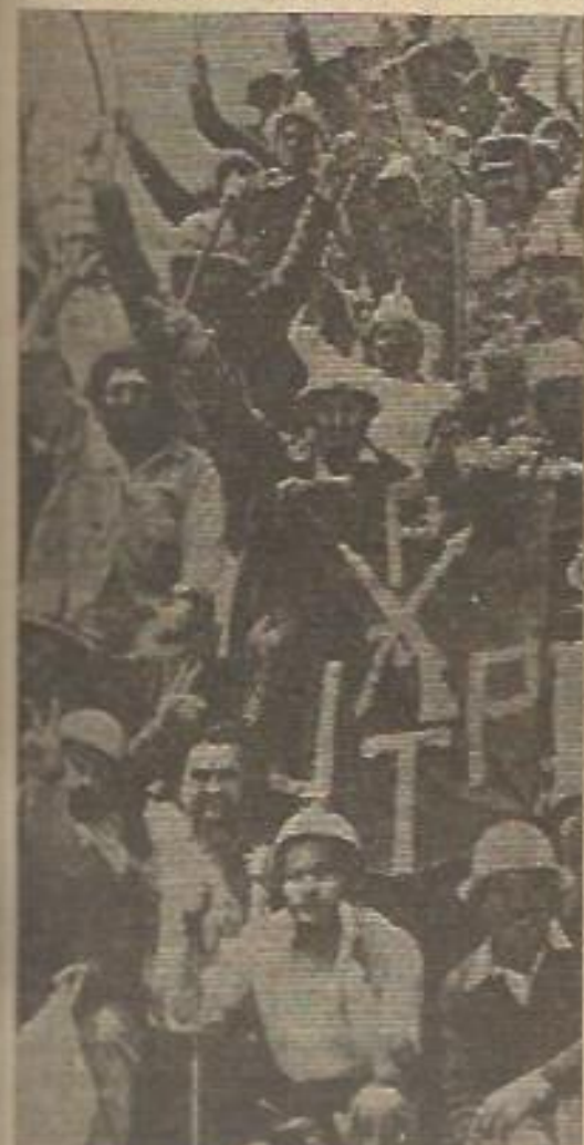
Foto de una lucha de trabajadores mineros, de un informe del Bloque Sindical del Movimiento Peronista Montonero

Pero preguntabas cómo se vive hoy en Argentina ¿no? Bien, pues el sueldo mínimo mensual teóricamente, es de 100.000 pesos nuevos (diez millones de pesos de la vieja nominación). Cine, paquetes de cigarrillos, por ejemplo, cubren esa cifra; o 20 kilogramos de carne (producto que hasta 1976 fue de consumo diario en el país), o 350 viajes en microbús o subterráneo (y nótese que en el caso de un matrimonio en el que ambos trabajan, deben realizar por lo menos 240 viajes mensuales para cumplir con sus obligaciones). Con el sueldo mínimo mensual, en definitiva, no se puede vivir. A esto debe sumarse la constante inflación, que durante 1978 alcanzó a un 160 por cien, o sea, un 13,3 por cien mensual. Al comenzar este año, en un arranque de generosidad, la dictadura concedió un aumento mensual del 4 por cien, desde enero hasta abril inclusive. Pero sólo en enero, tomando cifras oficiales, la inflación fue del 12,9 por cien. Total, desde 1976 hasta ahora, el deterioro del poder adquisitivo del trabajador ha sido de un 60 por cien. Con todo, la dictadura sigue afirmando que desde su asunción al poder se ha impuesto un orden y se ha saneado la situación económica. No aclaran, claro está, que los beneficios redundantes de lo que se vive son únicamente para su propio provecho, para el de sus representantes: los monopolios oligárquicos y las multinacionales.