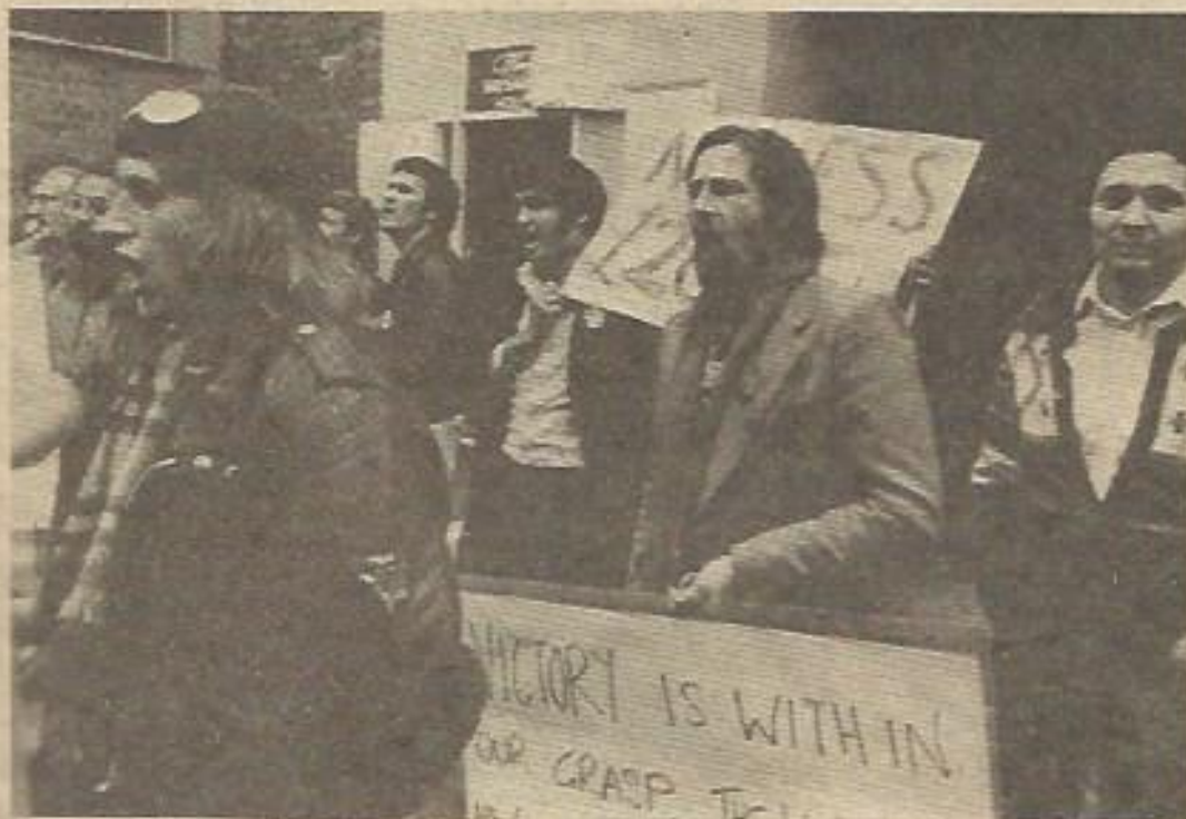
Un grupo de obreros de la Ford se manifiestan ante el edificio donde la patronal y los sindicatos están reunidos para buscar una salida

Tan fracasada se encuentra la política de pacto social en Gran Bretaña que incluso dentro del Partido Conservador una gran parte de sus miembros, encabezada por su líder Margaret Thatcher, se manifestaron en contra en su reciente Congreso, porque "una política que es contestada por la mayoría del propio partido en el poder —los laboristas— y por los sindicatos, no puede traernos más que complicaciones". ★