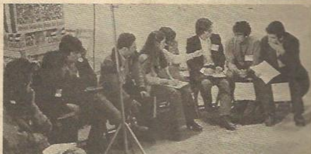
Dos expresiones bien características de este Congreso. En la primera, se discute, se debate; en la segunda, la alegría por todo lo conseguido y lo por conseguir desborda la sala.

dencia de la patria, para conseguir la paz mundial. Para tener alerta a la juventud, es necesaria una única organización política de la juventud. Y para alcanzar el socialismo".