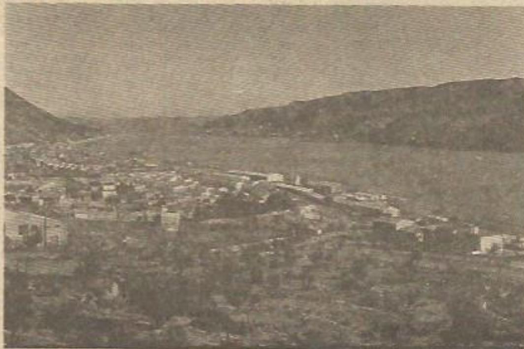
El embalse obligó a los mequinenzanos a abandonar su vieja población, y con ella sus escuelas.

Esta firme postura tomada por el PTA y los vecinos de Mequinenza —quienes ya demostraron su decisión en la huelga de escolares a primeros de curso— va a ser llevada a las Cortes por Lorenzo Martín Retortillo, senador de la Candidatura Aragonesa de Unidad Democrática quien formulará al Gobierno una serie de preguntas en relación al tema de las escuelas de Mequinenza. ★