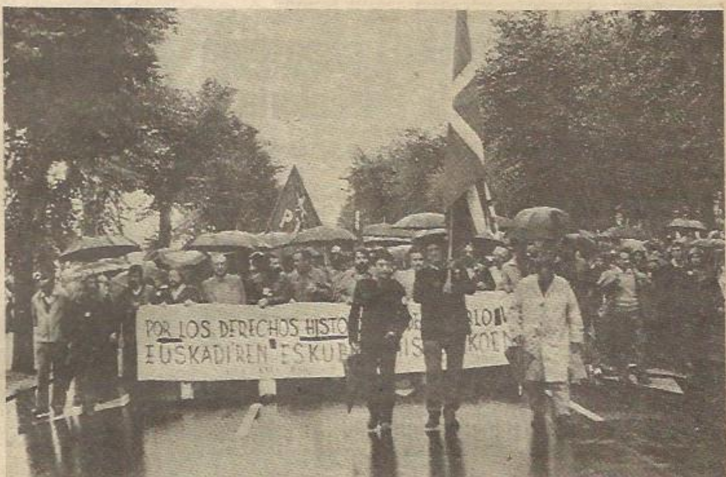
El decreto-ley antiterrorista pone al detenido en una situación de indefensión sujeta a arbitrariedades. El problema del terrorismo no se va a solucionar en Euskadi con medidas de ese tipo, sino con soluciones políticas.

Los participantes, tanto en la mesa como entre los espectadores, mostraron un gran interés por este compromiso autonómico, que algunas fuerzas ya están apoyando sin que se sepa por el momento la postura del Consejo General.