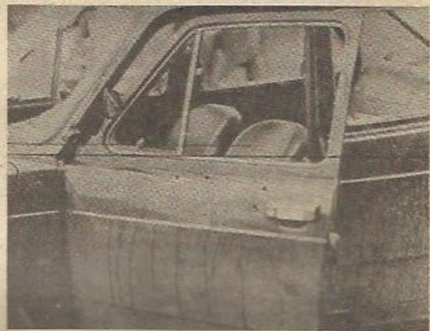
La actividad armada de ETA tiene hoy un sentido y una consecuencia radicalmente diferentes a las que tenía durante el fascismo.

Estas son las razones estratégicas y tácticas que ha asumido el Comité Ejecutivo Federal de nuestro Partido y que constituye un claro norte en la realización de nuestras tareas prácticas y en la educación del pueblo. ★