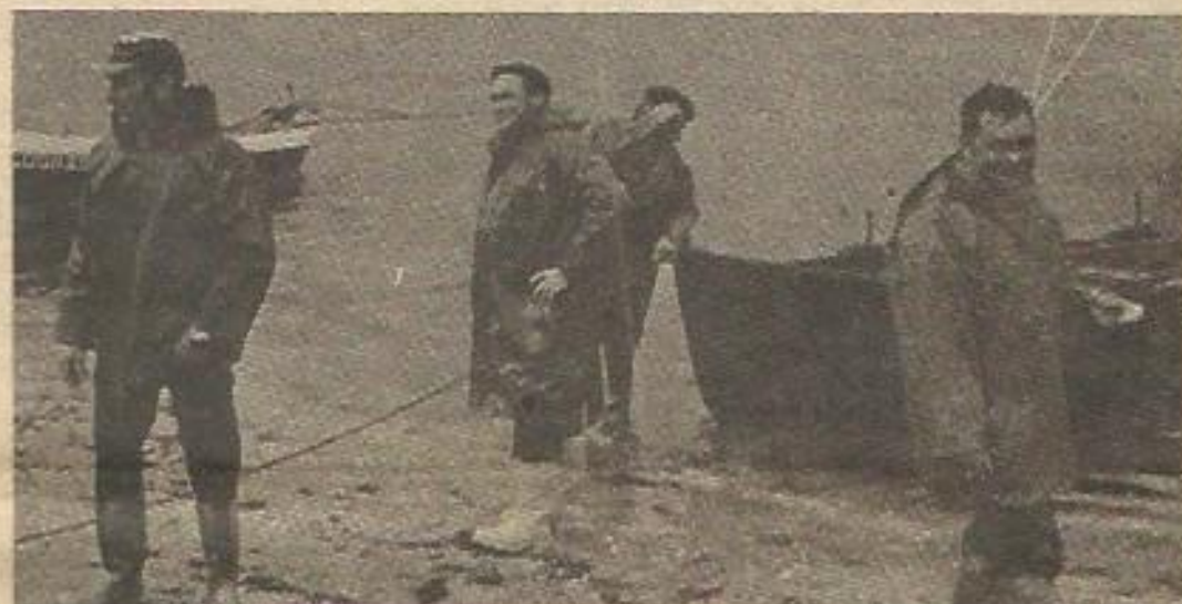
El paro del sector pesquero va a aumentar, pudiendo llegar a 15.000 personas en la ciudad de La Coruña y 30.000 en toda la provincia

La Xunta de Galicia debe unirse a la búsqueda de soluciones junto a los sectores implicados: armadores, marineros, etc. Habría que estudiar en primer lugar el proyecto de reforma pesquera que prepara la Subsecretaría de Pesca y ver al tiempo algunas de las soluciones apuntadas por los armadores como la de concentración empresarial que evite el minifundismo actual del sector pesquero gallego. ★