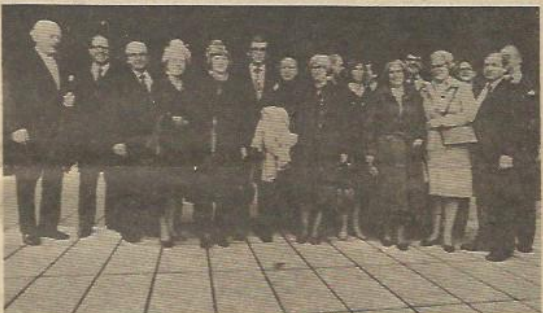
¿Qué deparará en los próximos meses este nuevo gabinete sueco? De momento, uno de esos señores ya ha sido sorprendido por la prensa violando su propia legalidad