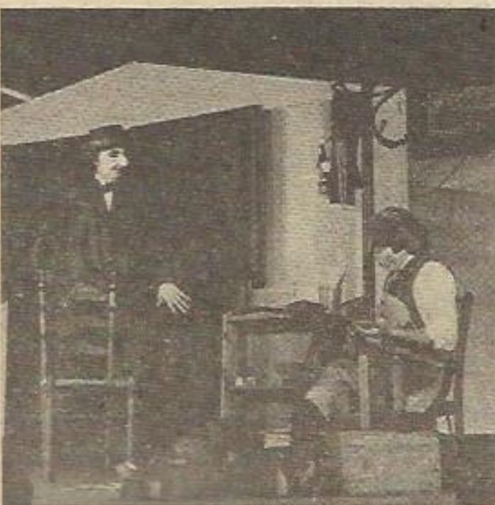
El Grupo de Acción Teatral de Hospitalet, en el escenario.

Por último, el documento, titulado "Per un Teatre Estable a l'Hospitalet", decía: "Avanzar hacia un teatro estable en una ciudad como la nuestra es algo que exige nuevos espectadores, unas formas nuevas de relación con el público, un profundo trabajo de dinamización social, de agitación cultural; exige tomar la palabra a la salida de los centros de trabajo, en reuniones y asambleas, hallar las formas de relación con los comités de empresa, con las centrales sindicales, con las asociaciones de vecinos; exige prestar una atención especial al público infantil, a esos 15.000 niños de l'Hospitalet que hoy están en la segunda etapa de la EGB y que son el germen del público de mañana".