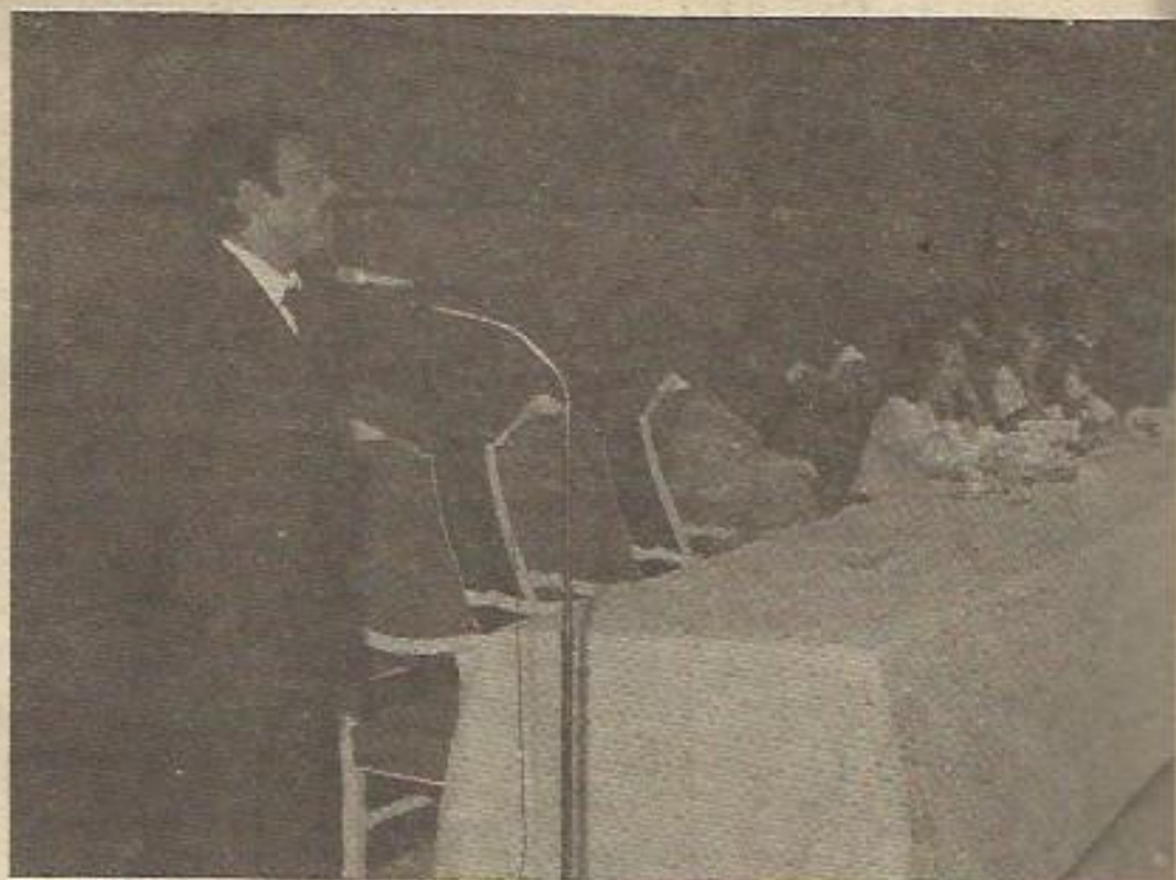
Eladio García Castro habla ante las delegaciones extranjeras y los representantes de la prensa. El primero a su izquierda, Thami Sindelo, dirigente del Congreso Nacional Africano.

— "En el Ejército no habrá dos tendencias, habrá veinte. Hay en él personas que son A, B, C o D., pero no son "el Ejército". Unos han aceptado el proceso por disciplina, sin estar de acuerdo con él, y otros lo han aceptado con entusiasmo. Para saber lo que piensa el Ejército habría que hacer un muestreo, no hablar con 5 ó 6". Antes, sobre las opiniones existentes dentro del Ejército, dijo que para conocerlas "habría que hacer una encuesta, cosa que no es norma en el Ejército". Y añadió: "En todo caso, a las Fuerzas Armadas no las representa más que su Majestad el Rey".