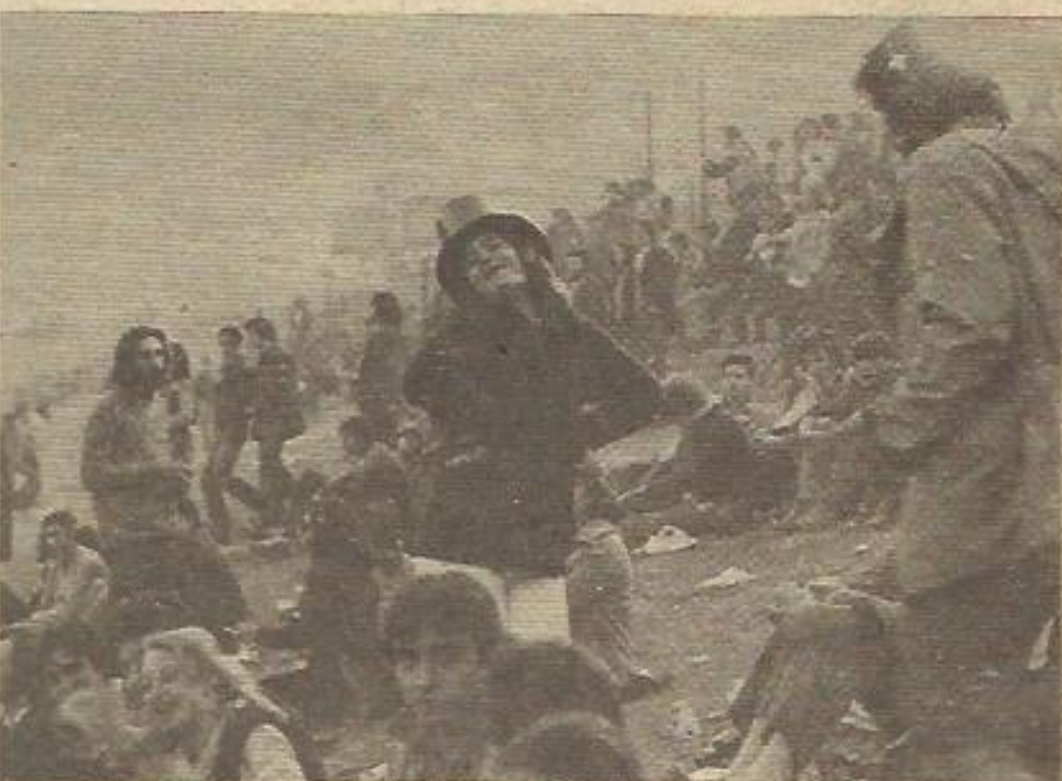
Los jóvenes se divirtieron de lo lindo

"LAS ORGANIZACIONES POLITICAS JUVENILES TENEMOS TODOS UN PROGRAMA COMUN, UNOS MISMOS OBJETIVOS, UNAS MISMAS METAS" Manifiesto del Congreso de la JGRE