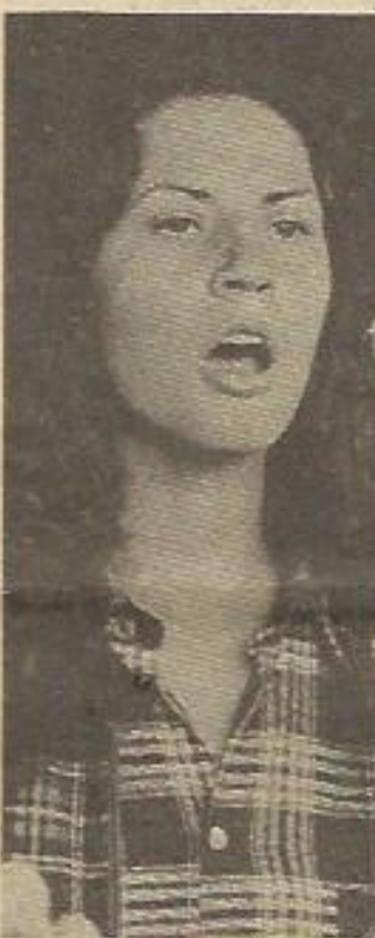
Una de las muchas cantantes espontáneas que intervinieron en la fiesta