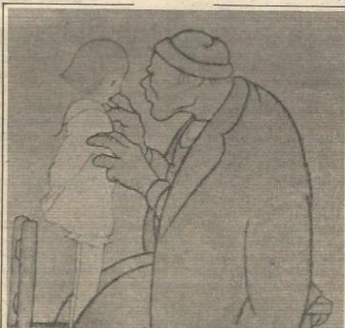
—¿Por qué no habla castellano, señor Pedro? —Ay, neniña en galego nunca s'escribiron os recibos das contribucións

Si esta idea se lleva a la práctica, no hay duda de que el espectro político de Galicia cambiaría de forma sustancial. Para partidos como la UCD y el PSOE, se convertiría en un competidor a nivel electoral, puesto que este partido cuenta con gente de prestigio que le restarían votos. Una cosa parecida ocurriría con los partidos que representan al nacionalismo radical (UPG, ANPG), que ya no serían los únicos en levantar la bandera de Bóveda y Castelao, ni representarían la "única solución pura" nacionalista para las clases medias. El nuevo partido podría recoger frutos que está sembrando este nacionalismo radical. Supondría un esfuerzo más en la lucha por una autonomía progresista y de atracción a posiciones nacionalistas más activas de sectores hoy atrasados políticamente. ★