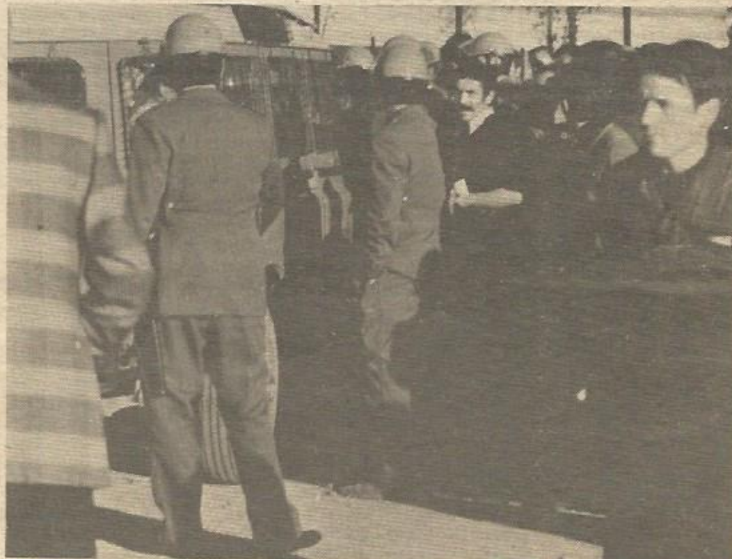
La presencia de la policía ha sido constante ante las manifestaciones de los trabajadores de CYFISA, pero nadie ha pedido explicaciones a la dirección de las ventas a precios bajo costo a Garza

burgalesas, para seguir el ejemplo), sino que durante varios meses han estado sacando la producción y vendiéndola por canales propios, a pesar del empresario. Han sido varios meses de autogestión que en definitiva han venido a demostrar la falacia de algunos expedientes de crisis, a la vez que la ambición, la ineficacia y la mala voluntad de los empresarios que los plantean.