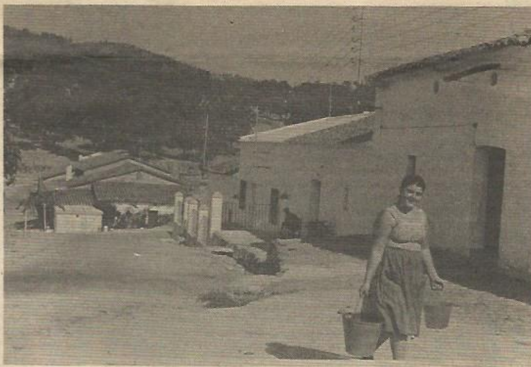
Todos los problemas son de primera necesidad