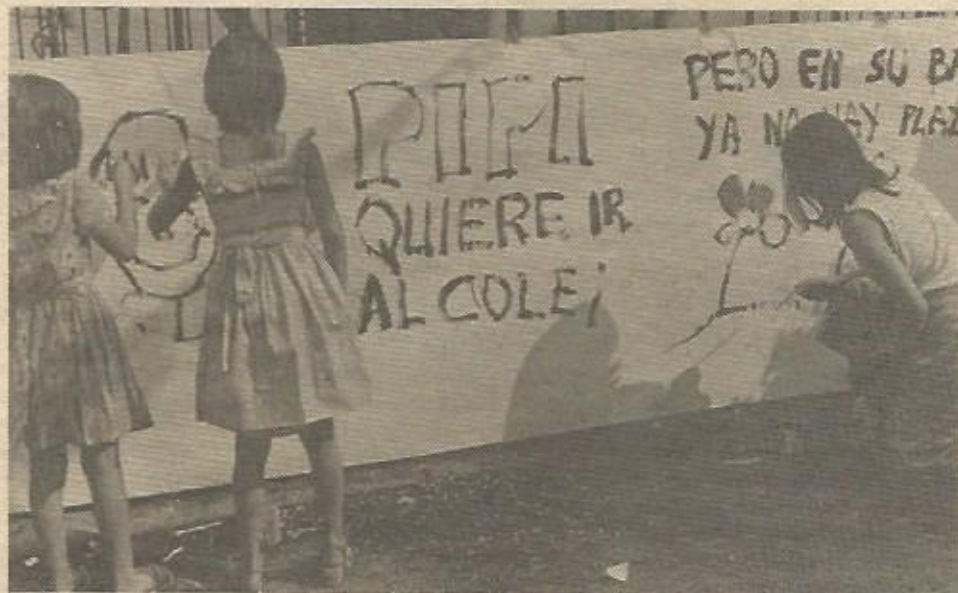
Niños, maestros y padres exigen constantemente unas mejores condiciones de enseñanza