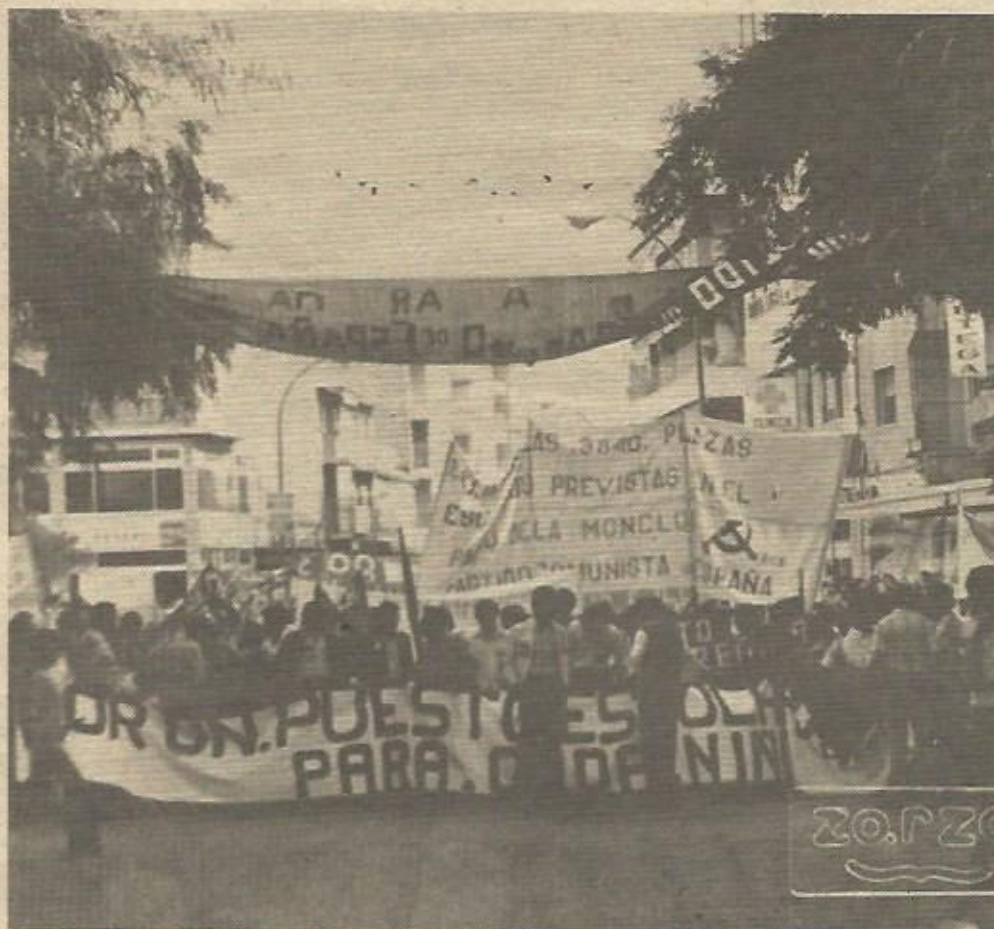
Las manifestaciones exigiendo el cumplimiento del Pacto de la Moncloa en sus aspectos educativos se han producido en toda España

NOTA: Esta información ha sido elaborada por un colaborador independiente al que se le conoce popularmente en Santa Coloma por Perico. Todos los datos han sido obtenidos del trabajo realizado por Casal de Cultura de Sta. Coloma de Gramanet.