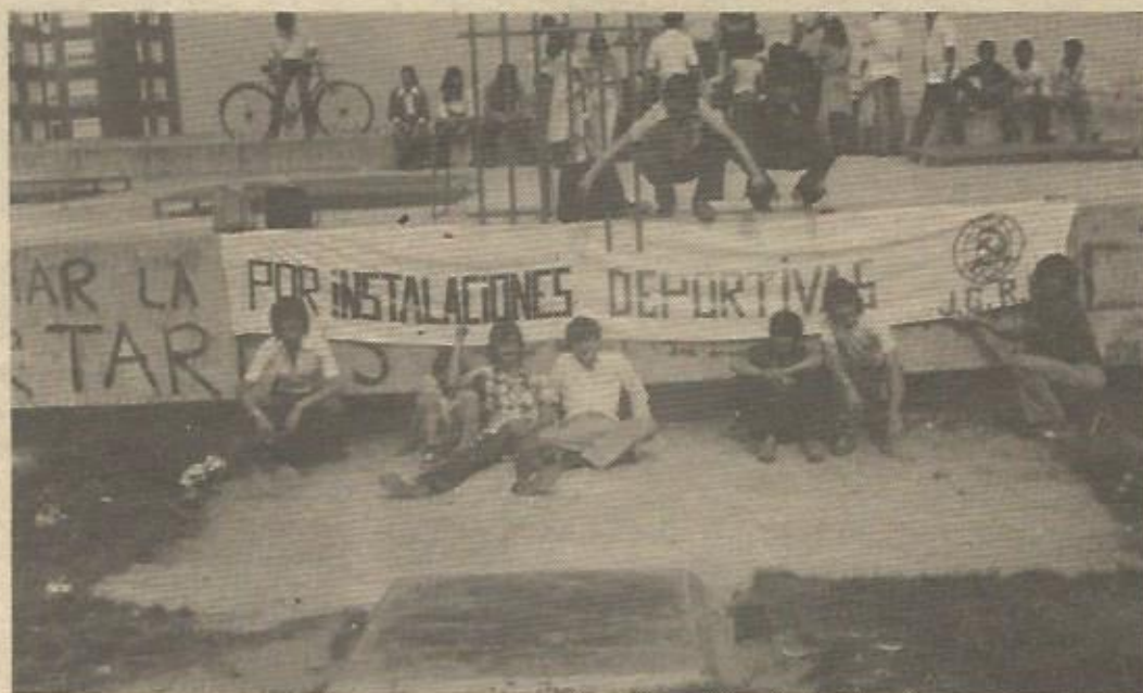
Las actividades de preparación del Congreso de la JGRE han sido numerosas. Y en ellas se han reivindicado soluciones a los problemas de la juventud

Por eso el Congreso de la JGRE es un Congreso de la juventud, es un Congreso de Unidad y Participación. Desde un principio, todos los jóvenes sea cual sea su ideología,