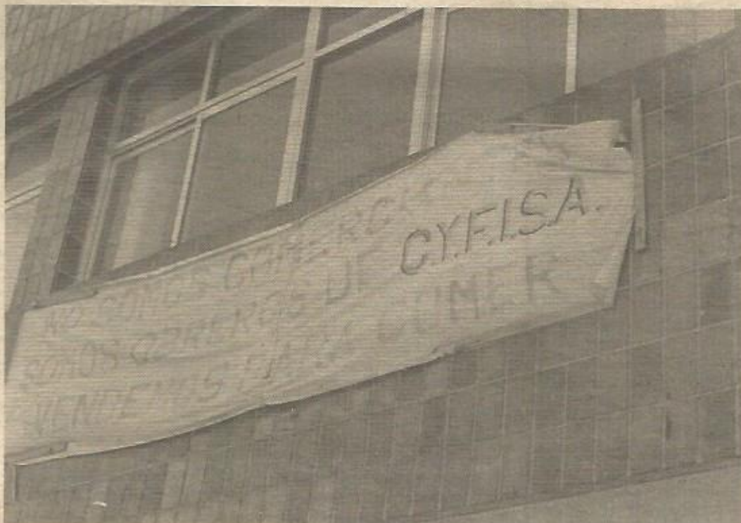
Una pancarta que lo dice todo

Sea como sea, los trabajadores han dado un aviso y un ejemplo. Un aviso, un aviso práctico, de lo fraudulentos que son muchos de los expedientes de crisis, trucos de empresarios que no saben ni quieren pasar las épocas de vacas flacas, y un ejemplo de cómo resolver, con el mejor espíritu de unidad y sin daños para nadie, situaciones difíciles.