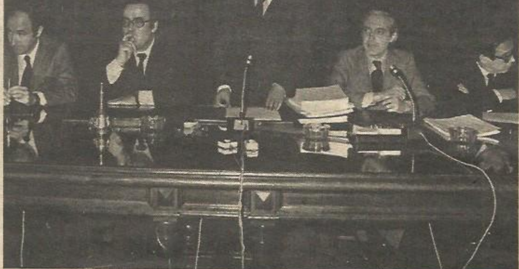
Acto de la firma del primer anteproyecto de Constitución: En los trabajos de la ponencia del Congreso de los Diputados, ya apareció la cara y cruz del proceso constituyente: un paso decisivo para la democracia, oscurecido por los pactos de silencio y la política de consenso