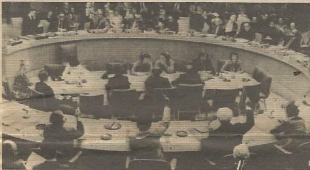
El Consejo de Seguridad de las Naciones Unidas aprobó, por trigésima primera vez, el alto el fuego en el Líbano, pero los problemas de esta nación árabe siguen intactos.

Para que la paz pueda llegar a este país parece como condición necesaria una solución válida y justa de los palestinos allí refugiados, del futuro del pueblo palestino, problema central de Oriente Medio, y sería igualmente necesario que todos los ciudadanos libaneses, sin discriminación étnica ni religiosa, puedan reconstruir libremente sin presiones exteriores su país e instaurar un Estado democrático y plenamente soberano. ★