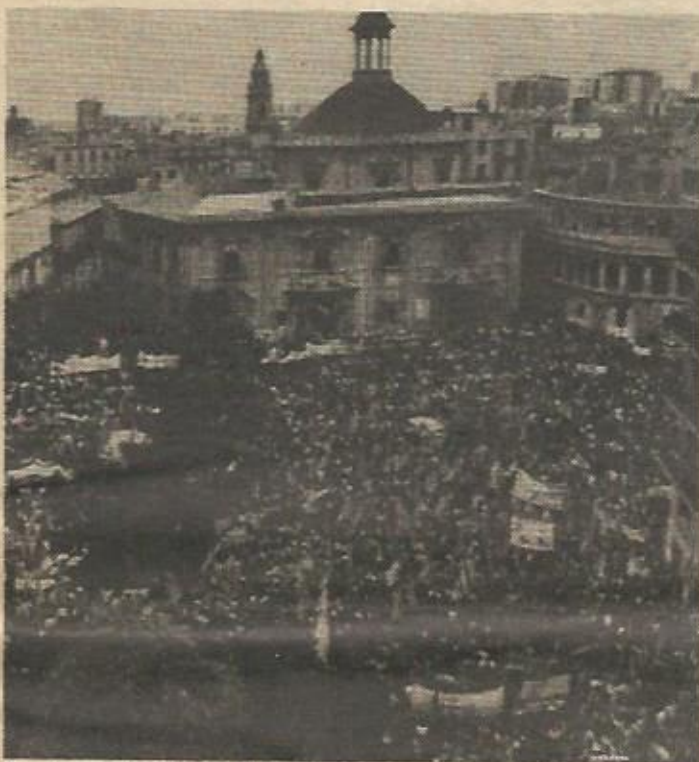
Sin llegar a la concentración humana del pasado año, la Diada del País Valencià de este año se puede considerar como un éxito

Como anécdota significativa tenemos que contar lo que le pasó a este corresponsal. Cubriendo el servicio informativo el día 8 por la mañana, saqué una fotografía de unos ultras que estaban empujando a dos niños que repartían pegatinas. Al verse cogidos "in fraganti", me persiguieron al grito de "¡a por ése!". A todo correr, pude refugiarme en un hotel próximo a la plaza de toros, reclamando la presencia de la policía, ya que las intenciones de mis perseguidores, cuya entrada había sido evitada por el portero, no eran muy pacíficas. La policía no acudió, pero sí lo hizo un numeroso grupo de personas, al ser reclamadas por los altavoces de la plaza para sacarme del apuro. Ante esto la "manifestación" de ultras se disolvió y pude salir no sin escuchar antes a alguno de ellos: "Déjalo, ya sabemos donde tienen la sede los del PTPV. Iremos a por ellos" . ★