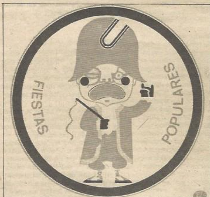
Pegatina de la Comisión Pro-Festejos Populares, 1978

Las fiestas del Pilar, organizadas desde el Ayuntamiento, han tenido de siempre un carácter oficialista, estando destinadas a la burguesía local, para la que se organizaban —con presupuesto municipal— cenas de gala, conciertos, torneos de deportes minoritarios... El pueblo de Zaragoza, mientras tanto, se aburría soberanamente sin diver-