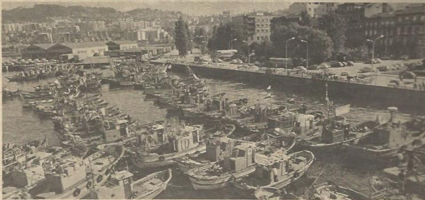
A pesar del optimismo oficial inicial, el nuevo convenio de pesca con la CEE no ha satisfecho a los armadores