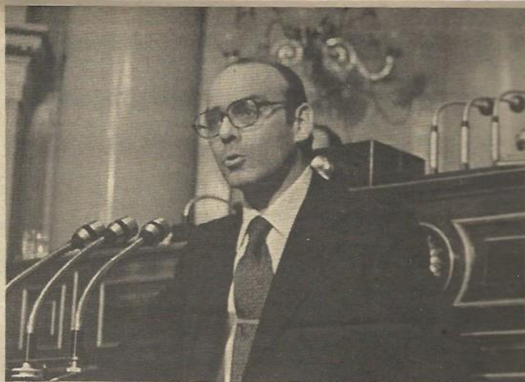
El Vicepresidente tuvo mucho ajeteo en su incursión al Senado: desde puñetazos en las mesas a carpetazos al Estatuto Vasco. Todo para cargarse la enmienda aprobada en la Comisión

Después de estos asuntos, que nos vuelva a salir el señor Oreja proclamándose ante la ONU como un paladín de la defensa de los derechos humanos. Más seriedad. Si la Administración española, dentro del nuevo rumbo que quiere introducir su política internacional, pretende presentarse como un valedor de los derechos humanos de los pueblos, lo primero que tiene que hacer es dejar de ayudar, y además militarmente, a regímenes como los de Pinochet, Somoza o el Sha, campeones de la violación de esos derechos. La exigencia de que haya un estricto control parlamentario sobre nuestro comercio exterior de armamento, planteada por diversos partidos, se hace cada vez más razonable. ★