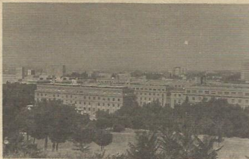
Vista general de la Universidad Complutense de Madrid. Ni ésta, ni ninguna universidad española tienen aún una ley de autonomía coherente (J. Martínez)

Parece que en los principios estamos todos de acuerdo —¿será que no todos confiesan sus principios?— y nadie reconoce oponerse a la autonomía universitaria. Sin embargo, aquellos curados de espanto que prosiguen la lectura, al llegar al cuarto capítulo titulado "De los órganos de las universidades" se encuentran con la sorpresa de que ya no es el claustro general el máximo órgano de gestión universitaria, la asamblea representativa y soberana de la Universidad, no. Su soberanía está compartida con otros dos organismos: el Consejo Académico y el Consejo Económico. ¿Qué tiene que ver