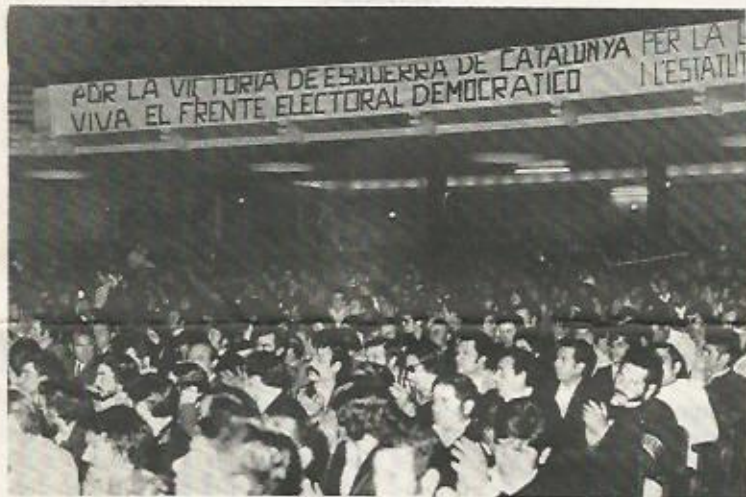
Aspecto parcial del Congreso de la Confederación Nacional de Catalunya de Sindicatos Unitarios de Trabajadores, en que se refleja su apoyo a Esquerra de Catalunya.

La única central sindical que desde el primer momento tomó una postura clara y unitaria ante las elecciones ha sido la CSUT. Esta ha llamado reiteradamente a todas las centrales sindicales a unirse en un Frente Electoral, ha planteado desde un primer momento la necesidad de que los