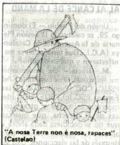
"A nosa Terra non é nosa, rapaces" (Castelao)

Es evidente que Galicia necesita con urgencia sentar las bases económicas, políticas y sociales, que le permitan salir de la situación específica de subdesarrollo y opresión en que se encuentra. Pero es evidente también que esto sólo será posible mediante una planificación hecha en Galicia y para Galicia, que ofrezca soluciones a todos los graves problemas que el pueblo gallego tiene planteados. Por esto, el Frente Democrático de Izquierdas propone, sobre la base del Estatuto mayoritariamente plebiscitario por el pueblo gallego en el