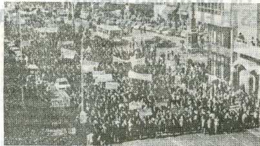
Manifestación campesina en La Coruña