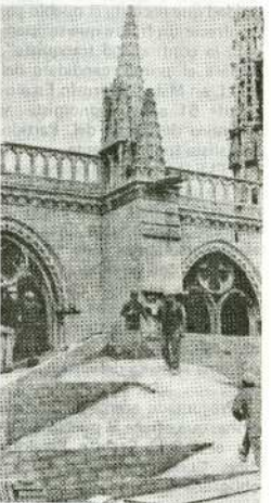
La catedral de Burgos, uno de los más valiosos monumentos góticos del mundo, corre peligro de hundimiento. "Los hombres de A.P. y U.C.D. son el elemento determinante de la destrucción de una gran parte de nuestro rico Patrimonio Nacional".

El F.D.I. es firme defensor de la cultura y el arte. Hay que arrancar nuestros monumentos artísticos de manos de la corrupción y el caciquismo y ponerlo bajo control democrático del pueblo. Propondremos una ley de defensa del Patrimonio Artístico, progresista y clara, pero ante todo haremos que se cumplan limpiando la Administración de tanto corrompido que no piensa más que en enriquecerse, aunque sea a costa de burlar los sentimientos más profundos del pueblo. ★