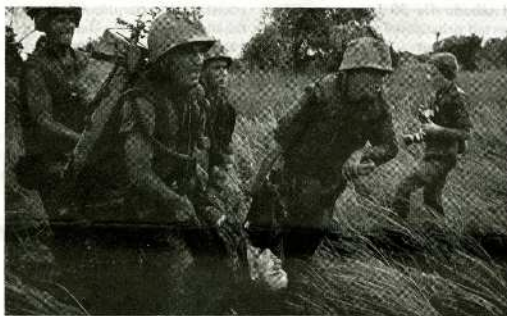
El "respeto" del imperialismo a los derechos humanos: la Guerra de Vietnam.

En verdad, el pueblo soviético y los demás pueblos del Este europeo en su misma situación, tienen ante sí un poderoso enemigo que vencer; pero no cabe duda de que si en este combate ponen la firmeza y valentía de que han hecho gala a lo largo de su historia, acabarán conquistando su libertad y volverán a construir el Socialismo. ★