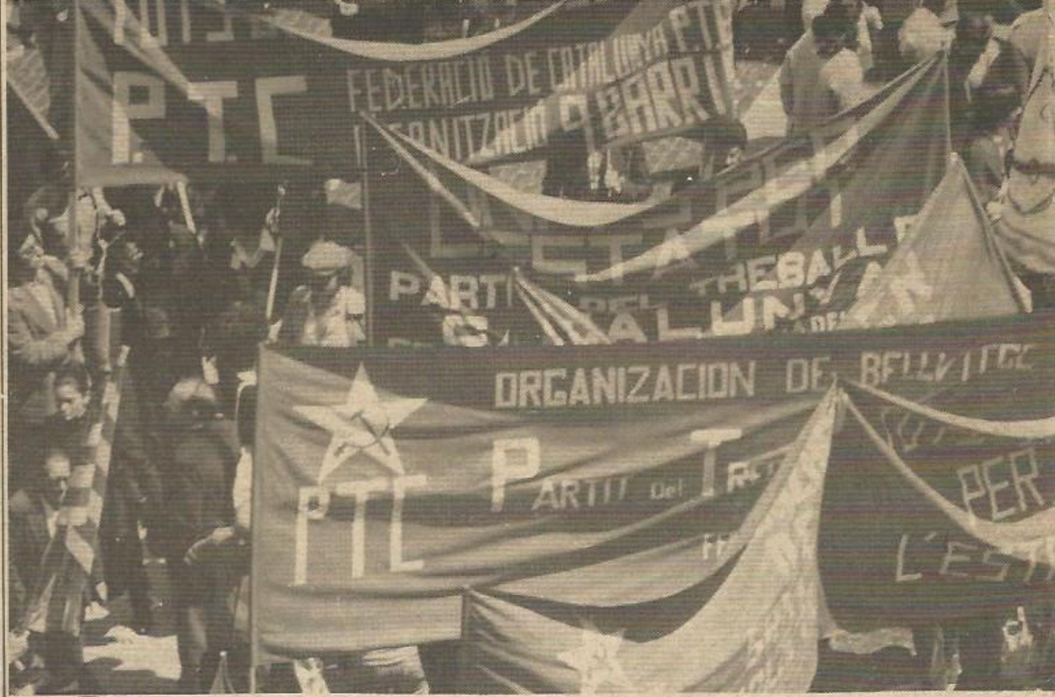
El PTC defendiendo l'Estatut en la Plaza de Sant Jaume

A la vez apoyado la lucha por conseguir espacios libres como en el Clot, y contra las inundaciones de la calle Cartellá.