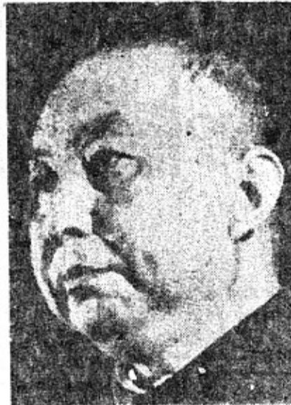
PRESIDENTE JUA KUO-FENG

Ciertamente la democracia proletaria, donde las masas son las dueñas y protagonistas de todo, es mil veces más democrática que cualquier "democracia" burguesa donde los trabajadores encuentran mil tra-