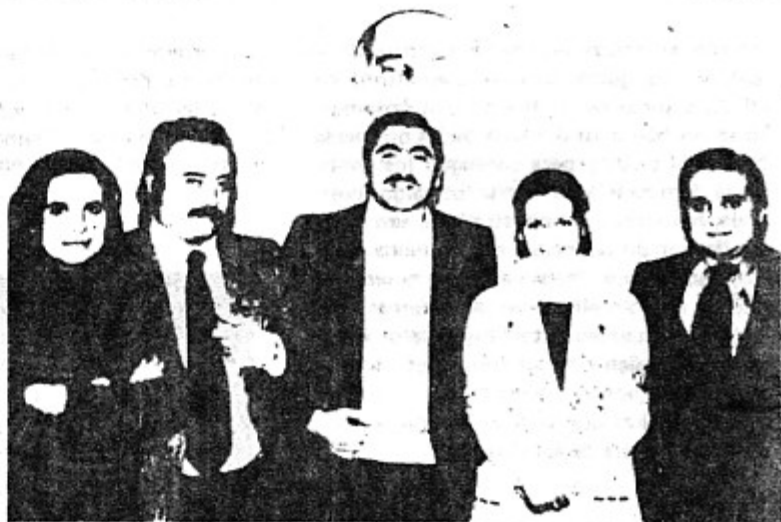
LA DELEGACION DE NUESTRO PARTIDO CON EL SECRETARIO GENERAL DEL F.D.L.P. NAYEF HAWATMEH

Nota de la Redacción. — Con la visita de esta delegación de nuestro Partido a los frentes de combate de la revolución palestina, se han estrechado los lazos de amistad entre nuestro Partido y el Frente Democrático para la Liberación de Palestina. Nuestros camaradas han podido comprobar sobre el terreno el heroísmo de un pueblo decidido a recuperar su patria por encima de todos los sacrificios y adversidades, y la justa política del F.D.L.P. por llevarlo a la victoria. En próximos números, recogeremos las impresiones de nuestros camaradas.