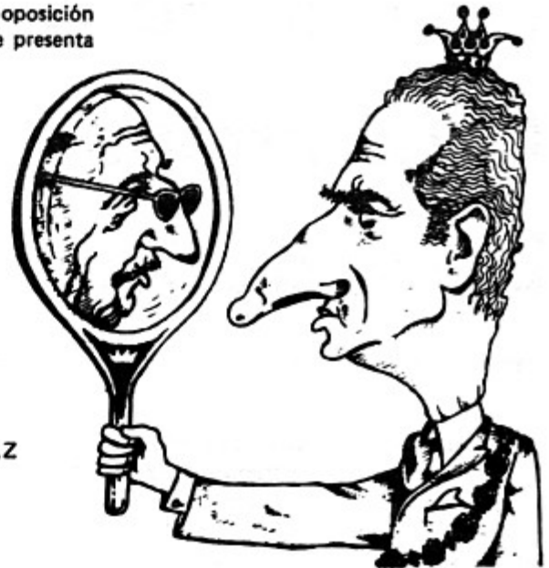
UN ESPEJO VERAZ

F RENTE a los avances de la oposición democrática unida, que se presenta