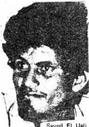
Sayed El Uali

"En nombre del Comité Central del Partido del Trabajo de España saludo calurosamente a este III Congreso del Frente Polisario y a todas las delegaciones aquí presentes, y os expreso una vez más nuestro total apoyo a vuestra justa lucha por devolver al pueblo saharaui la libertad y la soberanía. El pueblo saharaui es un pueblo valiente y decidido a conquistar su libertad, que ha combatido contra el colonialismo español y que ha empuñado las armas frente al invasor sin escatimar sacrificios como lo está demostrando cada día.