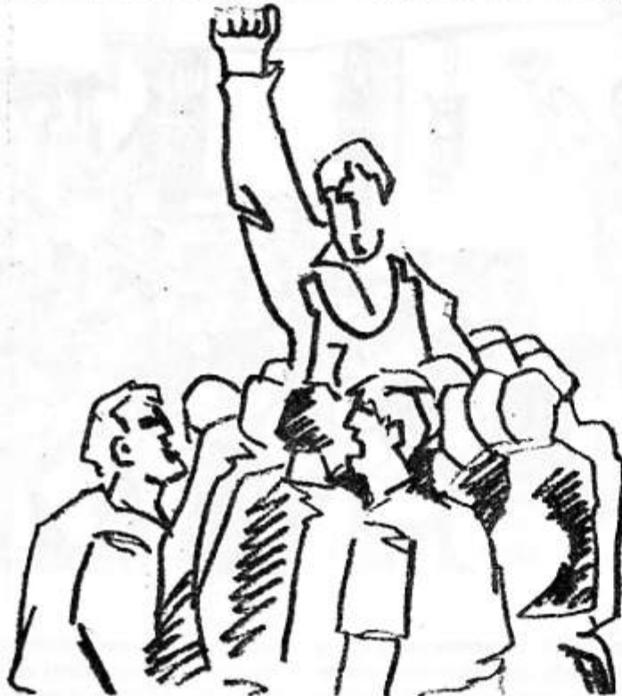
La Marxa realizará una serie de actos de explicación, discusión y movilización alrededor de los cuatro puntos de la Asamblea de Catalunya.

Vale la pena destacar la colaboración de diferentes sectores del pueblo catalán (Colegios de Médicos, Abogados, etc.) que en la medida de sus posibilidades están