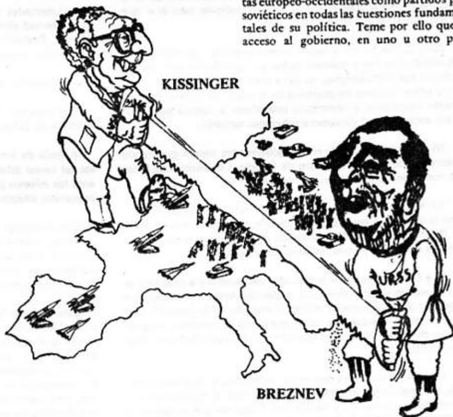
LA "DOCTRINA SONNENFELDT": UN PLAN PARA REPARTIRSE EUROPA

La razón principal de estas advertencias es que el actual gobierno norteamericano considera a estos Partidos Comunistas europeo-occidentales como partidos prosoviéticos en todas las cuestiones fundamentales de su política. Teme por ello que su acceso al gobierno, en uno u otro país,