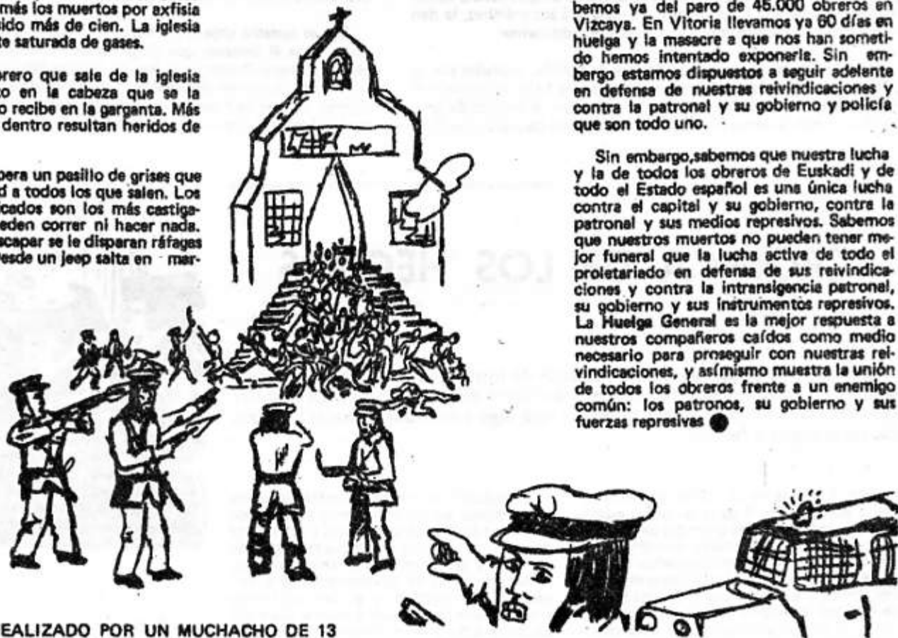
DIBUJO REALIZADO POR UN MUCHACHO DE 13 AÑOS DE 8º DE E.G.B. DE BARCELONA. EN EL REPRESENTA LA MATANZA DE LA IGLESIA DE S. FRANCISCO DE ASIS EN VITORIA.

Sin embargo, sabemos que nuestra lucha y la de todos los obreros de Euskadi y de todo el Estado español es una única lucha contra el capital y su gobierno, contra la patronal y sus medios represivos. Sabemos que nuestros muertos no pueden tener mejor funeral que la lucha activa de todo el proletariado en defensa de sus reivindicaciones y contra la intransigencia patronal, su gobierno y sus instrumentos represivos. La Huelga General es la mejor respuesta a nuestros compañeros caídos como medio necesario para proseguir con nuestras reivindicaciones, y asimismo muestra la unión de todos los obreros frente a un enemigo común: los patronos, su gobierno y sus fuerzas represivas ●