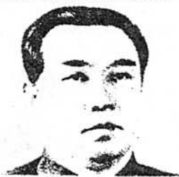
KIM IL SUNG Secretario general del Partido del Trabajo de Corea y gran dirigente del pueblo coreano.

Los imperialistas tratan de "justificar" estos hechos —cosa por otra parte ya inútil a los ojos de los pueblos— diciendo que temen de un momento a otro un ataque por parte de Corea del Norte. Es más, Schlessinger —Secretario de Defensa del gobierno de los Estados Unidos— insulta abiertamente a la República Popular Democrática de Corea calificando a su pueblo como "el más agresivo del mundo"... ¡y son precisamente los imperialistas quienes lanzan una afirmación de este calibre!