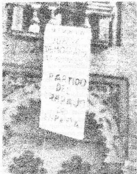
Pancarta colocada en la Giralda de Sevilla, en las jornadas de lucha democrática los días 23, 24 y 25 de junio.

Es la unidad de acción de las fuerzas integradas en la Junta Democrática de Madrid