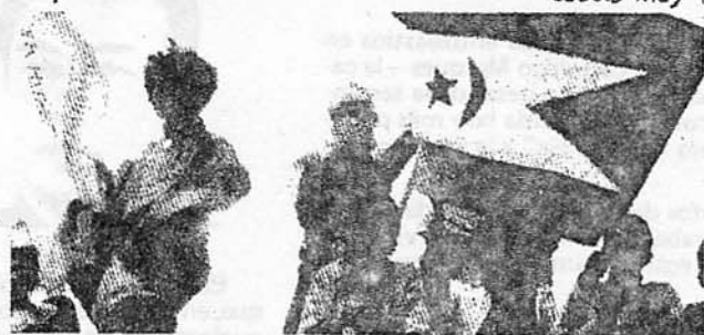
Las masas saharauíes reconocen al Frente POLISARIO como su dirigente político y legítimo representante. El pueblo del Sáhara lo dejó bien patente a raíz de la visita de la delegación de la ONU manifestándose públicamente en todo el país con sus banderas.

Porque si de verdad desean "proteger" al pueblo saharauí, lo primero que estos señores deben hacer es abandonar sus proyectos de dominación, pues ellos son el enemigo