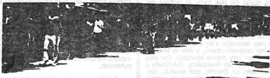
MARCHA DE ESTUDIANTES POR SUS REIVINDICACIONES ACADÉMICAS Y DEMOCRÁTICAS. (Mayo 1.975, Barcelona)

No hay que caer en las provocaciones. El grado de madurez alcanzado por el movimiento estudiantil el año pasado, le permitirá sortear con eficacia estos escollos y dejar claro que serán las masas estudiantiles y no el gobierno, los que decidan cómo y cuándo y por qué se va a actuar.