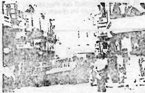
Manifestación convocada por el Comité Local de Burgos del Partido del Trabajo de España en el pasado mes de julio, contra los consejos de guerra, los despidos y detenciones y por la amnistía.

audacia propias de los comunistas, por parte de todos los militantes del Partido. Estas intervenciones recibieron el aplauso entusiasta de todos los asistentes.