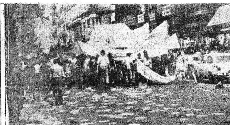
6.000 personas se manifiestan en las Ramblas de Barcelona el día 4, al llamamiento del Partido del Trabajo de España.

El día 4 nuestro Partido convocó en su nombre una manifestación a las 8 de la noche en el centro de la ciudad, como culmi-