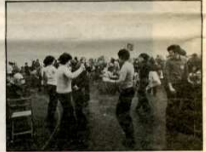
Alegría en los asistentes