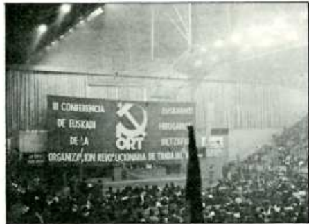
Mitin en el Pabellón de los Deportes de Bilbao.