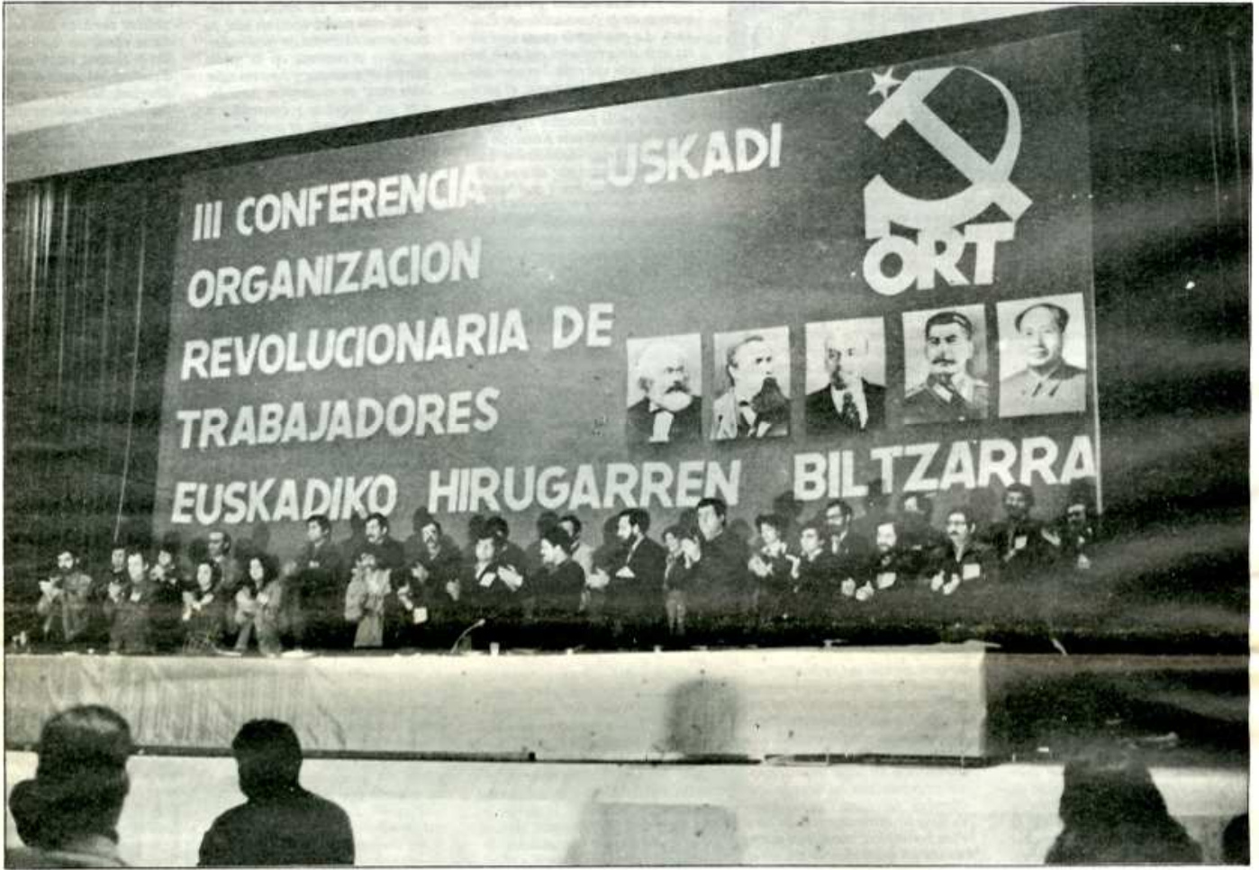
MESA PRESIDENCIA DE LA III CONFERENCIA NACIONAL DE EUSKADI, EN EL AULA MAGNA DE LA UNIVERSIDAD DE LEJONA EN BILBAO