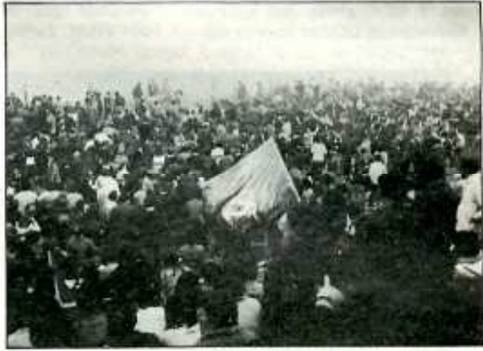
Aspecto de la fiesta en Gallarta.