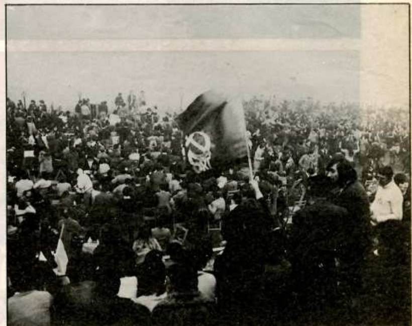
Un aspecto de la fiesta