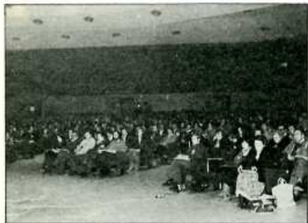
Vista de la sala de delegados.