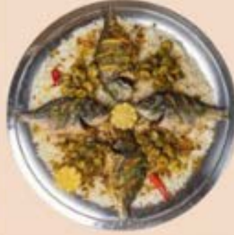
صينية سمك و زبيب