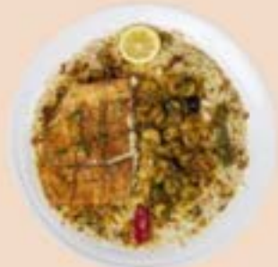
فيليه سمك و زبيب