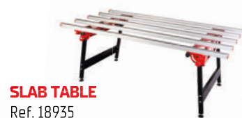
SLAB TABLE Ref. 18935