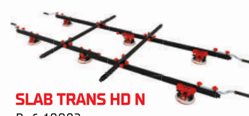
SLAB TRANS HD N Ref. 18982