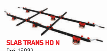
SLAB TRANS HD N Ref. 18982