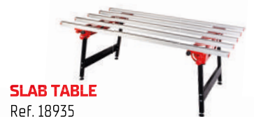
SLAB TABLE Ref. 18935