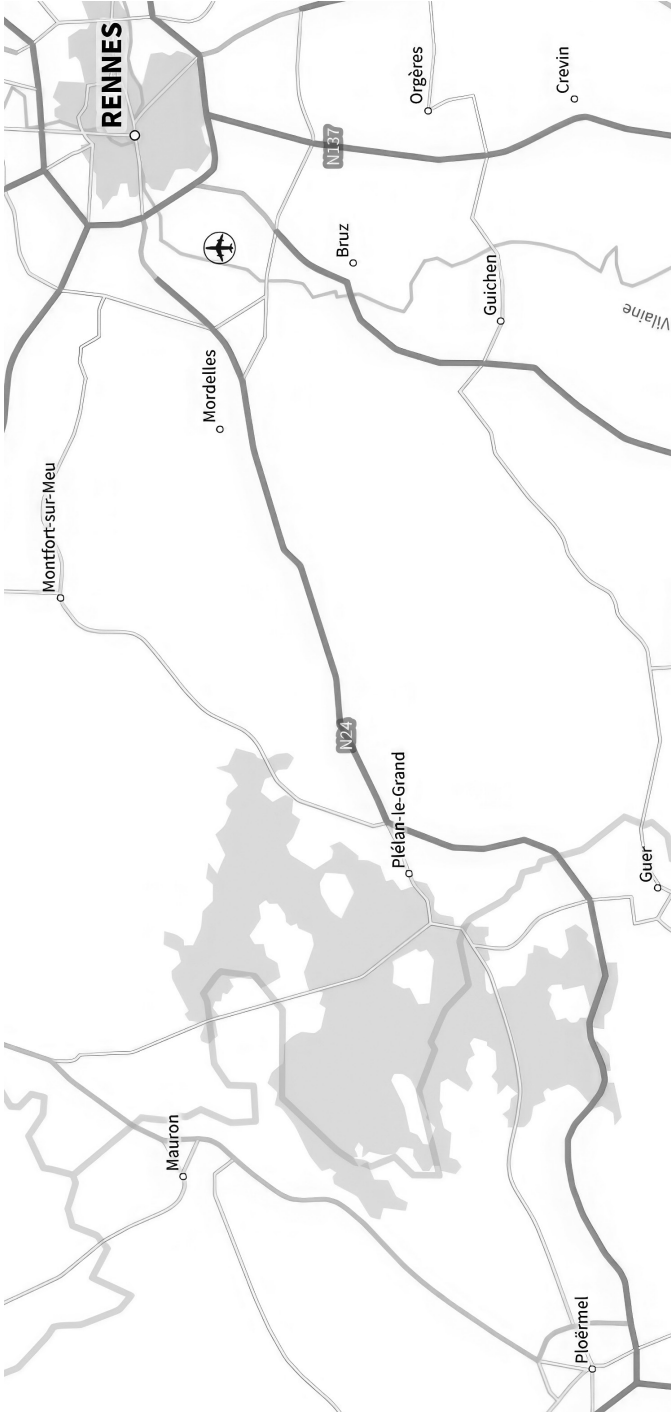
CARTE 1. – Localisation de la forêt de Paimpont (en grisé sur la carte).