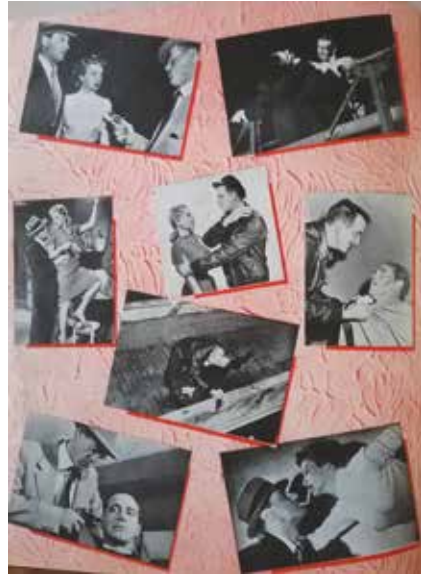
• Illustration 10. – Brochure promotionnelle pour le film 99 River Street .