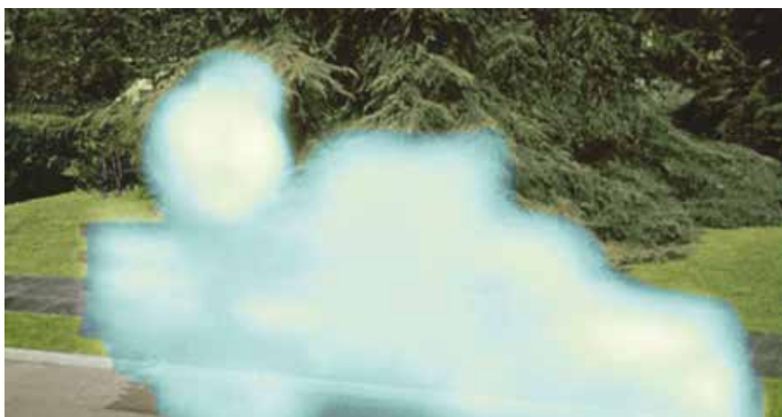
• Illustration 16. – Earth vs. the Flying Saucers . Fred F. Sears, Clover Productions, 1956.