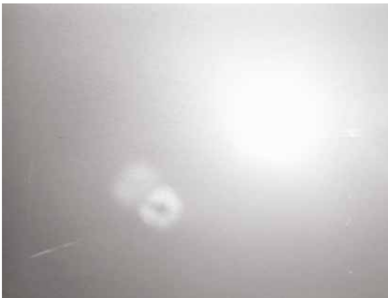
• Illustration 21. – The Big Combo . Joseph H. Lewis, Allied Artists, 1955.