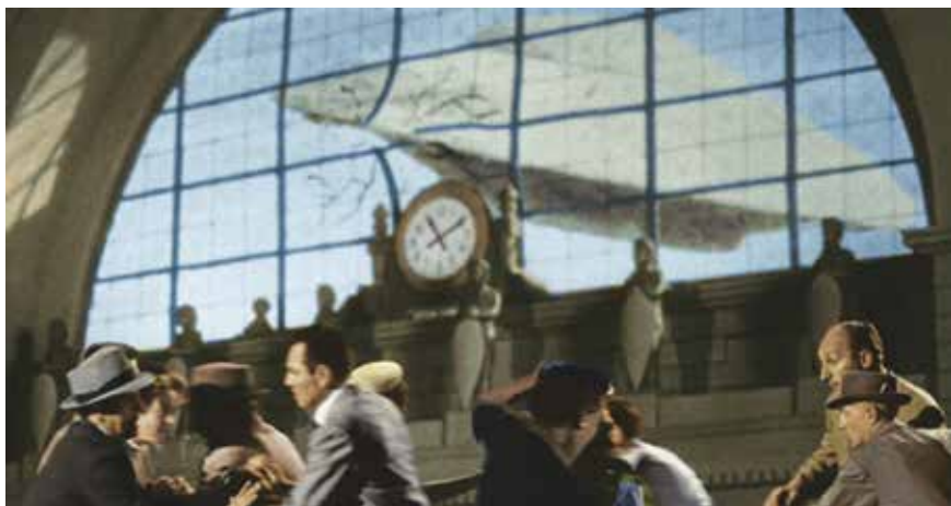
• Illustration 15. – Earth vs. the Flying Saucers . Fred F. Sears, Clover Productions, 1956.