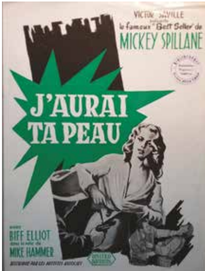
• Illustration 7. – Brochure promotionnelle pour le film I, the Jury . Archives de la Bibliothèque historique de la Ville de Paris, département des éphémères.