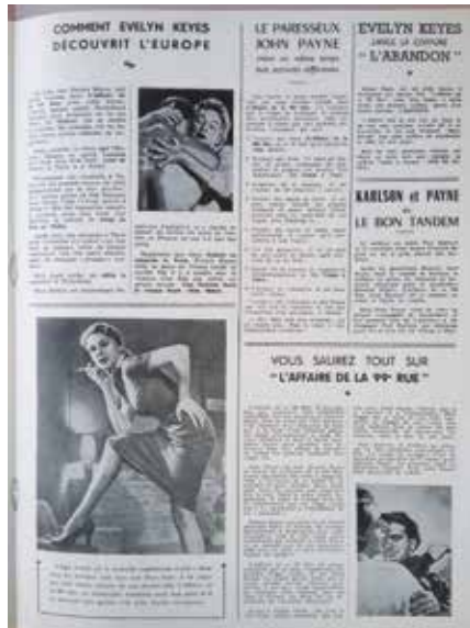
• Illustration 12. – Brochure promotionnelle pour le film 99 River Street . Archives de la Bibliothèque historique de la Ville de Paris, département des éphémères.