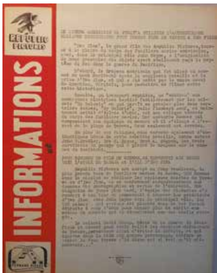
• Illustration 1. – Feuillet de présentation du film Sands of Iwo Jima destiné aux exploitants.