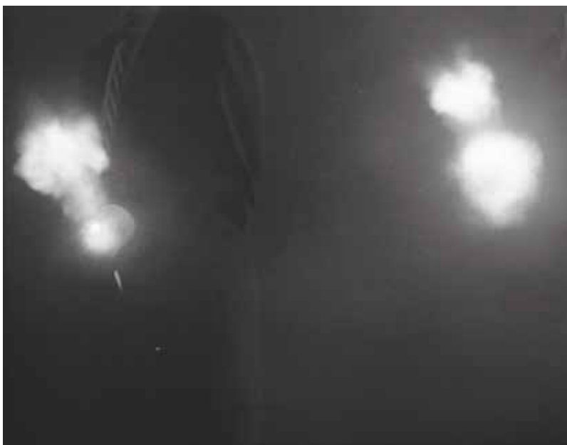
• Illustration 22. – The Big Combo . Joseph H. Lewis, Allied Artists, 1955.