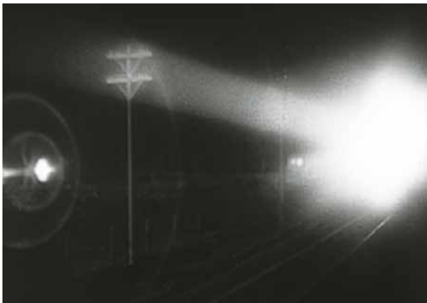
• Illustration 19. – The Narrow Margin . Richard Fleischer, RKO, 1952.