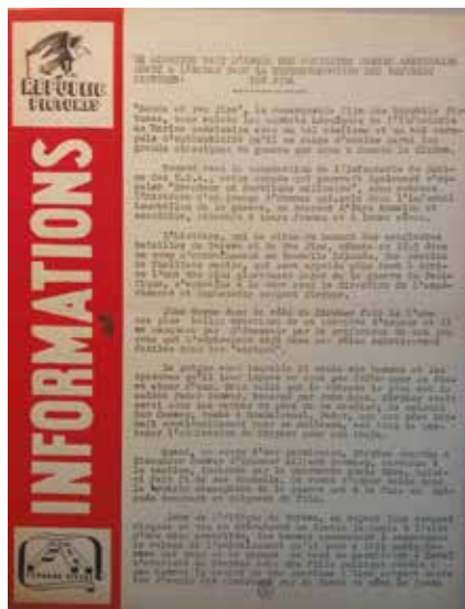
• Illustration 2. – Feuillet de présentation du film Sands of Iwo Jima destiné aux exploitants.