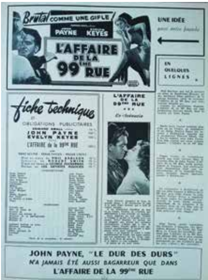
• Illustration 11. – Brochure promotionnelle pour le film 99 River Street . Archives de la Bibliothèque historique de la Ville de Paris, département des éphémères.