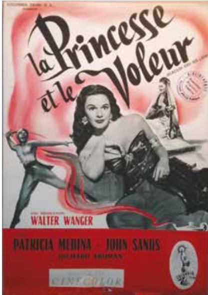
• Illustration 5. – Brochure promotionnelle pour le film Aladdin and His Lamp .