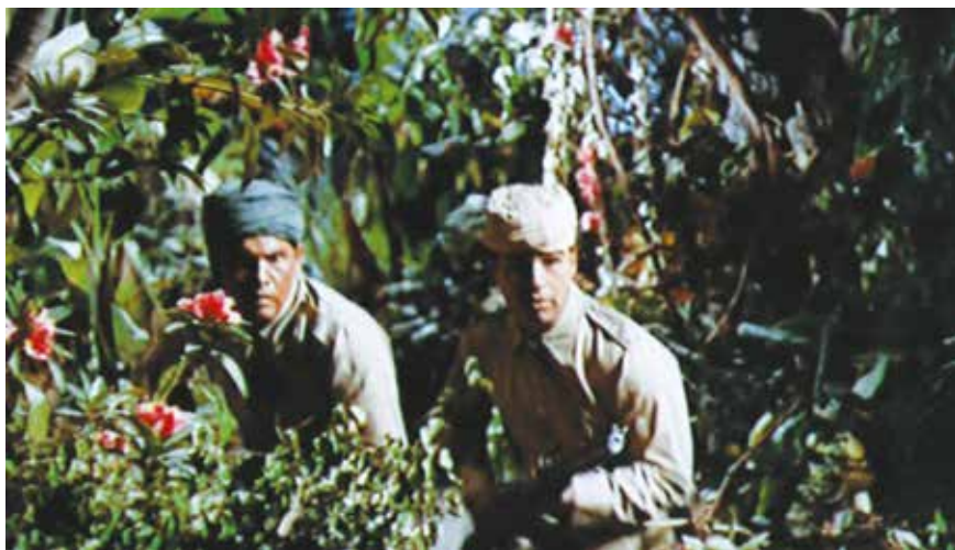
● Illustration 13. – Escape to Burma . Allan Dwan, Benedict Bogeaus Production, 1955.