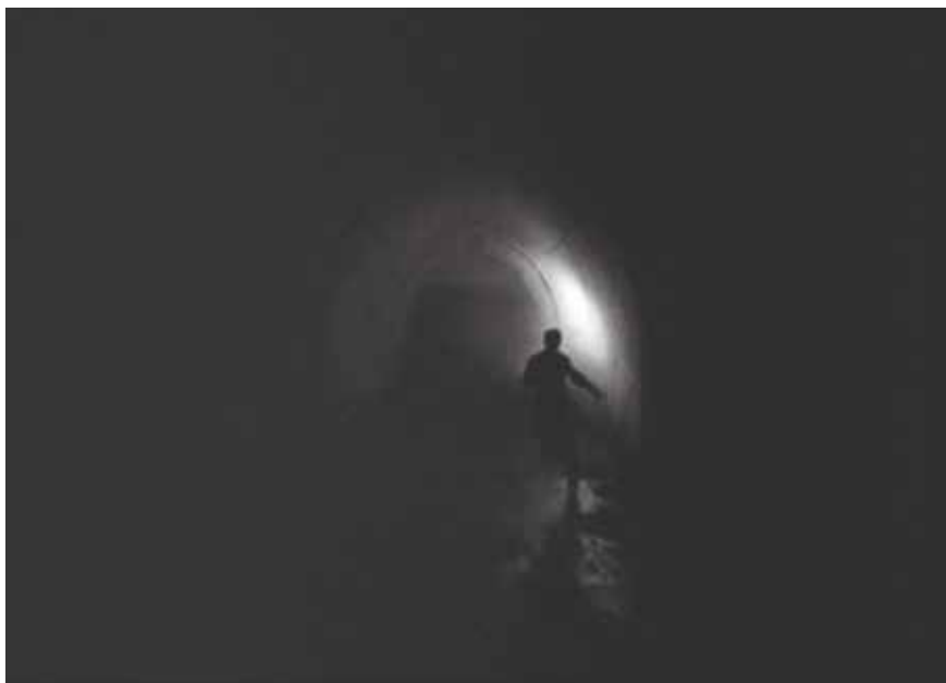
● Illustration 18. – He Walked by Night . Alfred Werker, Bryan Foy Productions, 1948.