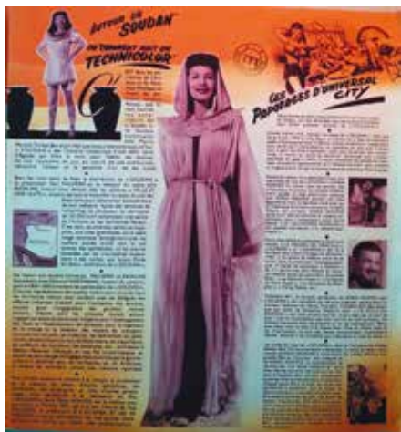
• Illustration 3. – Brochure promotionnelle pour le film Sudan .