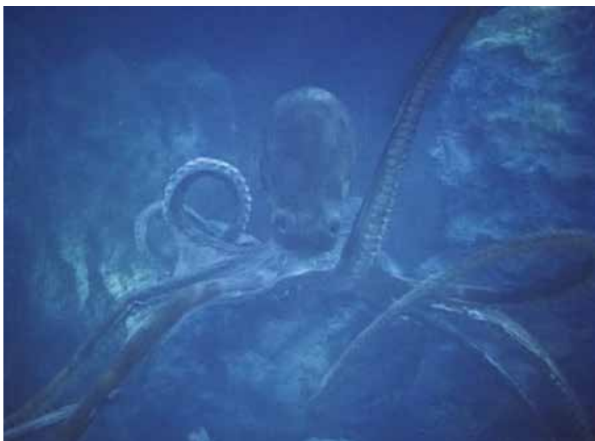
● Illustration 14. – Pearl of the South Pacific . Allan Dwan, Benedict Bogeaus Production, 1955.