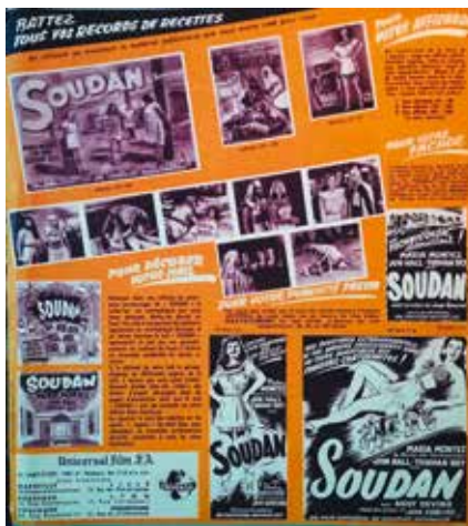
• Illustration 4. – Brochure promotionnelle pour le film Sudan .