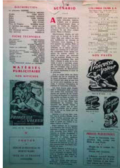
• Illustration 6. – Brochure promotionnelle pour le film Aladdin and His Lamp .