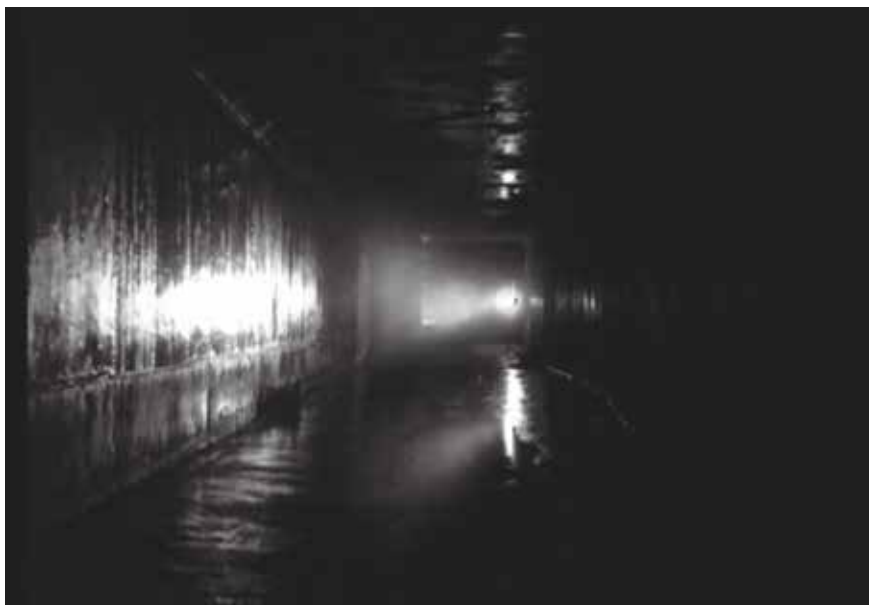
● Illustration 17. – He Walked by Night . Alfred Werker, Bryan Foy Productions, 1948.