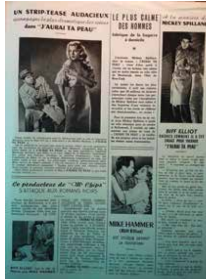
• Illustration 8. – Brochure promotionnelle pour le film I, the Jury .