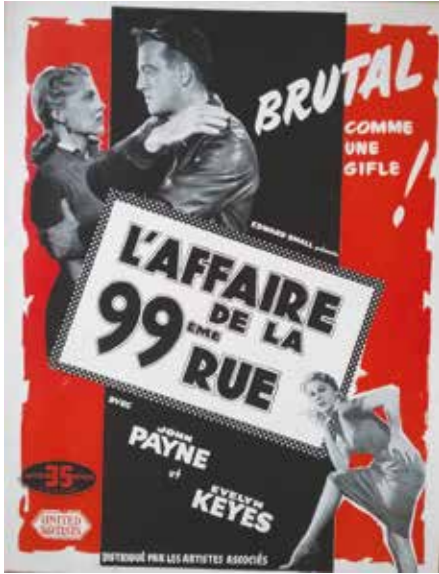
• Illustration 9. – Brochure promotionnelle pour le film 99 River Street . Archives de la Bibliothèque historique de la Ville de Paris, département des éphémères.