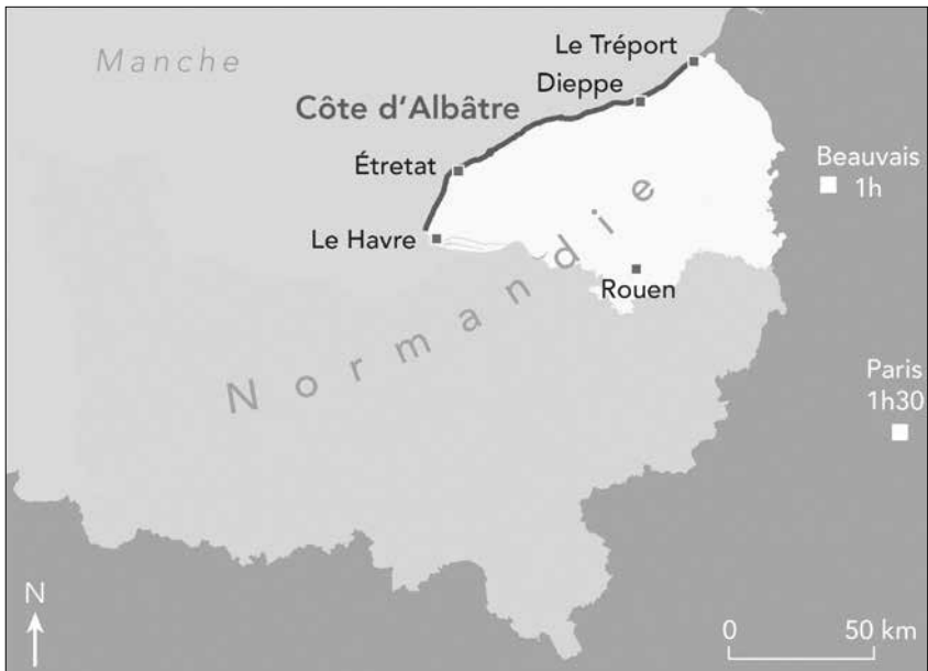
Carte 1. La côte d'Albâtre, du Havre au Tréport (Seine-Maritime).

Retracer l'histoire d'Étretat entre le début des années 1850 et l'aube des années 1960 signifie d'abord relater l'histoire du fait balnéaire sur la Côte d'Albâtre (Seine-Maritime). De façon plus générale, la balnéarisation des villes et littoraux maritimes est un phénomène marquant de cette période à cheval sur deux siècles, aussi bien en France qu'en Europe ou dans le reste du monde. En ces prémisses, ce processus s'inscrit dans l'essor d'un second type de voyage d'agrément, la villégiature, qui peut être tenue pour une forme de « sédentarité nouvelle 1 ».