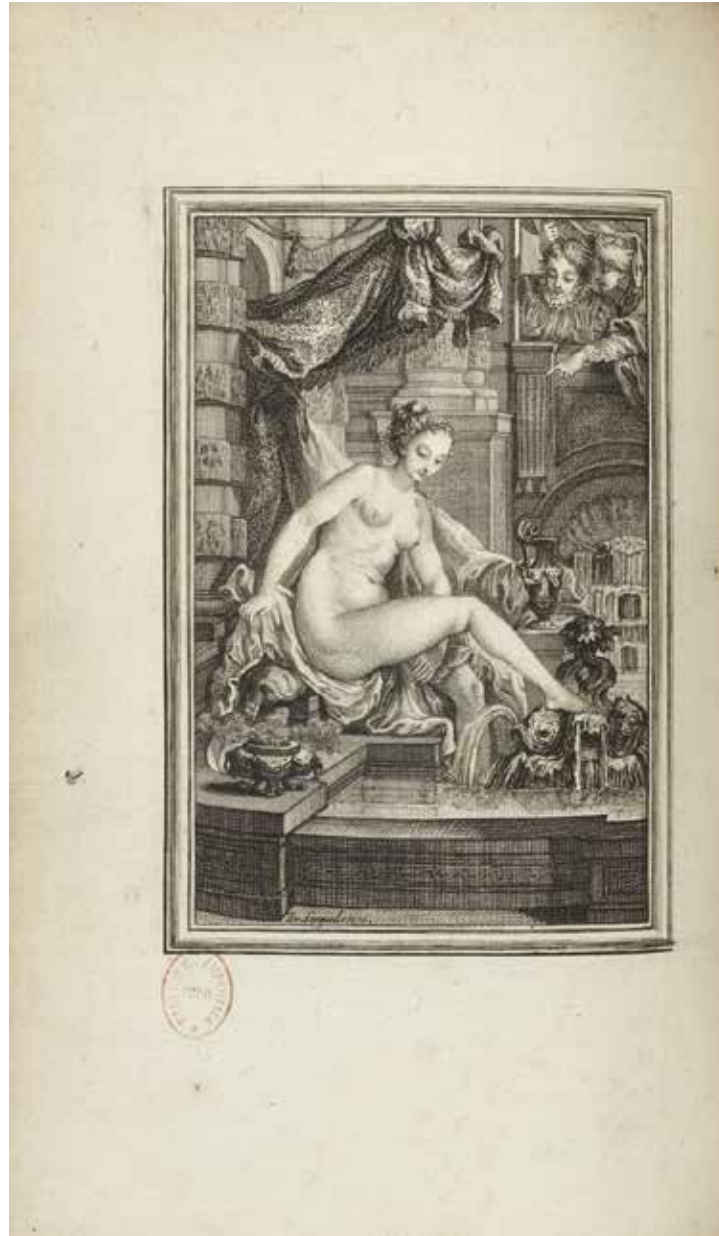
Fig. 25. C. Eisen, « Le roi Candaule et le maître en droit », Contes et Nouvelles en vers de La Fontaine , Amsterdam [Paris], [Barbou], 1762, planche 66, Paris, BnF.