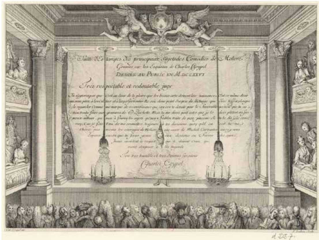
Fig. 46. C.-A. Coypel, Frontispice de la Suite d'Estampes des principaux sujets des Comédies de Molière , gravure de F. Joullain, Paris, Surugue, 1726, Paris, BnF.