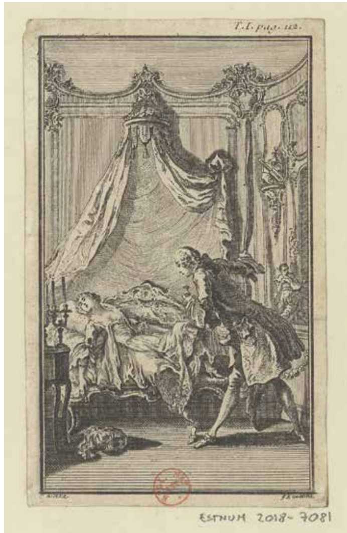
Fig. 42. C. Eisen (dessin), « Zobéide évanouie », gravure de F.-A. Aveline, Angola , [Paris], [s. n.], 1751, t. I, en regard de la page 112, Paris, BnF.