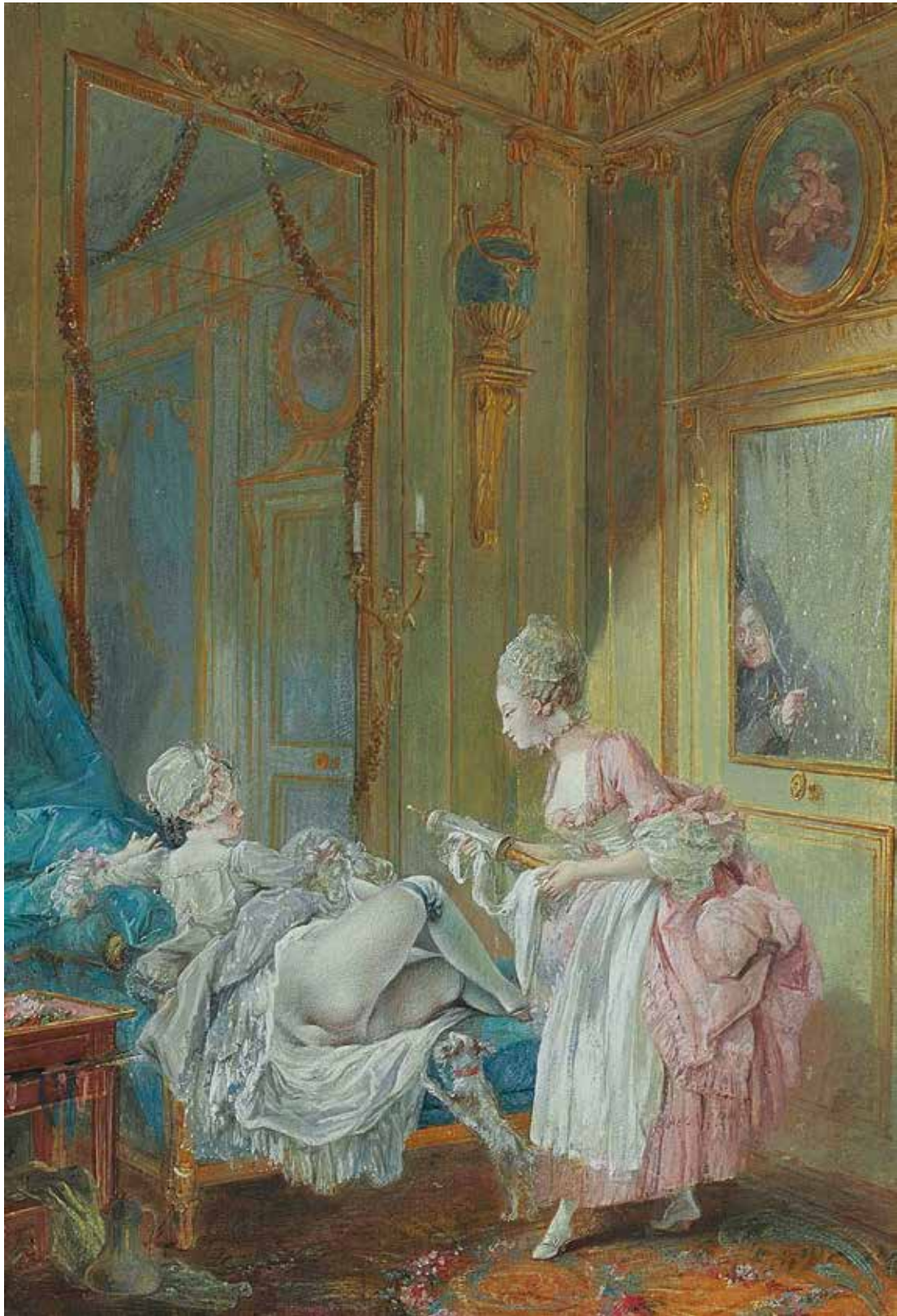
Fig. 38. J.-A. Baudouin, Le Curieux , dit aussi Le Clystère ou L'Indiscret , entre 1763 et 1769, 31,5 x 21,5 cm, collection particulière, © 2014 Christie's Images Limited.