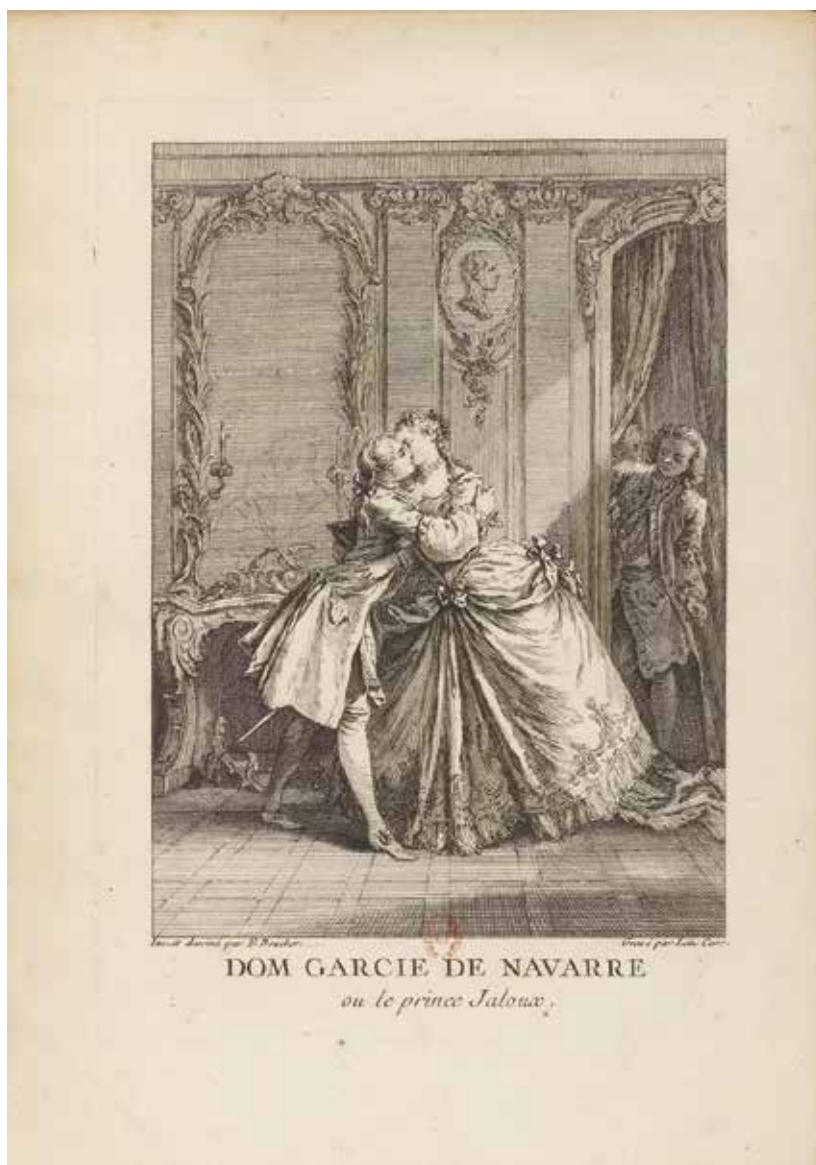
Fig. 47. F. Boucher, Frontispice de Dom Garcie de Navarre , gravure de L. Cars, Œuvres de Molière , Paris, Prault, 1734, t. II, entre les pages 2 et 3, Paris, BnF.