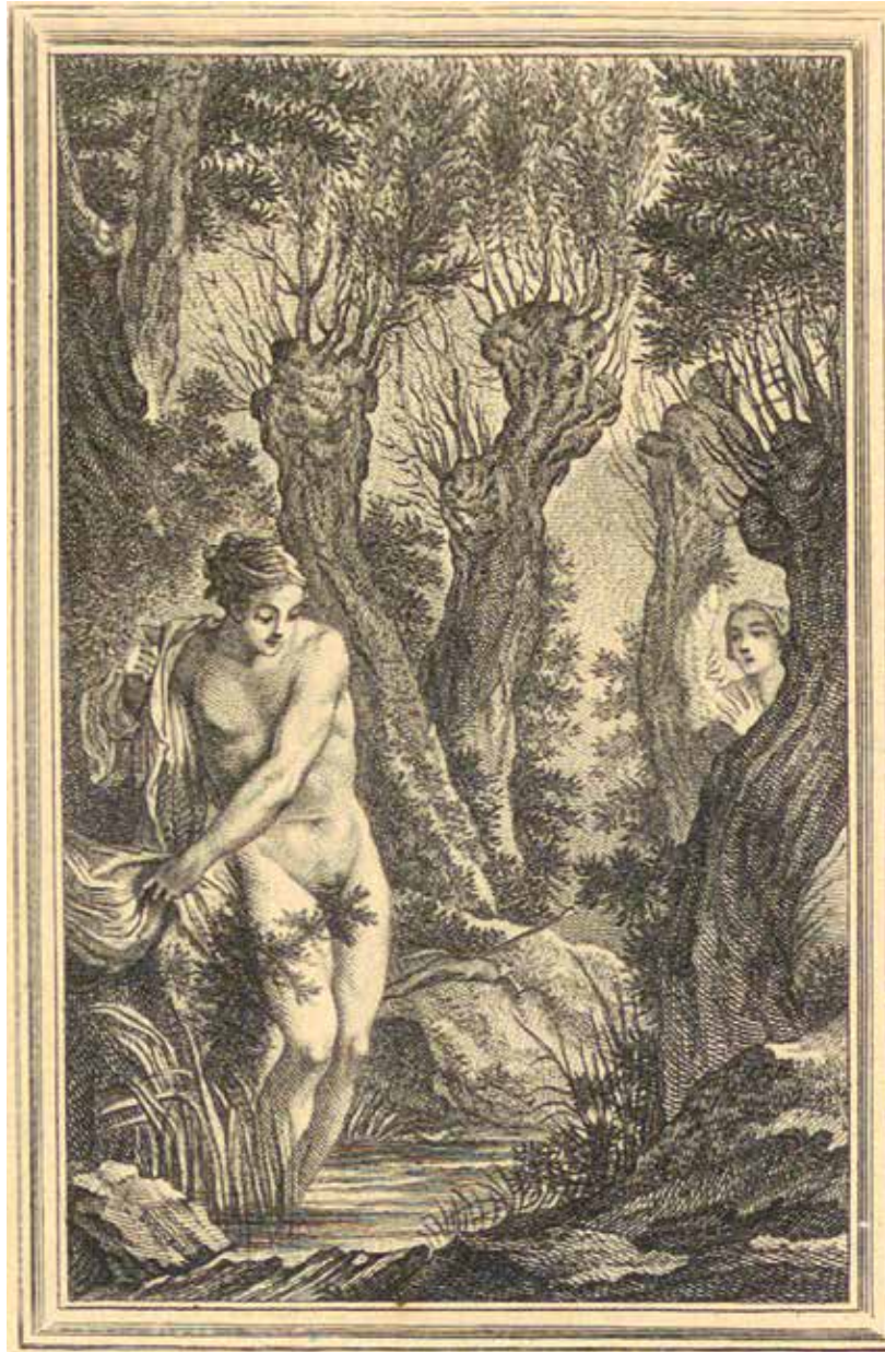
Fig. 24bis. C. Eisen, « Le cas de conscience », Contes et Nouvelles en vers de La Fontaine , Amsterdam [Paris], [Barbou], 1762, Zurich, ETH-Bibliothek.