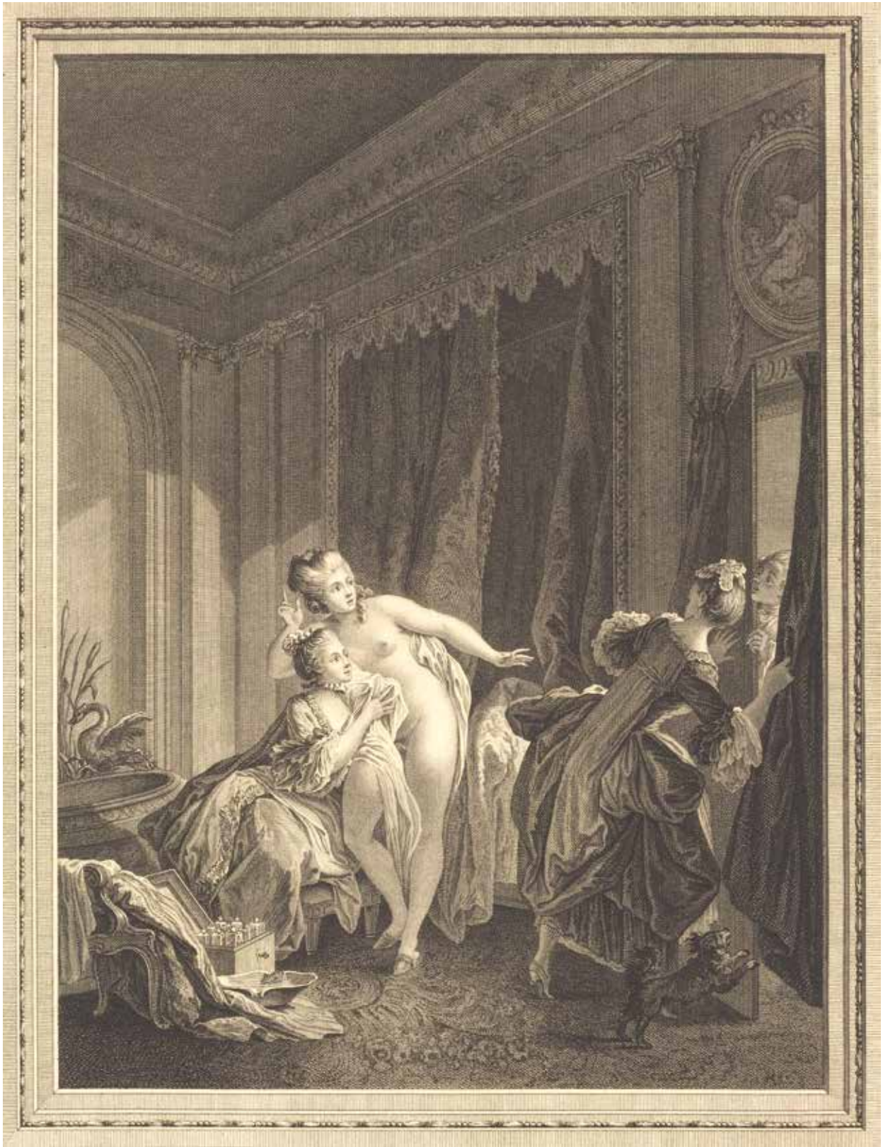
Fig. 33. P.-A. Baudouin (d'après), Le Soir , gravure de De Ghendt, v. 1778, Washington, National Gallery of art, Widener Collection, Courtesy National Gallery of Art, Washington.