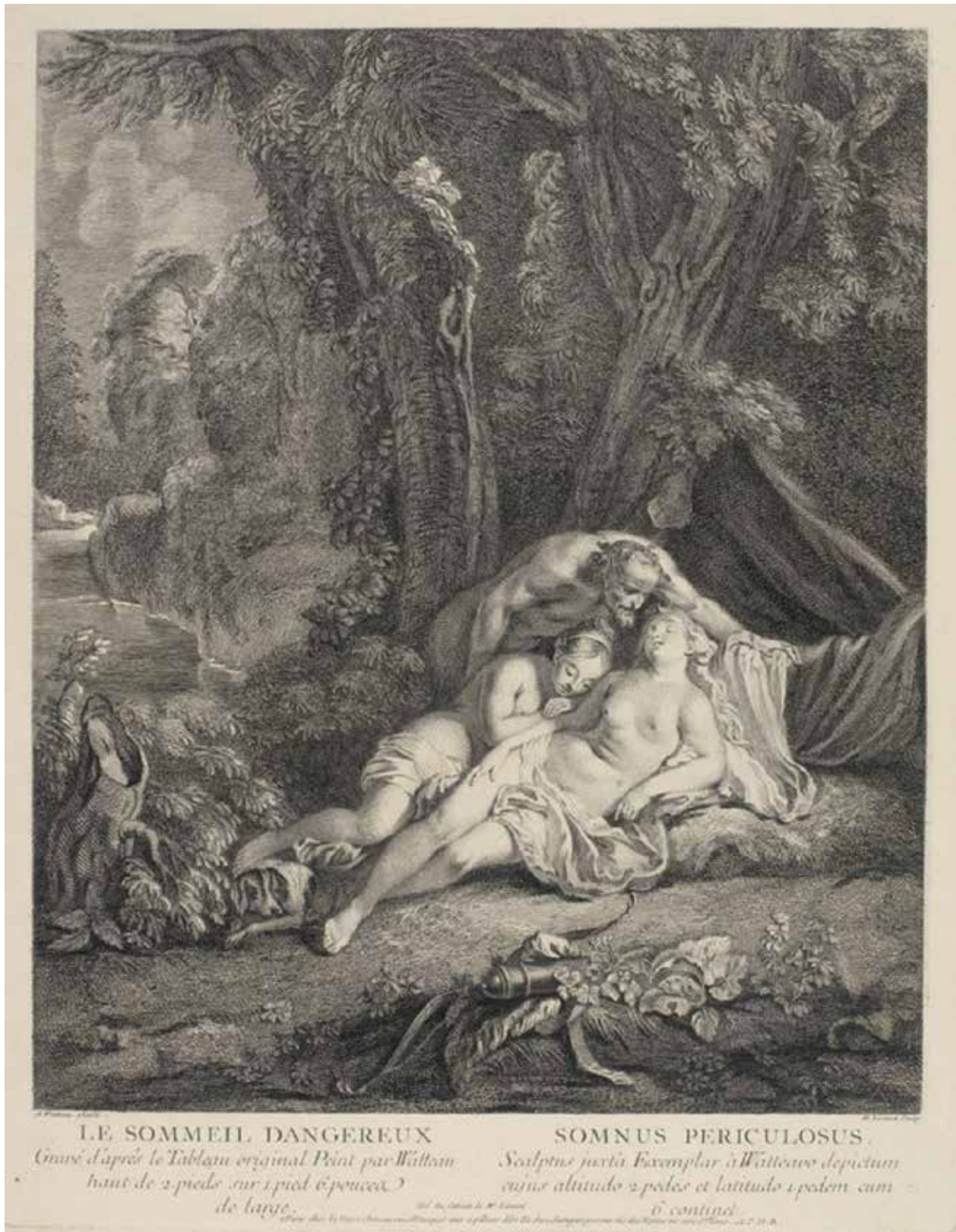
Fig. 34. J.-A. Watteau (d'après), Le Sommeil dangereux , gravure de J.-E. Liotard, s. d., Paris, musée du Louvre, © GrandPalaisRmn, Angèle Dequier.