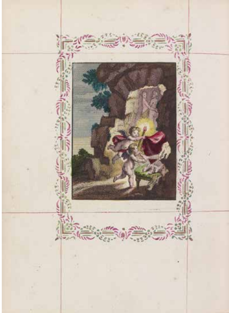
Fig. 41. A. C. de Caylus (attribué à), planche dite « Les petits pieds », colorisée, v. 1728, Daphnis et Chloé , en regard de la page 159, [Paris], [Coustellier], 1745, Paris, BnF.