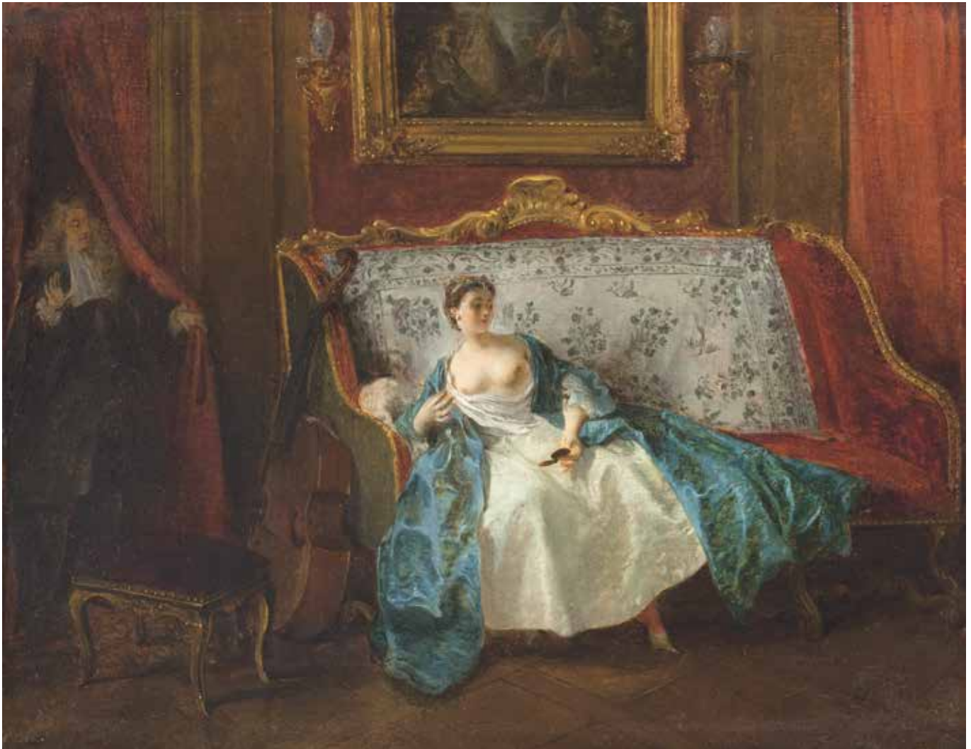
Fig. 37. N. Lancret, Jeune femme sur un canapé / Young woman on a sofa, v. 1735-1740, 23 x 32 cm, Los Angeles, Collection of Lynda and Stewart Resnick