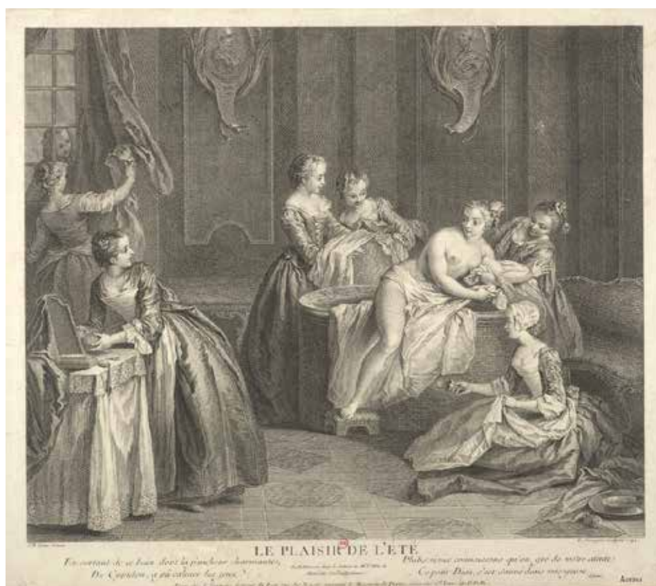
Fig. 30. J.-B. Pater (d'après), Les Plaisirs de l'été , gravure de L. Surugue, 1744, Paris, BnF.