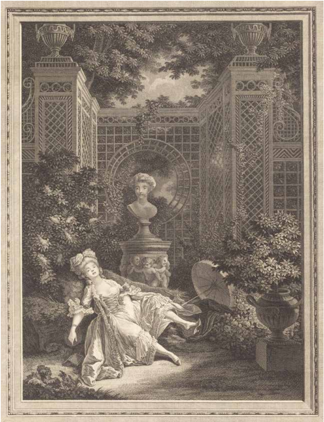
Fig. 29. P.-A. Baudouin (d'après), Le Midi , gravure de De Ghendt, s. d., Washington, National Gallery of art, Widener Collection, Courtesy National Gallery of Art, Washington.