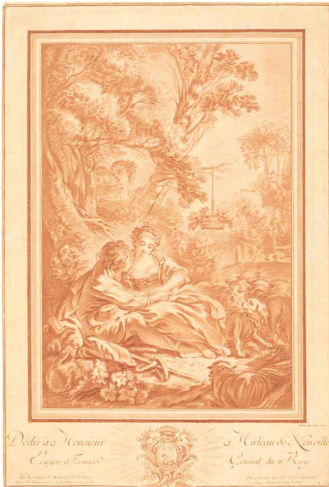
Fig. 36. F. Boucher (d'après), Two Lovers Seated at the Foot of a Large Tree, Surprised by Two Girls , gravure de G. Demarteau, s. d., Washington, National Gallery of Art, Courtesy National Gallery of Art, Washington.