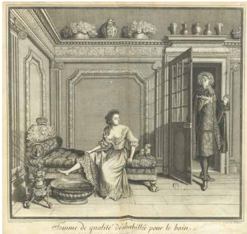
Fig. 31. J. Dieu de Saint-Jean (d'après), Femme de qualité déshabillée pour le bain , gravure de N. Bazin, 1685, Paris, BnF.