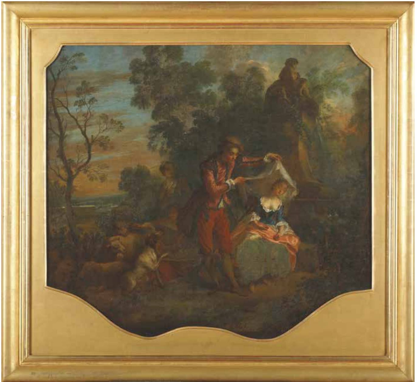
Fig. 43. N. Lancret, Le Berger indiscret ou La Bergère endormie , 1743, 84 × 95 cm, Tours, musée des Beaux-Arts, © musée des Beaux-Arts de Tours, D. Couineau.