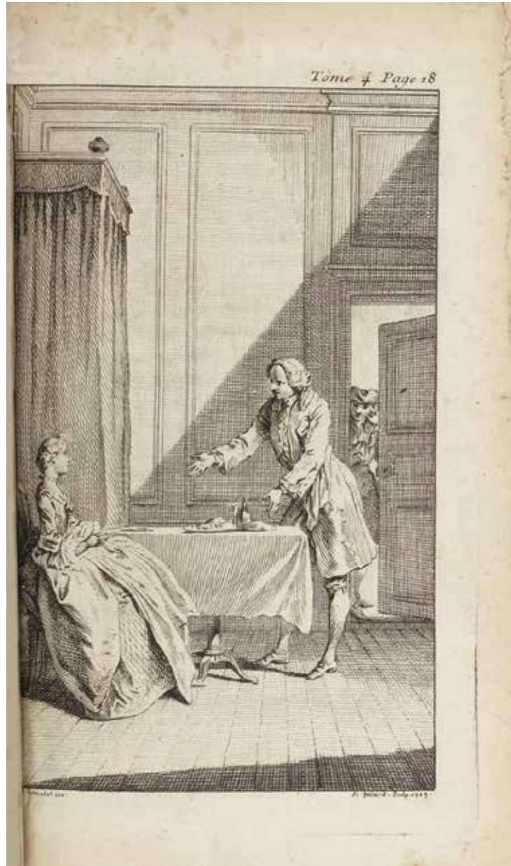
Fig. 39. H. Gravelot, « Western épie le dîner de Sophie », Tom Jones , Londres [Paris], chez J. Nourse, 1750, t. IV, XVI, 2, en regard de la page 18, Paris, BnF.