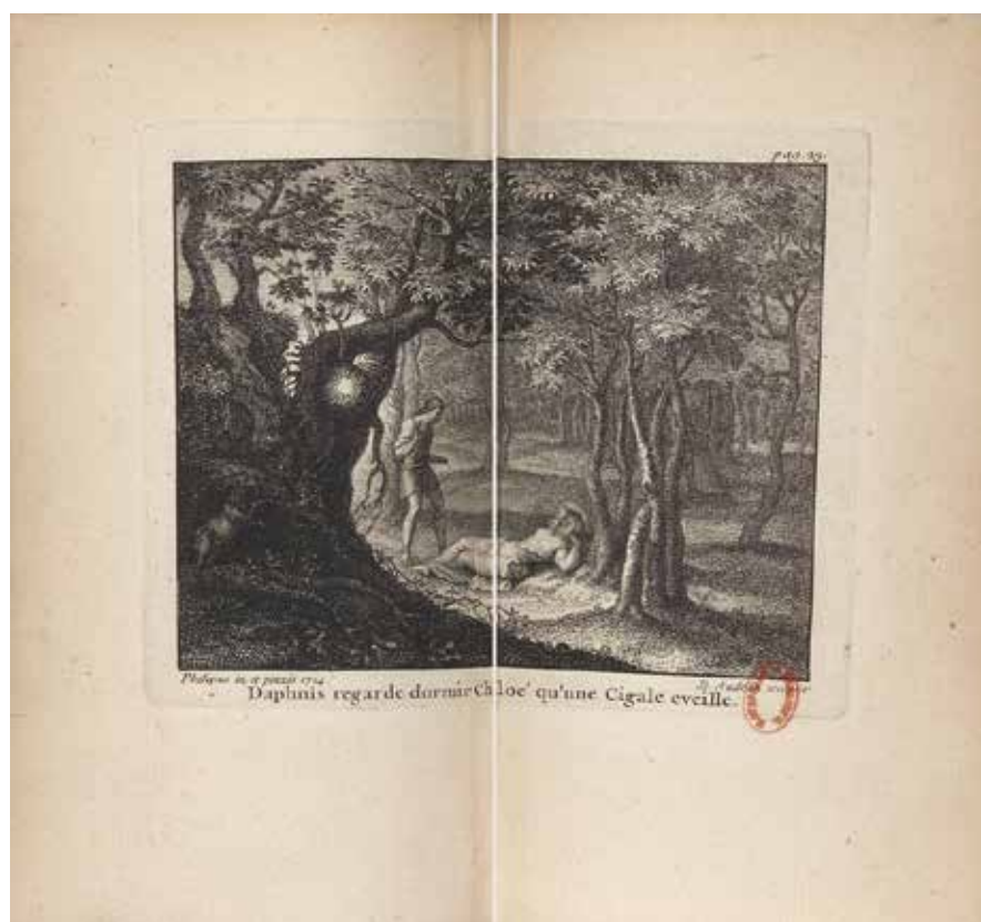
Fig. 40. P. d'Orléans (dessin), « Daphnis regarde dormir Chloé qu'une cigale éveille », gravure de G. Audran, Daphnis et Chloé , [Paris], [Quillau] 1718, entre la page 22 et 23, Paris, BnF.