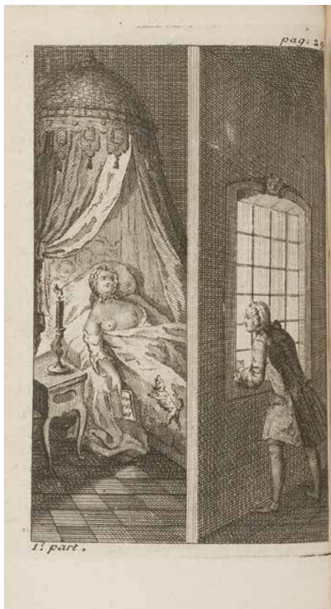
Fig. 27. « Mon bonheur voulut qu'il fit une extrême chaleur, les fenêtres restèrent ouvertes, les rideaux ne furent point tirés » [anonyme], Les Sonnettes , À Berg-Op-Zoom, chez F. de Richebourg, 1751, en regard de la page 29, Paris, BnF.