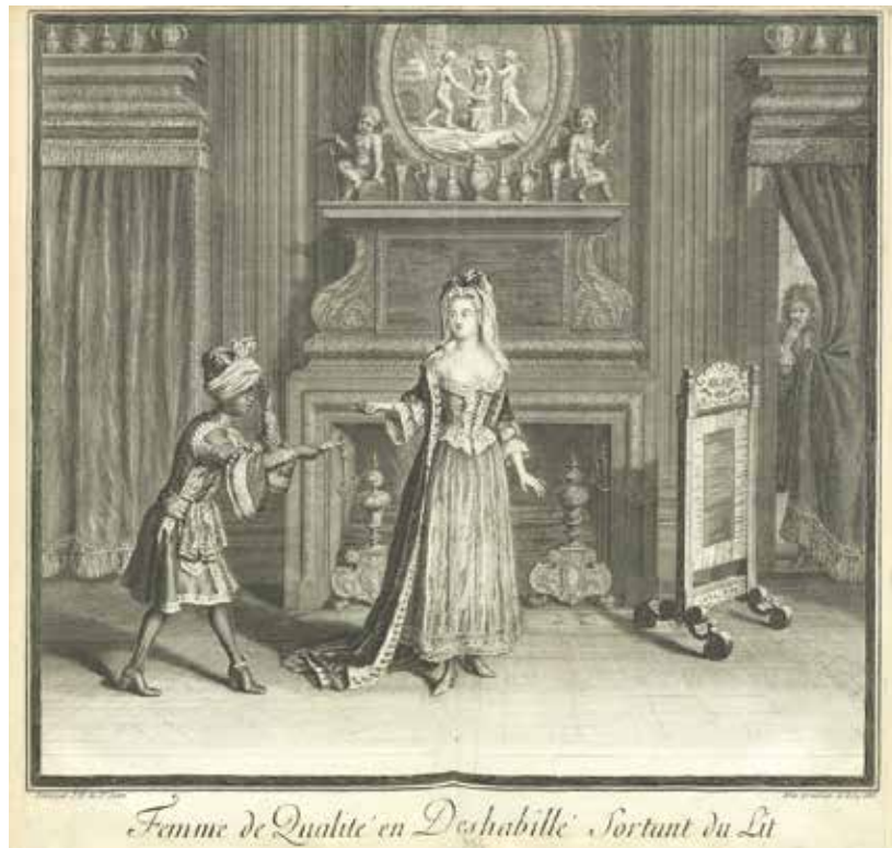
Fig. 32. J. Dieu de Saint-Jean (d'après), Femme de qualité en déshabillé sortant du lit , 1688, Paris, BnF.