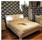
Toda la decoración (rasón de diseño) de este hotel de diseño luso.