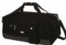
XXL Sac de voyage en nylon, Eastpak x Raf Simone, 250 € www.eastpak.com

Naturel, il ne s'encombre pas de superflu, mais va à l'essentiel, tout en gardant son originalité