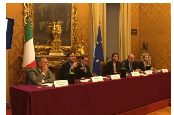
Istantanee di alcune delle conferenze internazionali organizzate dalla Fondazione Oasis in Italia e all'estero con personalità del mondo culturale, accademico, religioso e politico