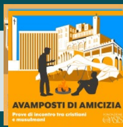
Podcast Avamposti di amicizia: prove di incontro tra cristiani e musulmani (4 ep.)