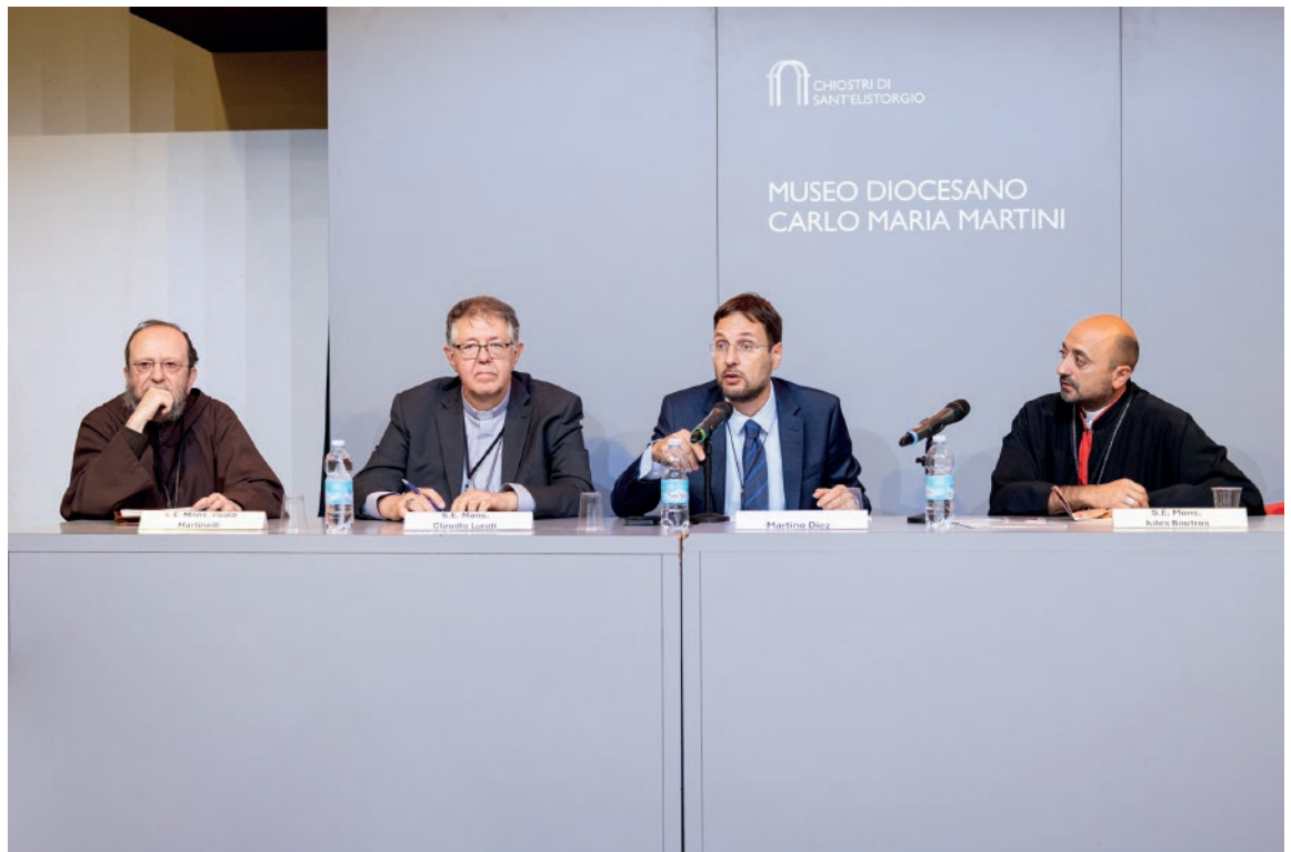
Conferenza internazionale Guerra e migrazione. Ripensare i rapporti tra Occidente e mondo musulmano Settembre 2024

S.E. Mons. Boghos Levon Zekian , Arcivescovo Emerito d'Istanbul degli Armeni