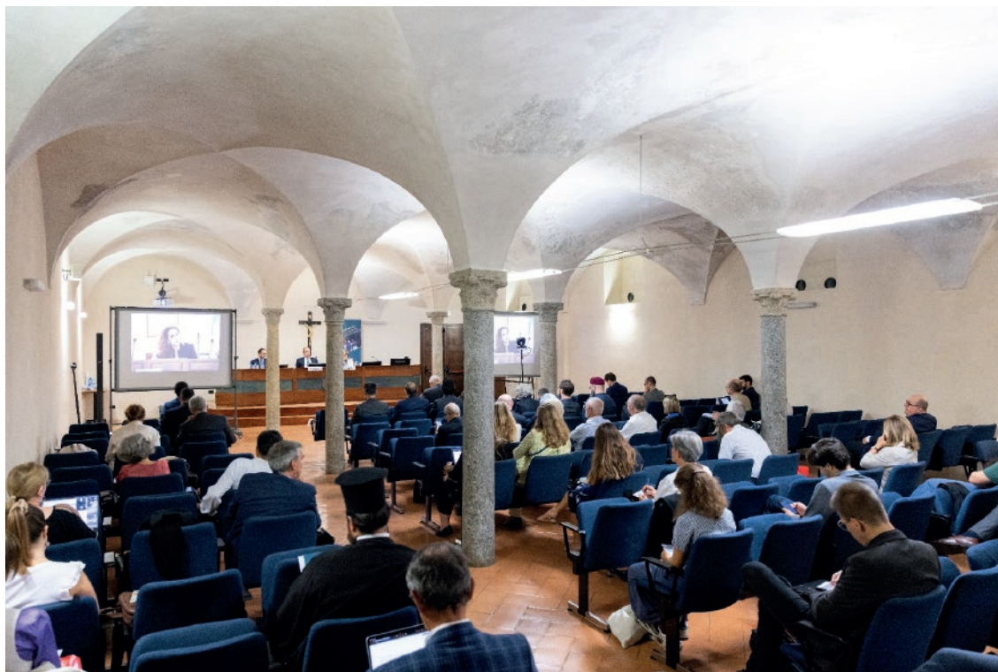
Conferenza internazionale Cambiare rotta. I migranti e l'Europa Settembre 2023

Un ampio Comitato Scientifico Internazionale supporta la Fondazione Oasis nello svolgimento delle proprie attività di ricerca.