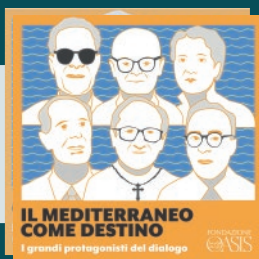
Podcast Il Mediterraneo come destino. I grandi protagonisti del dialogo (6 ep.)

Oasis racconta i suoi progetti di studio ed esperienze significative di dialogo islamo-cristiano anche attraverso podcast, disponibili sulle principali piattaforme.