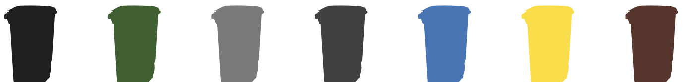
VASTA GAMA DE CORES