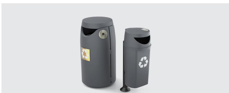
FAMIGLIA DI CESTINI EUROPA

Può essere equipaggiato con una vasta gamma di accessori in grado di fornire soluzioni reali a ogni esigenza.