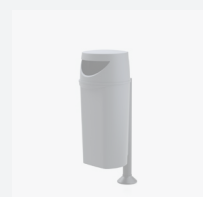
Europa 50 L