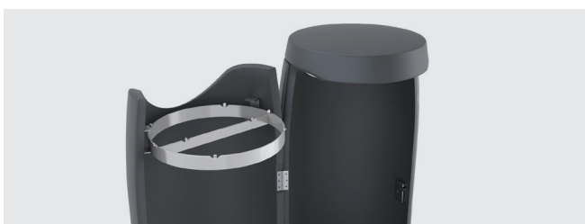
VERSIONE A DOPPIO SCOMPARTO