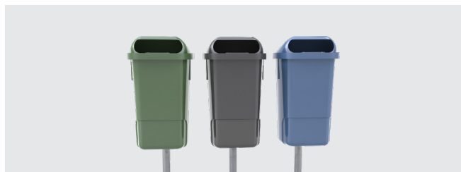
AMPIA GAMMA CROMATICA

Può essere equipaggiato con una vasta gamma di accessori in grado di fornire soluzioni reali a ogni esigenza.