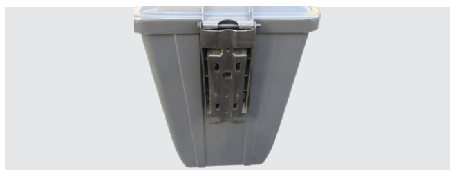
SISTEMA DI FISSAGGIO