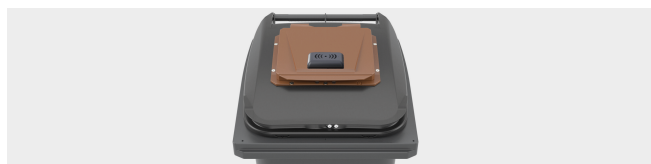
SURCOUVERCLE SERRURE ÉLECTRONIQUE