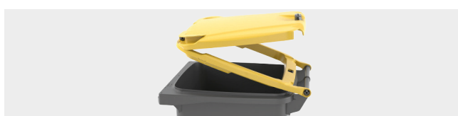
SYSTÈME À DOUBLE COUVERCLE