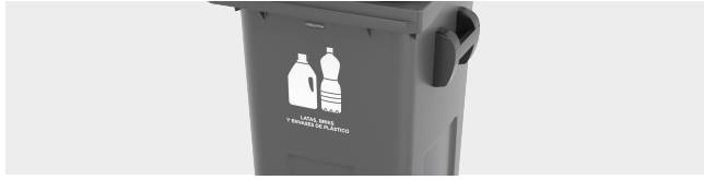
PERSONNALISATION AVEC THERMOIMPRESSION