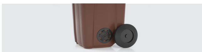
GRILLES D'AÉRATION INFÉRIEURES