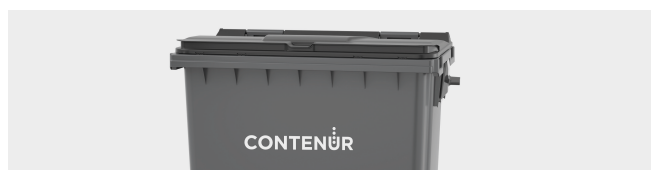
PERSONNALISATION AVEC THERMOIMPRESSION