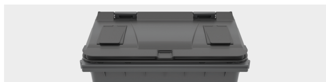
SURCOUVERCLE EN CAOUTCHOUC Dimension utile: 285 x 150 mm