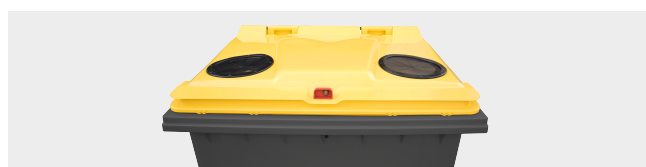
ORIFICE VERRE ET EMBALLAGES