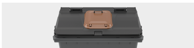
SURCOUVERCLE GRANDES DIMENSIONS Dimension utile: 400 x 330 mm