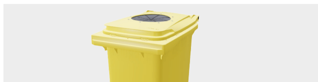
ORIFICE PLASTIQUE ET EMBALLAGES