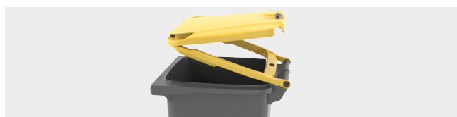
SYSTÈME À DOUBLE COUVERCLE