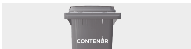
PERSONNALISATION AVEC THERMOIMPRESSION