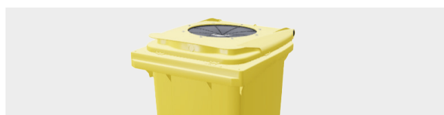
ORIFICE PLASTIQUE ET EMBALLAGES