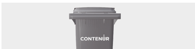
PERSONALIZACIÓN POR TERMOIMPRESIÓN