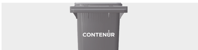
PERSONNALISATION AVEC THERMOIMPRESSION