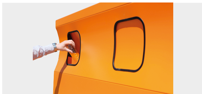
BOCAS DE ACCESO