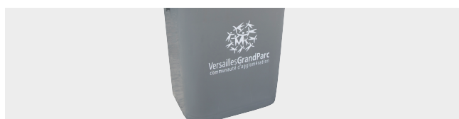
PERSONALIZACIÓN POR TERMO IMPRESIÓN